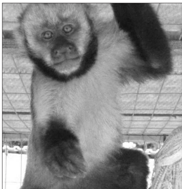
Figura 2. Indivíduo de macaco-prego-do-peito-amarelo ( Cebus xanthosternus ) encontrado em cativeiro na cidade de Jequitinhonha, Minas Gerais.