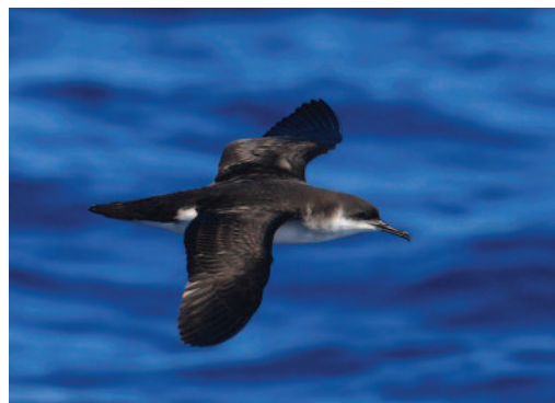
Pardela pichoneta Puffinus puffinus . Aguas al norte de Lanzarote.