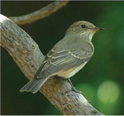
Papamoscas gris Muscicapa striata . San Sebastián de La Gomera (La Gomera).