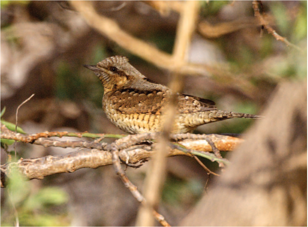
Torcecuello euroasiático Jynx torquilla . Yaiza (Lanzarote).