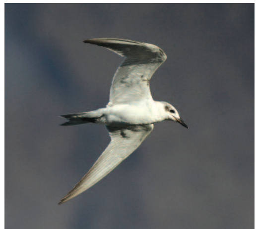
Pagaza piconegra Sterna nilotica . Los Llanos de Aridane (La Palma).

Un ave en la isla de Oreim, embalse de Ullivarri-Gamboa, Álava, el 15 de junio de 2010 (G. Belamendia). Observaciones en el río Guadalquivir, interior de Sevilla: cuatro aves en Las Cabezas de San Juan el 23 de abril de 2009, y en La Algaba dos aves el 9 de abril de 2011 y un ejemplar el