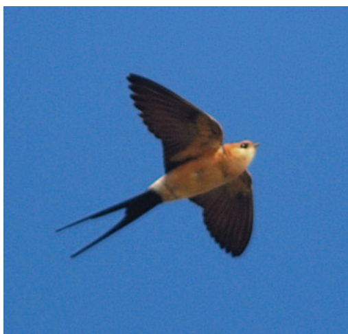
Golondrina dáurica Hirundo daurica . Frontera (El Hierro).

Canarias. En El Hierro, donde hay pocas citas, el 22 de marzo de 2011 sobre estanques y una granja de cerdos de Frontera se observan dos