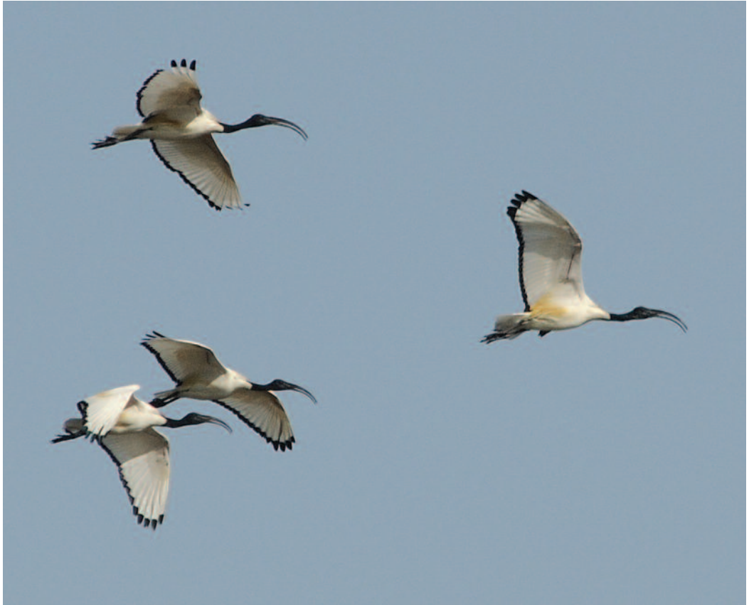
Ibis sagrado Threskiornis aethiopicus . Sotomayor, Algete (Madrid).

B. Dies y A. Guillém). Cifras de interés en la albufera de Valencia: durante el mes de febrero de 2011 se cuentan un número destacable de ejemplares alcanzando el 1 de marzo de 2011 la mayor cifra registrada hasta el momento de 388 ejemplares en 4 grupos a lo largo del Tancat de la Sardina, Catarroja (P. Vera). Dos aves en el saladar de Los Canos, Almería, el 1 septiembre de 2011 (J. L. Pérez Tornell). Observación de 26 individuos en Santander, Cantabria, el 1 de octubre de 2011 (F. González). Grupo de 22 aves en Salburúa, Vitoria, Álava, el 2 de octubre de 2011 (L. Lobo). Un ave en campos de arroz de la Herrerueta, Cáceres, el 1 y 3 de octubre de 2011 (P. Soper). Un individuo en la laguna de Sentiz, Valdepolo, León, el 1 de octubre del 2011 (J. Á. Arriola González).