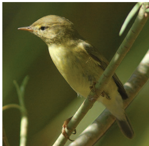
Mosquitero musical Phylloscopus trochilus . San Sebastián de La Gomera (La Gomera).

Tres aves en retamas y pinos en Palos de la Frontera, Huelva, el 5 de diciembre de 2008 (R. Romero y P. Medina). Un ejemplar en lentiscos y encinas de río Grande, Baños de la Encina, Jaén, el 24 de febrero de 2011 (R. Romero).