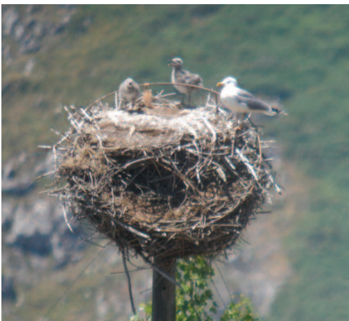
Gaviota patiamarilla Larus michahellis . Embalse de Riaño (León).

Canarias. En Gran Canaria, nueva localidad de cría: el 16 de junio de 2011 en el embalse del Caidero de la Niña, Tejeda, se observa una pareja de adultos y un pollo bastante desarrollado que evita