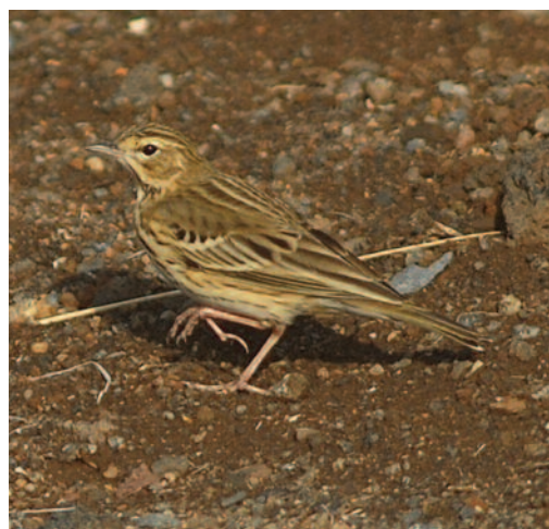
Bisbita arbóreo Anthus trivialis . Puntallana (La Palma).

Canarias. En La Palma, el 10 de abril de 1994, cerca de montaña Colorada, El Paso, se observa un ave; al día siguiente en Tacande de Arriba, El Paso, se detecta otro individuo; el 13 de abril de 1994 en Las Indias, Fuencaliente, hay tres ejemplares y otras tres en El Porvenir, Breña Alta, donde sólo queda una a los dos días posteriores de la