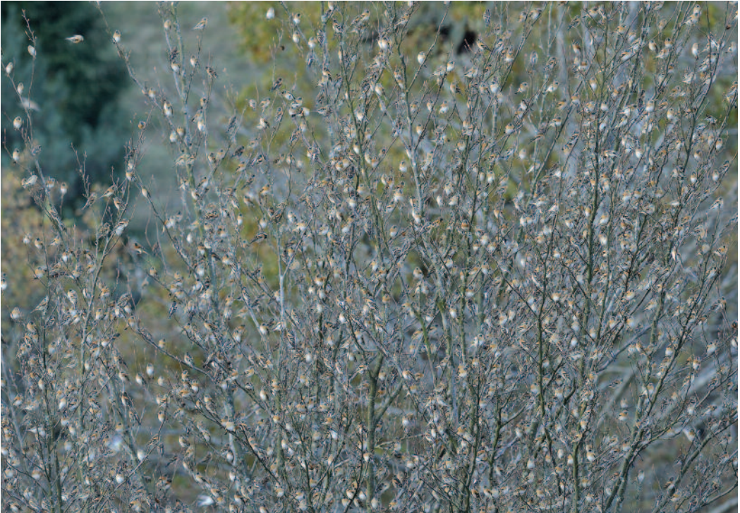
Pinzón real Fringilla montifringilla . Alto de Barazar (Vizcaya).

En Sierra Nevada, Granada, se detecta su presencia en una nueva zona a unos 2 km hacia el este del Puerto de la Ragua, único enclave conocido reproductor, en pinares de pino silvestre