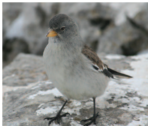
Gorrión alpino Montifringilla nivalis . Puig del Masanella (Mallorca).

Baleares. Un ejemplar en el monte de Massanel·la, Escorca, Mallorca, el 10 de enero de 2009 (E. Olivieri/AOB).