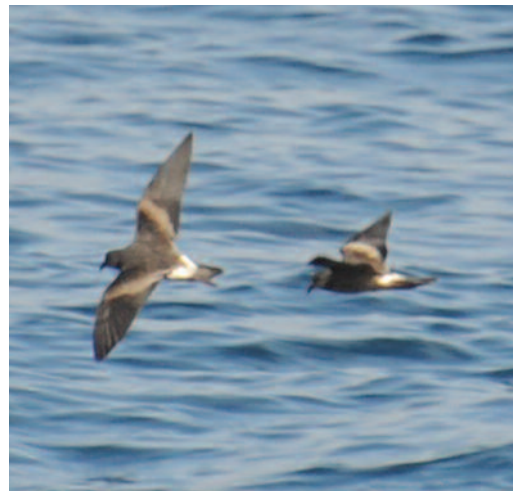
Paíño boreal Oceanodroma leucorhoa . A cinco millas al este de la isla de Alborán.

En el Mediterráneo, donde es accidental (Paterson, 1997 y 2002) y en concreto en el mar de Alborán, donde no hay constancia de que se haya detectado desde finales del siglo XIX (Irby, 1895): el 8 de