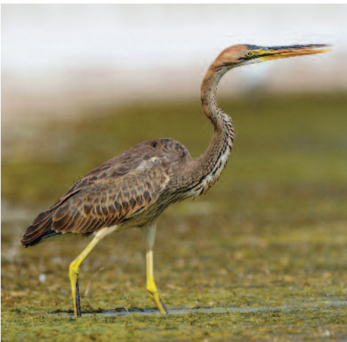
Garza imperial Ardea purpurea. Arona (Tenerife).