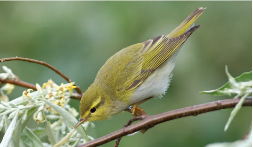
Mosquitero silbador Phylloscopus sibilatrix . Vila-Seca (Tarragona).

Canarias. En La Gomera, donde hay pocos datos, observaciones de aves en paso: el 6 de octubre de 2011 se detecta un ejemplar en los jardines de la Torre del Conde, San Sebastián de La Gomera, y al día siguiente se observan dos aves –adulto y juvenil– en vegetación anexa al aeropuerto, así como otro ejemplar en jardines de casa de La Roseta en Alajeró (D. Trujillo y J. Leralta).