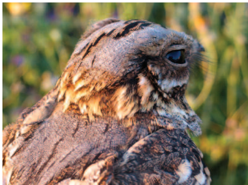
Chotacabras cuellirojo Caprimulgus ruficollis . Can Marroig (Formentera).