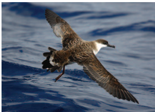
Pardela capirota Puffinus gravis . Aguas al norte de Lanzarote.

Canarias. Durante un viaje pelágico por aguas al norte de Lanzarote, alcanzando el Banco de la Concepción, tres aves el 10 de septiembre de 2011 (J. Sagardía, D. L. Velasco y otros).