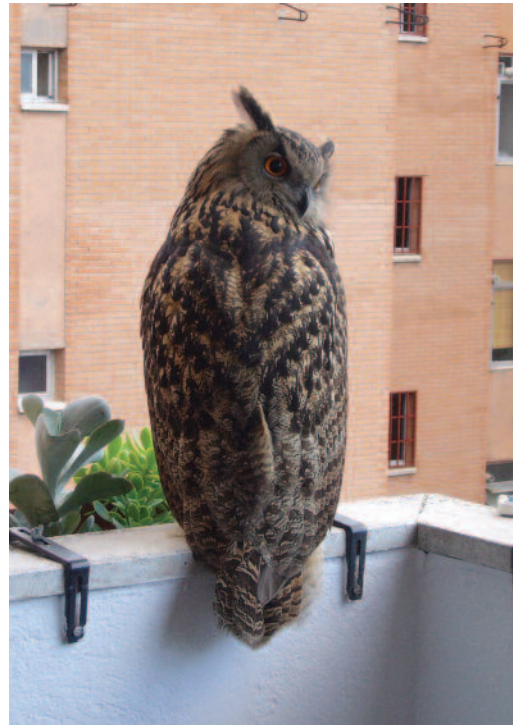
Búho real Bubo bubo . Madrid.

Canarias. En Gran Canaria, en la misma área de San Agustín, un ejemplar en fechas bien distantes, el primero en marzo de 1995 y el segundo en abril de 2011 (M. L. Fishman).