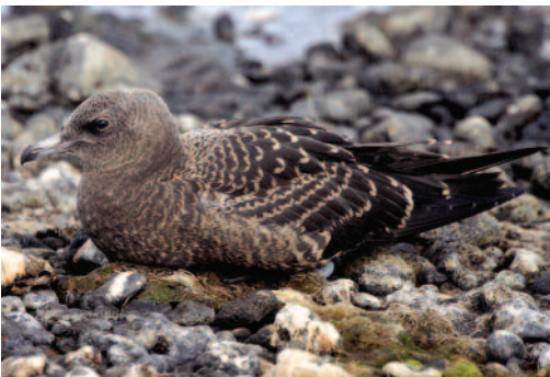
Págalo pomarino Stercorarius pomarinus. Yaiza (Lanzarote).