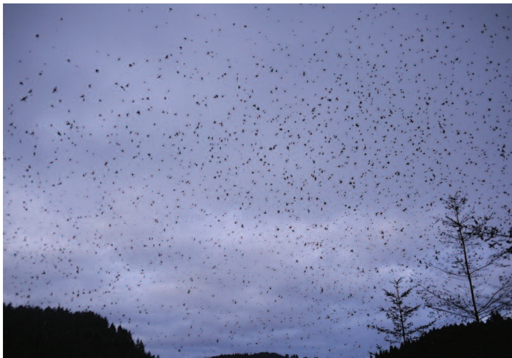
Pinzón real Fringilla montifringilla . Alto de Barazar (Vizcaya).

Una hembra en Cariño, A Coruña, el 16 de mayo de 2011 (J. M. Alonso).