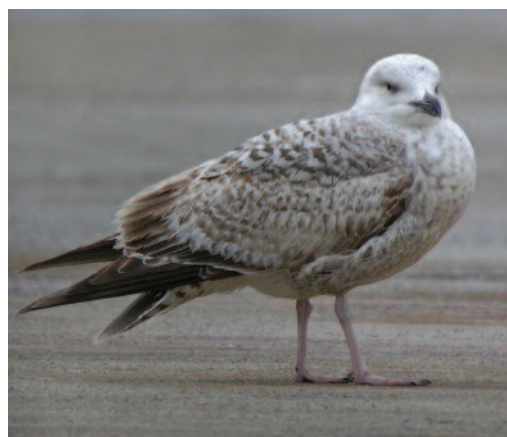
Gaviota argétea Larus argentatus argentatus . Puerto de Palma (Mallorca).

Baleares. En Mallorca, observaciones de ejemplares en el puerto de Palma en el muelle Vell en 2010: un ave de primer año con características de la subespecie argentatus reconocida por detalles del plumaje y la muda, los días 5, 10, 23 y 26 de marzo, ejemplar que pasó una buena temporada en la isla, seguramente de enero a marzo, y por tanto se puede considerar una invernada; un ejemplar de cuarto año de calendario con características de