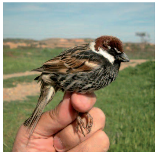
Gorrión moruno Passer hispaniolensis . Río Cámaras, Azuara (Zaragoza).