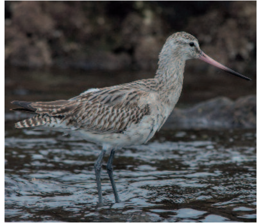
Aguja colipinta Limosa lapponica . La Laguna (Tenerife).

lectura de las anillas (J.-G. Le Roux). Cerca de allí, en Las Galletas, Arona, de un ejemplar los días previos se pasa a tres y después a ocho y hasta 10 aves el 28 de enero de 2014, aunque solo quedan cinco el 29 de enero de 2014, pero ese mismo día se cuentan otras siete en la charca del Fraile, Arona, por lo que al menos hay 12 en ese sector de la isla (M. B. Lancaster). En La Palma, dos aves en una balsa de riego en Las Martelas, Los Llanos de Aridane, entre el 28 de enero y el 1 de febrero de 2014 (R. Burton).