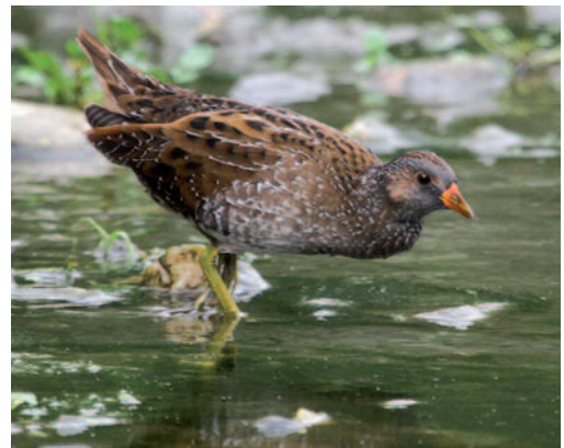
Polluela pintoja Porzana porzana . Río Vélez, Vélez-Málaga (Málaga). Foto: Juan Ignacio Álvarez Gil.

Canarias. En Lanzarote, un ave en el campo de golf de Tías entre el 9 y el 30 de marzo de 2014 (F. J. García Vargas). En Tenerife, en charca de riego en Tejina, La Laguna, una el 24 de octubre de 2013 (R. Fernández Febles).