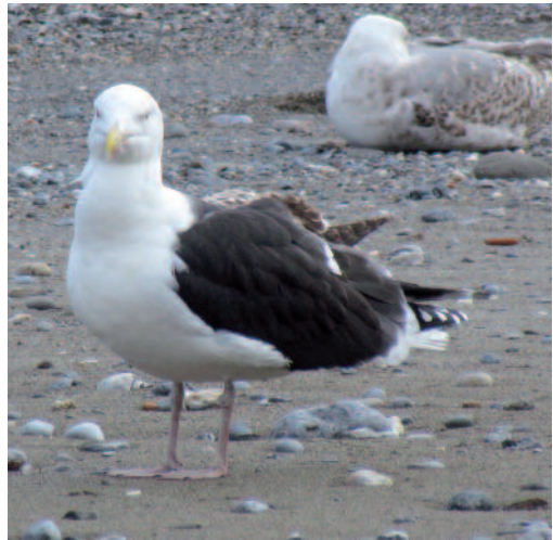
Gavión atlántico Larus marinus . Playa de Benítez (Ceuta).

Canarias. En Lanzarote, cadáver fresco de un adulto en las salinas de Janubio, Yaiza, el 22 de enero de 2014 y en la costa de Arrecife un primer invierno el 28 de febrero de 2014 y otro el 14 de marzo de 2014 (F. J. García Vargas). Además, dos adultos muertos en la playa de San Juan, Famara, Tegui, el 10 de marzo de 2014 (G. Tejera y F. Rodríguez) y un ave muerta en el saladar en La Santa, Tinajo, el 10 de marzo de 2014 (G. Tejera). En Tenerife, una posada en la costa de la Punta