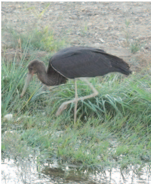
Cigüeña negra Ciconia nigra . Desembocadura de la Rambla de Balerna, El Ejido (Almería).

Censo en 2013 en Extremadura: 189 parejas seguras censadas (116 en Cáceres y 73 en Badajoz), 147 con reproducción controlada donde vuelan 290 pollos, es decir 1,97 pollos por pareja (DGMA-Gobierno de Extremadura). Un ejemplar del año en la desembocadura de la Rambla de Balerna, El Ejido, Almería, el 7 de diciembre de 2013 (I. Luque Cabeo y L. Rodríguez Rodríguez).