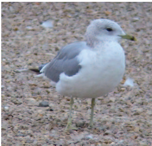
Gaviota cana Larus canus . Puerto de Vinarós (Castellón).

Un individuo en los depósitos de agua Casablanca, Zaragoza, del 11 al 20 de noviembre de 2013