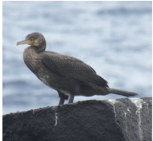
Cormorán grande Phalacrocorax carbo . Mazo (La Palma).

Se estiman 24 machos territoriales en el Espacio Natural Doñana en la primavera de 2013 que corresponde a la segunda cifra más alta desde 2011 en el que se estimaron 26 territorios, gracias a las buenas condiciones de inundación de la marisma (Equipo Seguimiento Procesos Naturales de la Estación Biológica de Doñana/EBD-CSIC); se localizaron dos nidos, uno en construcción y otro con cinco huevos y se observó un pollo en el mes de julio (F. Ibáñez). En los humedales de Salburua, Vitoria, Álava, un ejemplar en la balsa de Duranzarra el 19 de febrero de 2013 y otro en la balsa de Larregana el 15 de marzo de 2013 (L. Lobo y