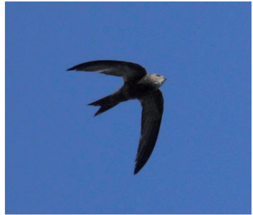
Vencejo pálido Apus pallidus . Parque de las Llamas, Santander (Cantabria).

Primeras reproducciones confirmadas en la provincia de Zamora, año 2013: al menos una pareja en Toro y 11 parejas en San Martín de Pedroso, en este caso en el puente fronterizo con Portugal, situándose cuatro de los nidos en el lado portugués (J. A. Hernández, M. I. Martín, E. D'Hoore y A. Rodrigo). Dos ejemplares con aportes a un nido en Sanxenxo, Pontevedra, el 27 de noviembre de 2013 (SEO-Pontevedra). Observaciones en Cantabria: queda confirmada la presencia habitual de la especie en el casco antiguo de Santander: una decena de ejemplares que se observan aún el 19 de octubre de 2013 (F. González Sán-