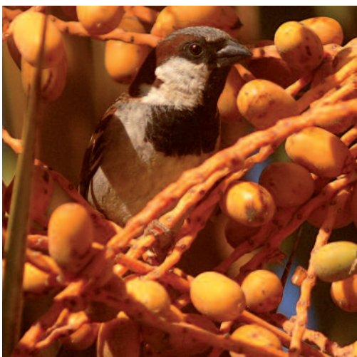
Gorrión común Passer domesticus . Agüimes (Gran Canaria).

Canarias. En Gran Canaria, grupos de interés: en las cercanías del caserío de El Toscón, Tejeda, el 12 de noviembre de 2013 se observa un bando compuesto por 40-50 ejemplares, y en El Acebuche, La Aldea de San Nicolás, dentro de la Reserva Natural Especial de Güigüí, el 13 de enero de 2014 se avista otro grupo de una veintena de aves (D. Trujillo). Datos de cría en La Gomera, en el municipio de Alajeró: el 25 de marzo de 2013 en Los Almácigos un adulto transporta