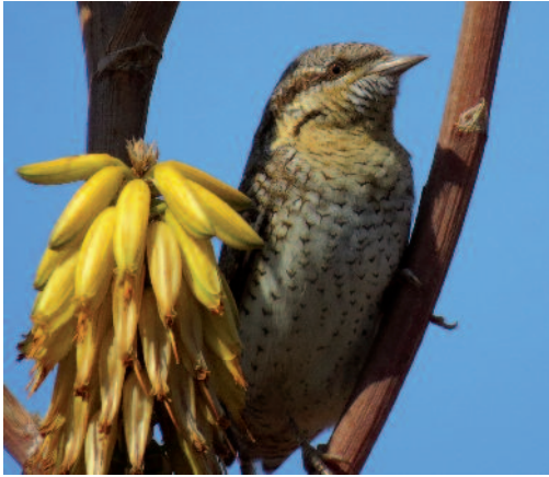
Torcecuello euroasiático Jynx torquilla . Tías (Lanzarote).

Vargas) y otra en el campo de golf de Tías el 6 de abril de 2014 (J. Rodríguez Martínez y F. J. García Vargas).