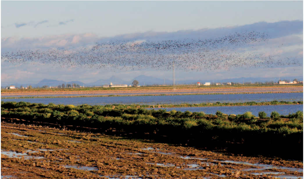
Morito común Plegadis falcinellus . Isla Mayor (Sevilla).

rias, el 16 de enero de 2014 (J. M. Marín). Uno alimentándose en un campo junto a la balsa de Larralde (Torre Medina) en Garrapinillos, municipio de Zaragoza, el 16 de enero de 2014 (J. Andreu). En Ciudad Real, 25 individuos en el embalse del Vicario el 19 de marzo de 2014 (X. Piñeiro) y 52 en las Tablas de Alarcos el 30 de marzo de 2014 (X. Piñeiro).