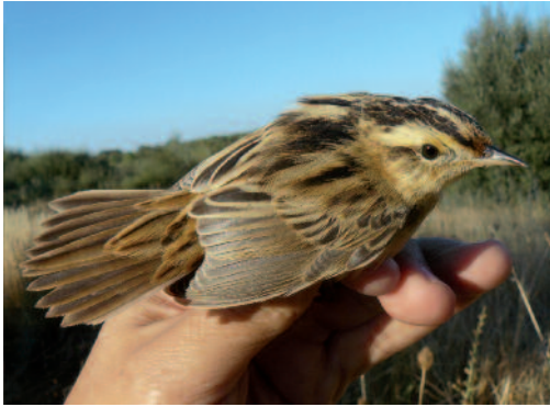
Carricerín cejudo Acrocephalus paludicola . Pedraza de Yeltes-Castraz (Salamanca).