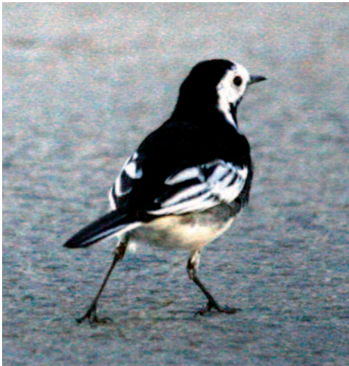
Lavandera blanca Motacilla alba yarrellii . Torre Pacheco (Murcia).

Observaciones de la subespecie yarrellii : un ave en un campo de labranza en Torre Pacheco, Murcia, junto a grupo de lavanderas blancas el 29 de diciembre de 2013 y presente al menos hasta el 8 de enero de 2014 (J. Navarro, J. López y T. García) de nuevo se vuelve a ver un individuo con plumaje de macho desde el día 5 de febrero hasta el 22 de dicho mes, en la avenida de Torre Pacheco