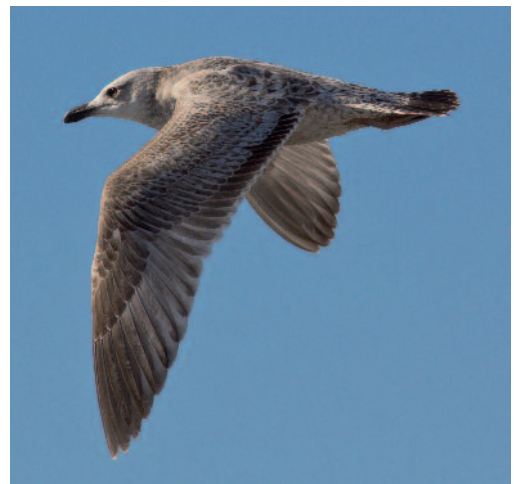
Gaviota argénteo europea Larus argentatus . Puerto de Málaga (Málaga).

Un adulto en Punta Umbría, Huelva, del 20 de octubre al 26 de diciembre de 2013 (J. Salcedo, J. L. Anguita, A. Savijn y F. Chiclana). En Madrid-Río, Madrid, observaciones de un ave de tercer invierno el 21 y 22 de noviembre de 2013, un ejemplar los días 25 de noviembre y 6 y 8 de diciembre, un primer invierno el 19 y 24 de enero y el 23 de febrero de 2014, y un inmaduro el 23 de marzo de 2014 (M. Martínez López). En Alcázar de San Juan, Ciudad Real, un ave de primer invierno el 23 de noviembre y el 7 de diciembre