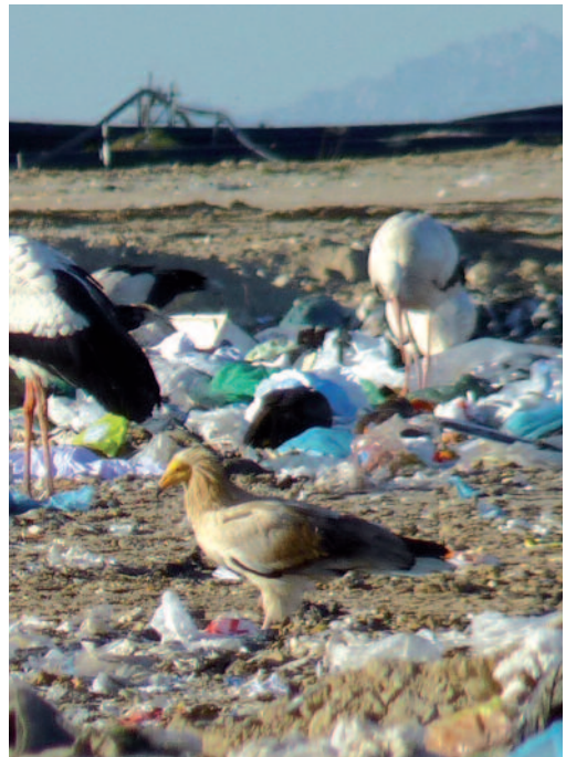
Alimoche común Neopron pernocterus . Vertedero de Pinto (Madrid).

Cría confirmada en la provincia de Valencia: una pareja saca adelante dos pollos en los Montes de Tuéjar, Valencia, en la primavera de 2013; aunque el primer intento de cría tuvo lugar en 2006, este es el año en el que se confirma la cría con éxito (C. García-Ripollés y P. López-López). Un ejemplar en el VRSU de Pinto, Madrid, el 16 de marzo de 2014 (E. del Val/Grupo Naumanni).