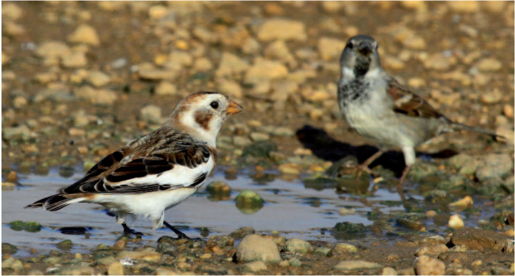
Escribano nival Plectrophenax nivalis . Espigón Juan Carlos I, Paraje Natural Marismas del Odiel (Huelva).

2013 (H. Sarasa, R. Rodríguez y M. Grande). Un ejemplar en A Coruña el 16 de enero de 2014 (D. Monteagudo y C. Soaje). Un macho en el monte Gorramendi, Navarra, del 24 al 27 de noviembre de 2013 (J. Ardaiz). Un ejemplar en Villar del Río, Soria, el 9 de diciembre de 2013 (F. Flechoso). Un ave de primer invierno y una hembra adulta en Montseny, Barcelona, del 19 al 26 de noviembre de 2014 (J. Bel y J. Ventura). Uno en Aiguamolls del Ampurdán, Girona, del 20 de diciembre de 2013 al 2 de marzo de 2014 (A. Ollé y R. Busquets). Un ejemplar en la provincia de Ávila el 10 de diciembre a 1.600 m s.n.m., localizado posiblemente el mismo u otro ejemplar a 7,6 km de distancia y 1.650 m s.n.m. el 23 de diciembre de 2013 (D. Fernández Muñiz). Un ejemplar en el Espigón Juan Carlos I, Paraje Natural Marismas del Odiel, Huelva, el 14 de diciembre de 2013 (P. Sánchez Márquez). Un ejemplar en el puerto de la Morcuera, Madrid, del 8 al 10 de enero de 2014 (J. Martínez y A. Ortega). Tres ejemplares cerca del aparcamiento de la estación de esquí de La Covatilla, Béjar, Salamanca, el 18 de febrero de 2014 (J. Jablovski). Uno en Villafáfila, Zamora, los días 7 y 8 de marzo de 2014 (C. Osorio y J. M. San Román).