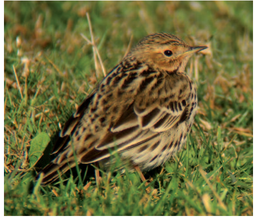
Bisbita gorgirrojo Anthus cervinus . Cabo Quintres (Cantabria).

Canarias. En Lanzarote, dos aves en Puerto del Carmen, Tías, el 14 de diciembre de 2013 (F. J. García Vargas).