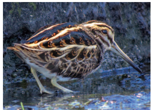
Agachadiza chica Lymnocyptes minimus . Tías (Lanzarote).

Canarias. En Tenerife, un ejemplar en una de las charcas de Tejina, La Laguna, el 31 de enero y los días 1 y 2 de febrero de 2014 (R. Fernández Febles) así como el 3 de febrero de 2014 (R. Barone y A. Ravina). En la Charca del Fraile, Arona, cuatro aves el 25 de enero de 2014, una de ellas anillada podría corresponder con un origen de Holanda aunque no pudo completarse la