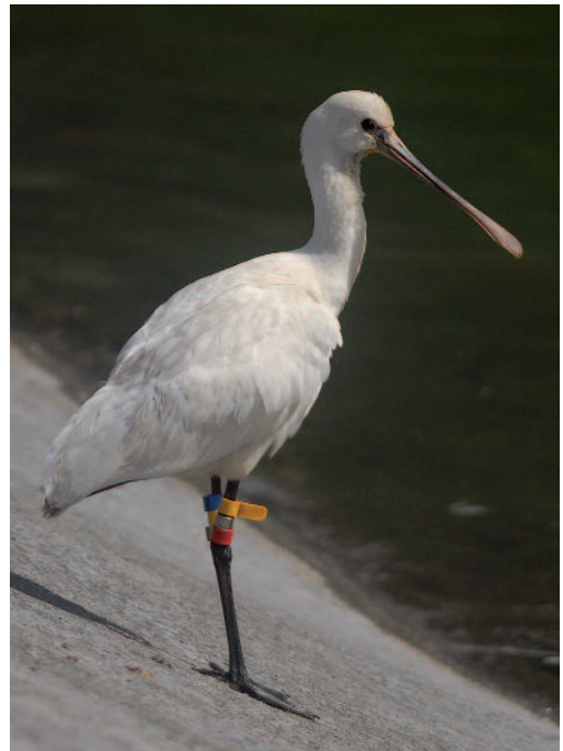
Espátula común Platalea leucorodia . Frontera (El Hierro).

Canarias. En Lanzarote, grupo de seis ejemplares descansando en La Santa, Tinajo, entre el 1 y el 12 de diciembre de 2013 (A. Rimmer). En Te-