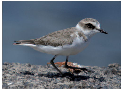
Chorlitejo patinegro Charadrius alexandrinus . El Pinar (El Hierro).

Se cuentan 56 aves en arrozales de Palazuelo-Campo Lugar, Badajoz, el 17 de octubre de 2013 (M. Kelsey). Hasta 47 ejemplares en el embalse de