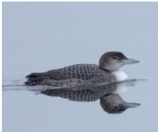
Colimbo grande Gavia immer . Embalse de Valmayor, El Escorial (Madrid).