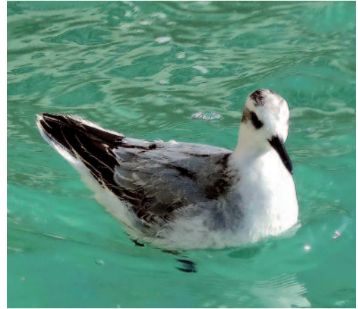
Falaropo picogrueso. Phalaropus fulicarius . Depósitos de Casablanca en plena ciudad de Zaragoza.

Canarias. En Lanzarote, un ave en el campo de golf de Tías el 24 y 25 de marzo de 2014 (A. Unquiles Cobos y F. J. García Vargas).