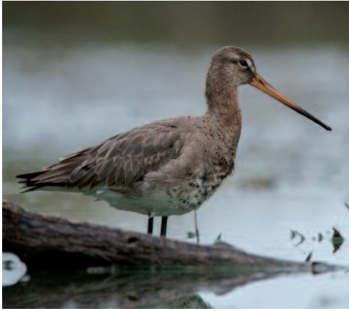
Aguja colinegra Limosa limosa . La Laguna (Tenerife).