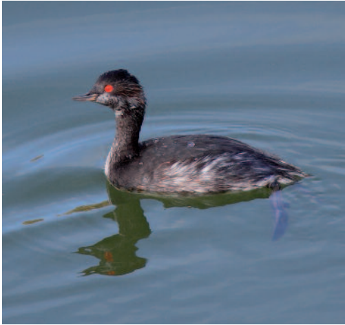
Zampullín cuellinegro Podiceps nigricollis . La Guancha (Tenerife).