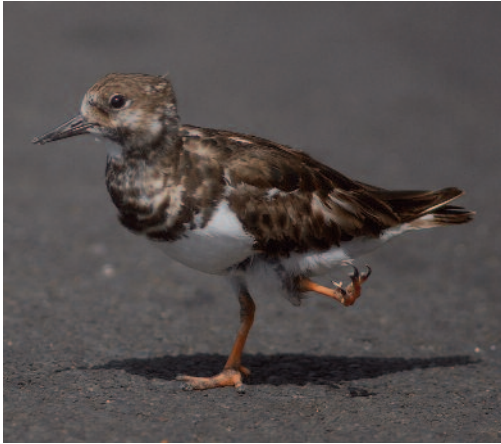
Vuelvepiedras común Arenaria interpres . El Pinar (El Hierro).