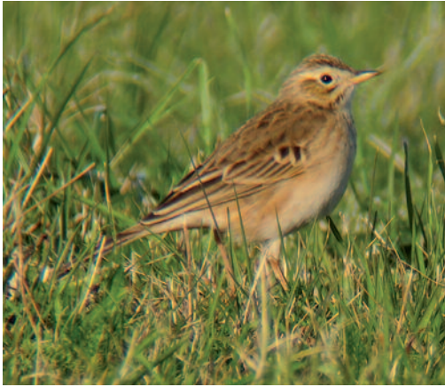
Bisbita de Richard Anthus richardi . Cabo Quintres (Cantabria).