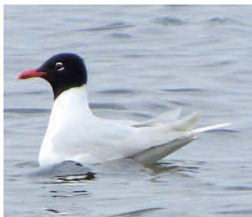
Gaviota cabecinegra Larus melanocephalus . Grulleros (León).

Siete aves de primer invierno en el puerto deportivo de Getxo, Vizcaya, el 4 de enero de 2014 (S.