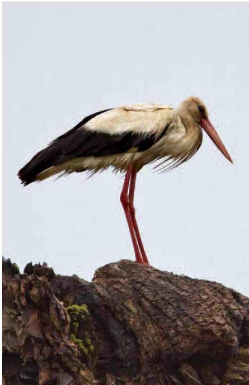
Cigüeña común Ciconia ciconia . La Laguna (Tenerife).

Cinco aves en arrozales de Deltebre, delta del Ebro, Tarragona, en los censos de aves acuáticas invernantes de enero de 2012 y cinco aves, uno en arrozales de la Aldea y cuatro en arrozales del Fangar, en los de 2013 (Parc Natural del Delta de l'Ebre).