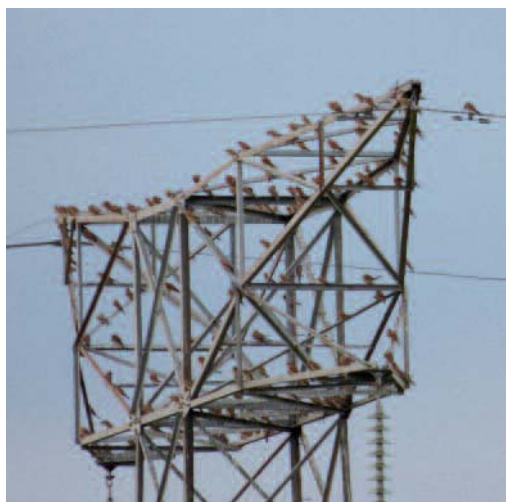
Cernícalo primilla Falco naumanni. Comarca de La Vera (Cáceres).