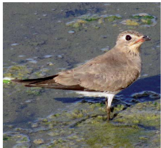
Canastera común Glareola pratincola . Arrecife (Lanzarote). Foto: Francisco José García Vargas.

Baleares. Un buen año en paso postnupcial para este migrante raro en Mallorca en 2013: se encuentra el 24 de agosto una hembra de primer año, muy debilitada y con desnutrición en el centro comercial de Marratxí, cerca de la autopista de Inca, se ingresa en un centro de recuperación, donde fallece (Ll. Parpal y N. Negre/AOB). Uno y dos jóvenes en Salobrar de Campos, Mallorca, el 24 y 25 de agosto de 2013, respectivamente (S. Quintanilla, L. Ventoso y M. Rebassa/AOB). Y un macho adulto el 20 de septiembre de 2013 (M. Schade y A. Schütze/AOB). Un adulto en Salobrar de Campos, Mallorca, el 20 de septiembre de 2013 (M. Schade y A. Schütze/AOB). Un ave en el Parc Natural de s'Albufera de Mallorca el