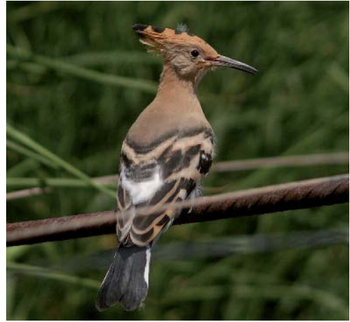
Abubilla Upupa epops . San Sebastián (La Gomera).

de 2013 (O. Martínez/AOB). Un ave en Cabrera el 29 de abril de 2013 (J. Salom/AOB). Una observación de un ave en Algarrovet, Maó, Menorca, el 24 de mayo de 2013 (O. Perona/AOB).