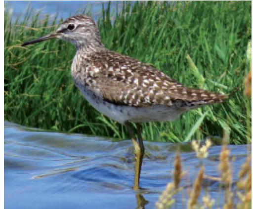
Andarriós bastardo Tringa glareola . Tías (Lanzarote).

en las salinas de San Pedro del Pinatar, Murcia, 28 de agosto de 2014 (P. Sparkes, R. Howard, T. García, A. Zamora y R. Zamora).