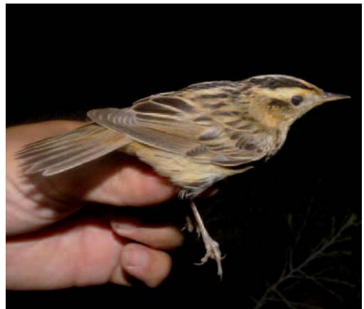
Carricerín cejudo Acrocephalus paludicola . San Martín de la Vega (Madrid).