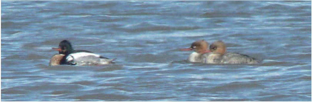
Serreta mediana Mergus serrator . Laguna de Chozas de Arriba, Chozas de Arriba (León).