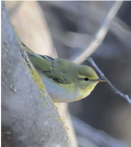
Mosquitero silbador Phylloscopus sibilatrix . Salinas de Marchamalo (Murcia).

4 de abril de 2014 (J. Palacios y T. García); de nuevo uno en un pino en La Maraña el 11 de abril (J. Palacios y T. García); uno en tarayes en Marchamo el 13 y 14 de abril (T. García) y uno en el campo de Cartagena, en una zona con eucaliptos y pinos en la Rambla del Cañar el 17 de abril (C. Requena y T. García). Un ejemplar en la rambla de Morales, Cabo de Gata, Almería, el 16 de mayo de 2014 (Ó. Gordo). Un ejemplar en Toro, Zamora, el 25 de mayo de 2014 (A. Rodrigo). Un ejemplar en el Cabo Matxitxako, Vizcaya, el 31 de agosto de 2014 (J. Ardaiz).