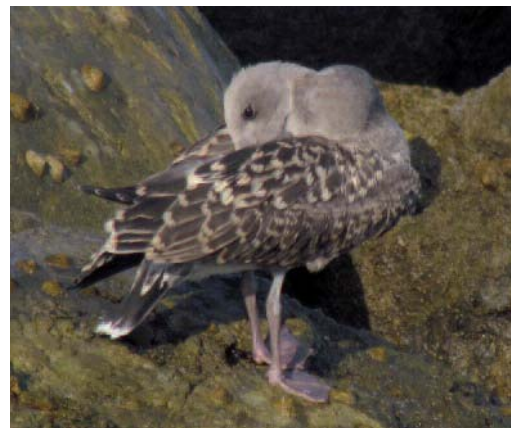
Gaviota de Audouin Larus audouinii . Puerto de Ceuta (Ceuta).