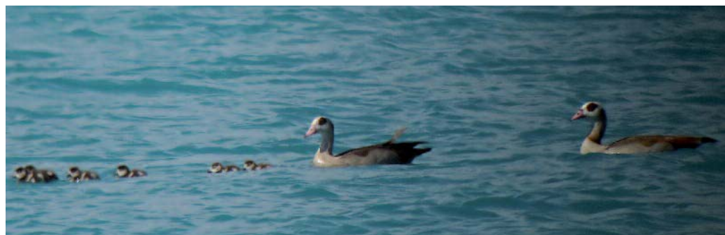
Ganso del Nilo Alopochen aegyptiacus . Embalse de los Bermejales, Arenas del Río (Granada).

Bando de más de 100 ejemplares en la cola del río Zújar, embalse de La Serena, estación de Belalcázar, Córdoba-Badajoz, en agosto y septiembre de 2014 (C. García Jiménez). Una pareja con 8 pollos en el embalse de los Bermejales, Arenas del Rey, Granada, el 17 de mayo de 2014 (J. Pérez-Contreras). Una pareja con pollos en el embalse de Yeguas, Marmolejo, Jaén, el 25 de mayo de 2014 (J. Delgado). Una pareja en Villamanrique, Ciudad Real, el 6 de junio de 2014 que permanece al menos un par de semanas (V. Flores). Una pareja con seis pollos en el embalse de Villalba de los Barros, Badajoz, el 30 de julio de 2014; aunque el 7 y el 18 de agosto sólo se observan dos juveniles (J. M. Álvarez Leal). En el embalse de Alcollarín, Cáceres, se observan hasta cinco adultos y una pareja con seis pollos al menos entre el 22 de agosto y el 13 de septiembre de 2014 (S. Mayordomo, M. Kelsey y F. Yuste). Un ejemplar en la laguna de Mari Pascuala, Parque Polvoranca, Leganés, Madrid, el 5 de octubre de 2014 (J. M. Gálvez Linares y J. M. Gálvez Gil).