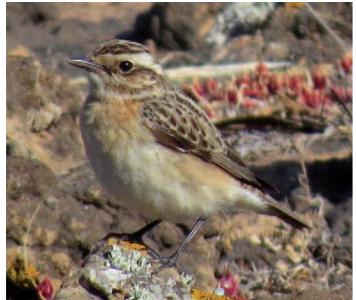
Tarabilla norteña Saxicola rubetra . Tegui se (Lanzarote).

Baleares. Se anilla por primera vez un ejemplar de la subespecie alpestris en la isla del Aire, Sant Lluís, Menorca, el 28 de marzo de 2013 (R. Escandell/AOB).