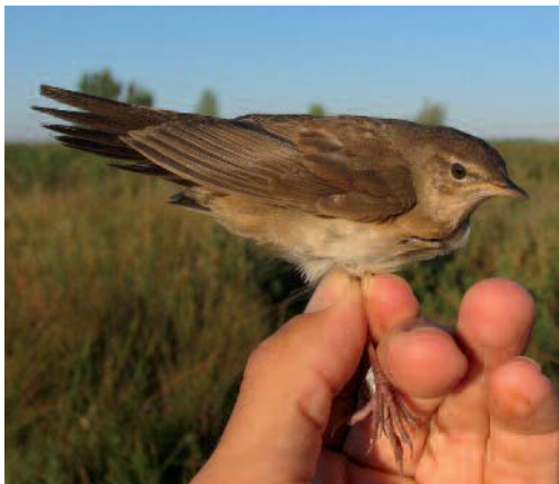
Buscarla unicolor Locustella luscinioides . Laguna El Villar, Zambroncinos del Páramo (León).

Uno en los Aiguamolls del Ampurdán, Girona, el 17 de abril de 2014 (J. Portillo). Uno en Aibar, Navarra, los días 10, 12, 26 y 28 de agosto de 2014 (J. Sola). Un juvenil en Urdaibai, Vizcaya, el 18 de agosto de 2014 (C. Azahara). Un ejemplar en Ribadesella, Asturias, el 25 de agosto de 2014 (G. Silva). En Madrid: tres ejemplares capturados para anillamiento en la reserva ornitológica de Los Albardales, San Martín de la Vega; un ejemplar joven capturado el 28 de agosto y recapturado el 5 de septiembre (H. Sánchez Mateos y R. Moreno-Opo/SEO-Monticola). Dos adultos el 8 de septiembre (H. Sánchez Mateos, J. Seoane,