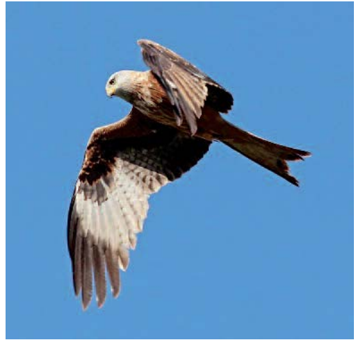
Milano real Milvus milvus . Costitx (Mallorca).

Baleares. En Eivissa en 2013, varias citas que suman 20 ejemplares que parecen en tránsito desde Mallorca a la Península: 6 aves en Ses Hisendes de Cala d'Hort, Sant Josep, el 21 de marzo (M. Tur/AOB); uno en Sant Miquel de Balansat, Sant Joan, el 30 de marzo (O. Lozollá/AOB); dos ejemplares en el Puig de Cas Damians, Sant Josep, el 3 de abril y otro el 13 de mayo (J. A. Estades/AOB); dos aves en cala den Sardina, Sant Antoni, el 5 de junio (D. García y B. Rodríguez/AOB); dos aves en Santa Gertrudis de Fruitera, Santa Eulària, el 15 de junio (G. Lama/AOB) y otro más el 28 de noviembre (M. Vericard/AOB); dos ejemplares en