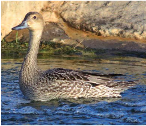
Ánade rabudo Anas acuta . Tías (Lanzarote).