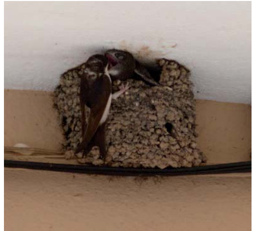
Avión común Delichon urbicum . Sa Vila Vella, Esporles (Mallorca).

Canarias. En La Gomera, el 25 de abril de 2014 en Guarchico, Vallehermoso, se observa un ave caminando por la orilla de la carretera, y poste-