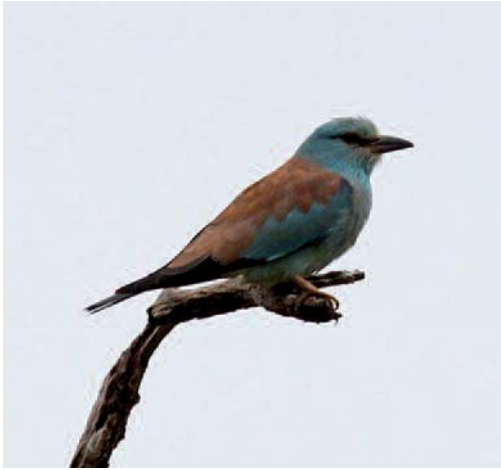
Carraca europea Coracias garrulus . Can Cullerassa, Albufereta, Pollença (Mallorca).