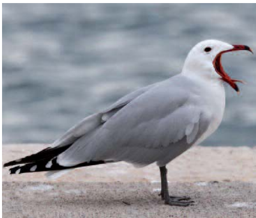
Gaviota de Audouin Larus audouinii . Puerto de Palma de Mallorca (Mallorca).

salinas de La Mata-Torreveja y 239 en el puerto de Valencia (D. G. Medi Natural, Generalitat Valenciana). En 2014 primera cita de reproducción en Ceuta: una pareja cría en unas escolleras dentro del puerto de Ceuta, junto al Parque Marítimo del Mediterráneo, en una zona prácticamente urbana con continuos movimientos cercanos de personas. El 14 de julio se observa un pollo junto a un adulto y posteriormente se comprueba el nacimiento de cinco pollos (M. A. Guirado y A. Guirado). Se confirma la cría de otra nueva pareja reproductora, esta vez en los acantilados del Monte Hacho, de Ceuta; durante el mes de julio se observó una pareja en continuos movimientos de pesca, el 18 de julio se ven acompañadas de 2 jóvenes del año (J. A. Sarrias). Máximo registrado en la población invernante en el delta del Ebro, Tarragona: 421 aves concentradas en la Punta de la Banya, en los censos de aves acuáticas invernantes de enero de 2013 (Parc Natural del Delta de l'Ebre). En Las Cañas, Viana, Navarra, un adulto el 10 de mayo (B. Benavides) y dos juveniles el 22 y el 24 de julio de 2014 (J. Robres y G. Gorospe). Un juvenil en Charco Salado, Casatejada, Cáceres, el 28 de julio de 2014 (S. Mayordomo). Un juvenil en Estaca de Bares, A Coruña, el 6 de septiembre de 2014 (A. Sandoval). Un juvenil en la laguna de Veguilla, Alcázar de San Juan, Ciudad Real, el 16 de septiembre de 2013 (P. Bustamante y B. Montiel).