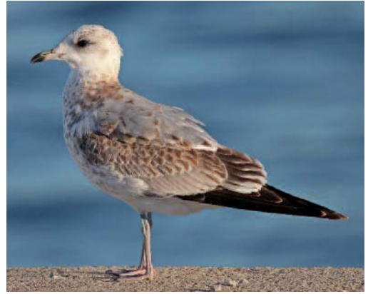
Gaviota cana Larus canus . Puerto de Palma de Mallorca.

Un ave en los arrozales de la Alfacada, delta del Ebro, Tarragona, el 15 de enero de 2013 (Parc Natural del Delta de l'Ebre). Observaciones en Madrid: en el vertedero de Colmenar Viejo, dos aves de segundo invierno y un adulto el 13 de octubre de 2013 (D. González y M. Juan), y un ave de segundo invierno y un cuarto invierno el 3 de noviembre de 2013 (J. M. Ruiz y M. Juan); en este basurero dos de segundo invierno el 12 de