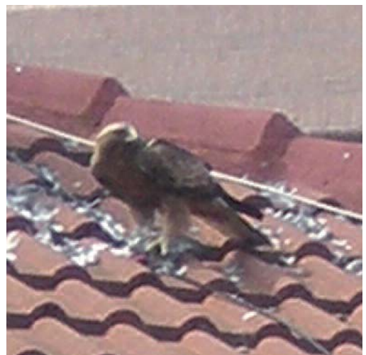
Águila calzada Aquila pennata . Ciudad de Valladolid.

Canarias. En Gran Canaria, un ejemplar descansando y alimentándose en la zona de piscinas naturales de Punta de Gáldar, Gáldar, el 14 de septiembre de 2014, aunque a juzgar por la infor-