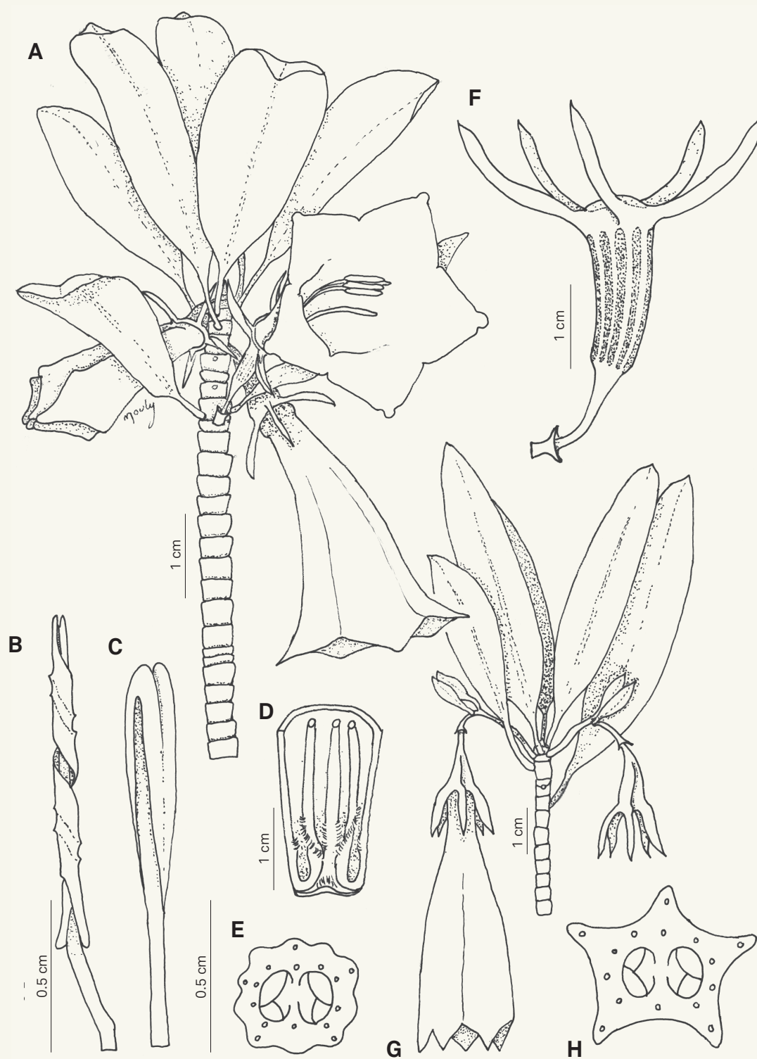
Fig. 2. – Thiolliera laureana Mouly (A-F) et T. neriifolia (Brongn.) Barrabé & Mouly (G-H). A. Branche fleurie; B. Etamine; C. Stigmates; D. Coupe longitudinale de la base de la corolle; E. Coupe transversale de l'ovaire; F. Fruit; G. Branche fleurie; H. Coupe transversale de l'ovaire.