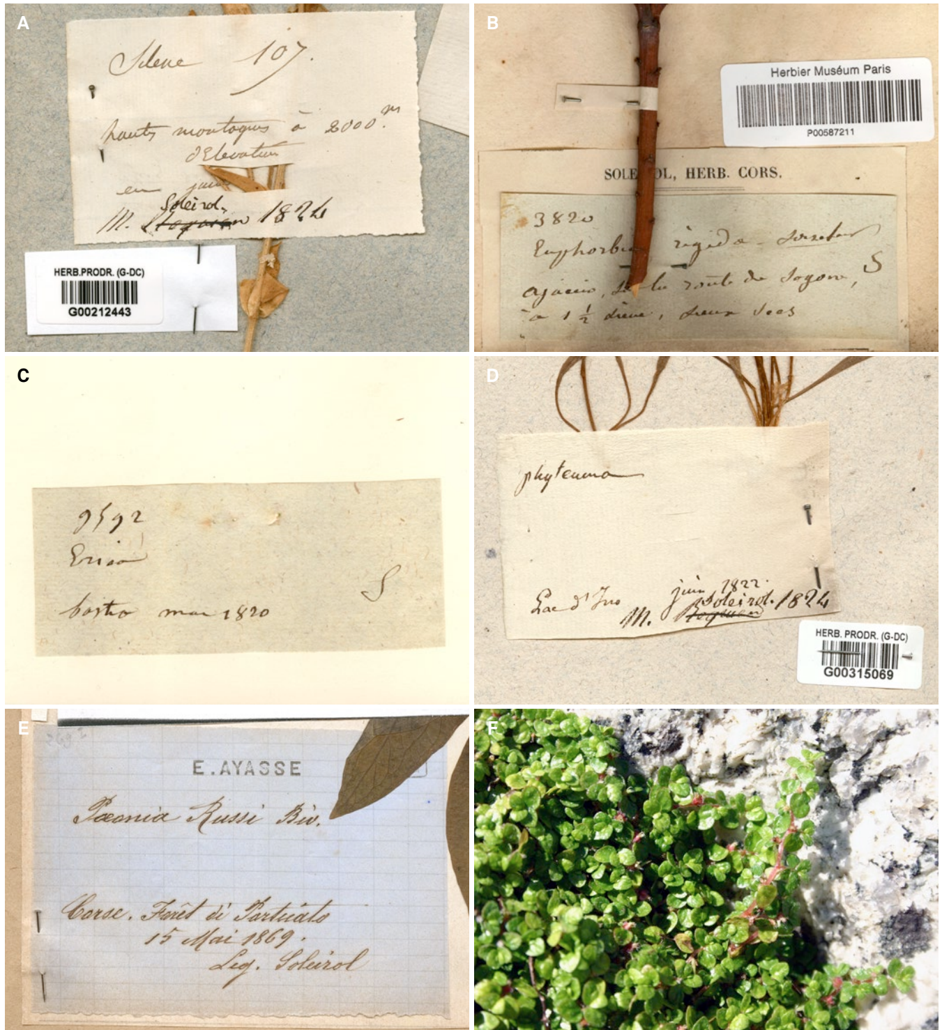
Fig. 1. – Étiquettes de spécimens d'herbier récoltés par Soleirol ( A–E ) et taxon dédié à Soleirol ( F ). A. Silene requienii Otth incorporé dans G-DC en 1824 sans doute par l'entremise de Requier (graphies de Soleirol et d'Alphonse de Candolle); B. Euphorbia rigida Loisel. (graphie de Soleirol); C. Erica arborea L. récolté en mai 1820 (graphie de Soleirol); D. Phyteuma serratum Viv. récolté en juin 1822 et incorporé dans G-DC en 1824 probablement par l'entremise de Requier (graphies de Soleirol et d'A. de Candolle); E. Paeonia russii Biv. incorporé dans l'herbier d'Ayasse en 1869 (graphie d'Ayasse); F. Soleirolia soleirolii (Req.) Dandy ( Urticaceae ).

[ A: Soleirol 107, G-DC; B: Soleirol 3820, P; C: Soleirol 9592, P;