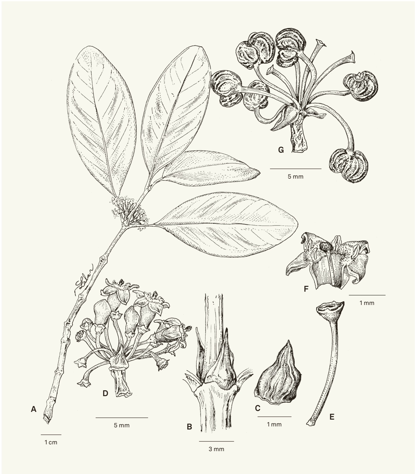
Fig. 6. – Pyrostria coriacea Atalahy, Rakotonas. & Razafim. A. Rameau florifère d'un individu femelle; B. Détail des stipules montrant la face abaxiale et une partie terminale de la face adaxiale; C. Face abaxiale de la bractée (vue de face); D. Inflorescence femelle; E. Pédicelle et ovaire avec lobes du calice; F. Tube corollin sectionné longitudinalement et étalé, montrant la position des étamines, du style et du stigmate; G. Fruits matures.

[A–F: McPherson & Rabenantoandro 18297, TEF; G: Bosser 18684, TAN] [Dessins: R.L. Andriamiarisoa]