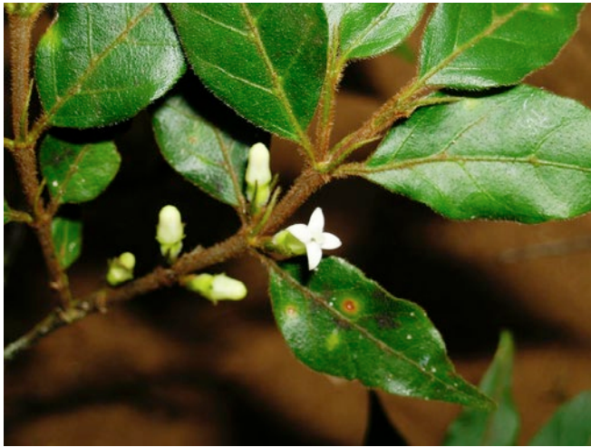
Fig. 4. – Pyrostria ambrensis Atalaha, Rakotonas. & Razafim. Rameau avec inflorescences femelles. [Bremer et al. 5048]

Note. – L'espèce diffère des autres espèces de Pyrostria malgaches par ses rameaux, pétioles, limbes, bractées et stipules à poils rouille (in vivo) (vs. rameaux, pétioles, limbes, bractées et stipules glabres ou poilus blanchâtres). Ses stipules sont triangulaires, filiformes à l'apex (vs. stipules triangulaires et aiguës ou spatulés à l'apex). Ses bractées sont en forme de capuchon, filiformes à l'apex (vs. bractées en forme de capuchon et aiguës ou échancrés à l'apex). L'ovaire et le pédicelle de la fleur femelle sont poilus, tandis que l'ovaire et le pédicelle de la fleur mâle sont glabres (vs. ovaire et le pédicelle des fleurs femelles et mâles glabres).