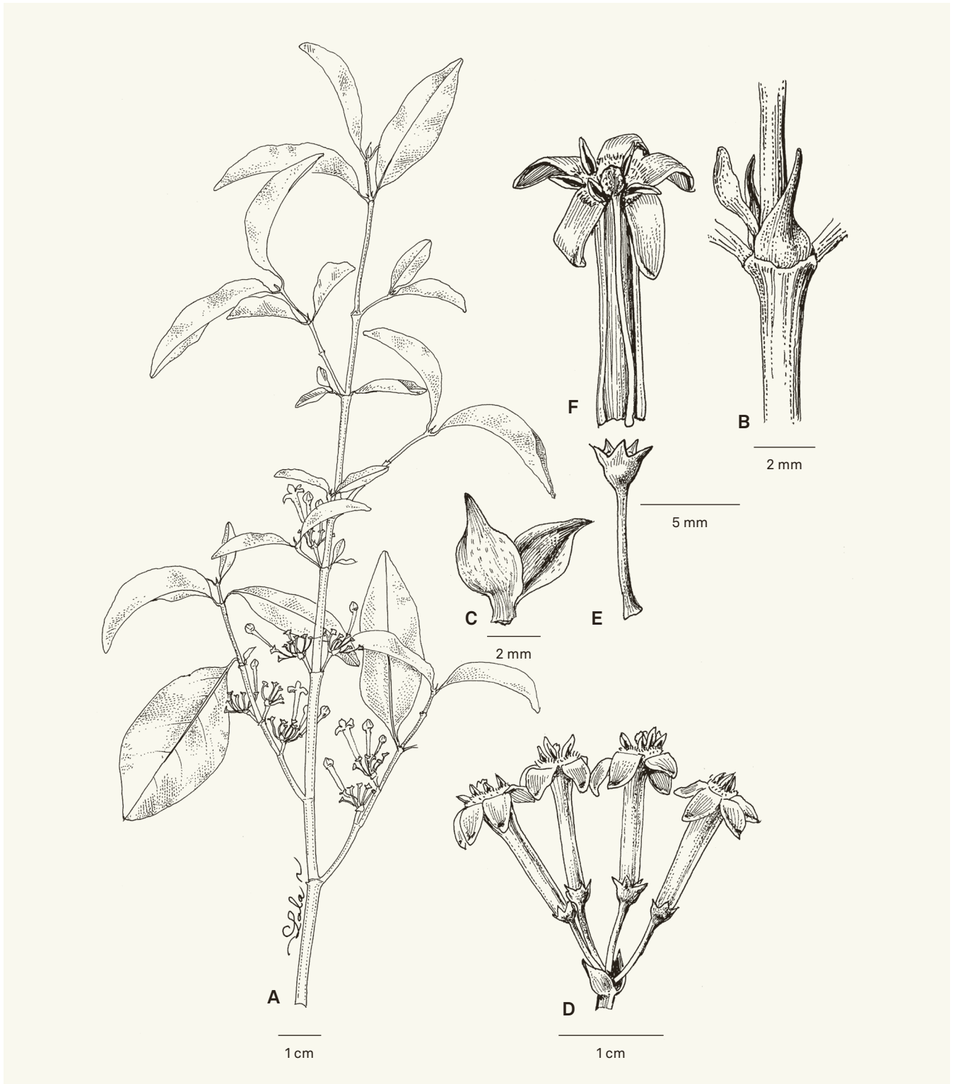
Fig. 7. – Pyrostria longicorollata Atalahy, Rakotonas. & Razafim. A. Rameau florifère d'un individu femelle; B. Détail des stipules montrant la face abaxiale et la partie terminale de la face adaxiale; C. Paire de bractées; D. Inflorescence femelle; E. Pédicelle et calice montrant les 5 lobes d'un calice d'une fleur femelle; F. Tube corollin sectionné longitudinalement et étalé, montrant la position des étamines, du style et du stigmate. [Service Forestier 27883, TAN] [Dessins: R.L. Andriamiarisoa]