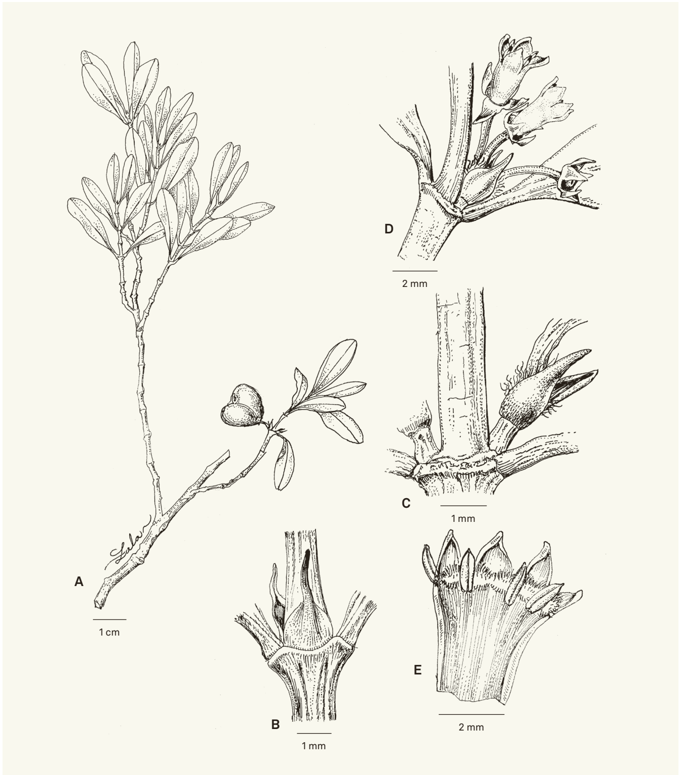
Fig. 1. – Pyrostria ambohitantelensis Atalahy, Rakotonas. & Razafim. A. Rameau fructifère; B. Détail des stipules montrant la face abaxiale et une partie terminale de la face adaxiale; C. Paire de bractées; D. Inflorescence mâle; E. Tube corollin sectionné longitudinalement et étalé, montrant la position des étamines.

[A–C: Service Forestier 33565, TEF; D–E: Schatz et al. 3585, TAN] [Dessins: R.L. Andriamiarisoa]