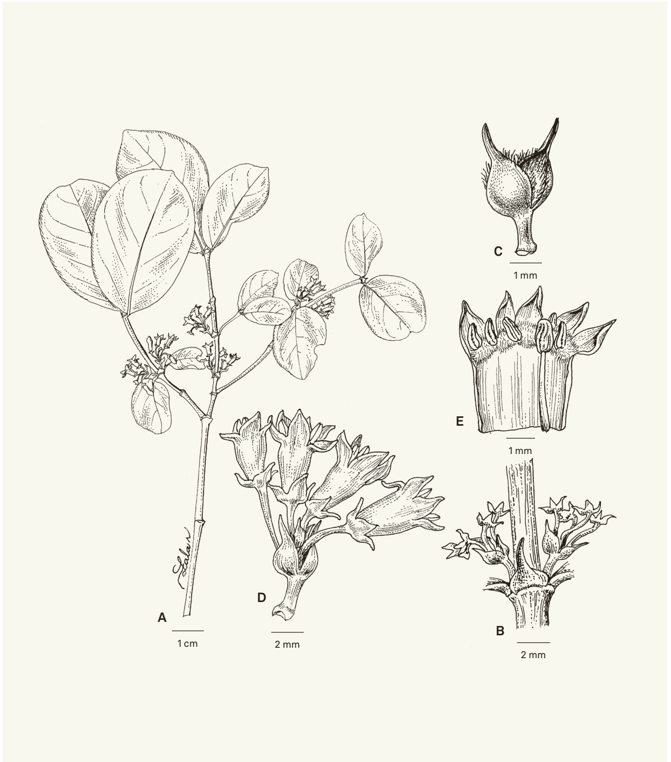
Fig. 5. – Pyrostria betsomangensis Atalahy, Rakotonas. & Razafim. A. Rameau florifère d'un individu mâle; B. Inflorescence mâle avec stipule vue de la face abaxiale; C. Paire de bractées; D. Inflorescence mâle; E. Tube corollin sectionné longitudinalement et étalé, montrant la position des étamines, du style et du stigmate.

[Service Forestier 833, TEF] [Dessins: R.L. Andriamiarisoa]