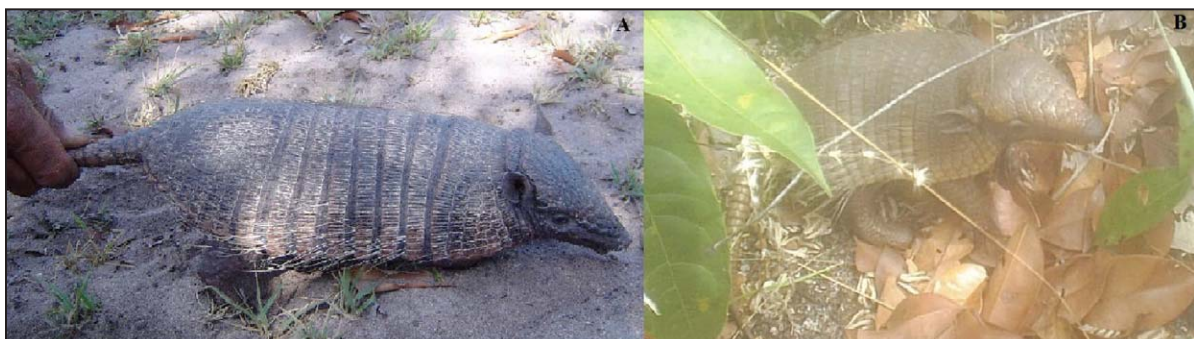
Figura 2. Exemplos de E. sexcinctus observados no PEMA: A. indivíduo observado nas proximidades da Mata da Ilha Grande; B. indivíduo observado nas proximidades da Serra do Ererê.