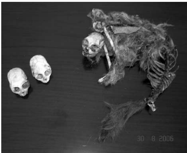
Figura 3. Evidência de caça (pele e crânio, à direita, com marcas de tiro de arma de fogo). Recolhidos no município de Carmópolis-SE.