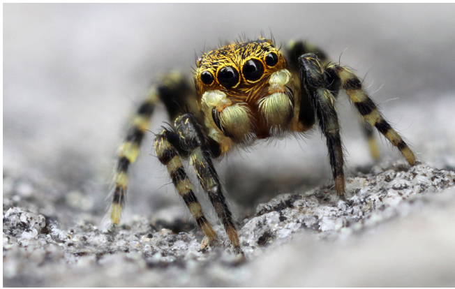
Abb. 11: Das Männchen des Gewöhnlichen Ringelbeinspringers ( Talavera aequipes , 2–3 mm) zeigt deutlich die namensgebende Ringelung der Beine