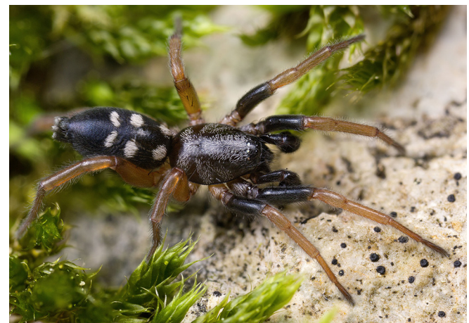
Abb. 2: Der Sechsfleck-Spion ( Phaeoedus braccatus , 4–7 mm) zeigt seine Flecken besonders deutlich

Bei den Männchen vieler Zwergspinnen (Linyphiidae: Eriogoninae) ist die Kopfregion des Prosomas in bizarre Formen modifiziert, die sich erst unter Vergrößerung in ihrer ganzen Komplexität zeigen. Diese artspezifischen Strukturen spielen wohl in vielen Fällen eine Rolle bei der Paarung und waren Anregung für zahlreiche der hier vorgeschlagenen Populärnamen (Abb. 3).