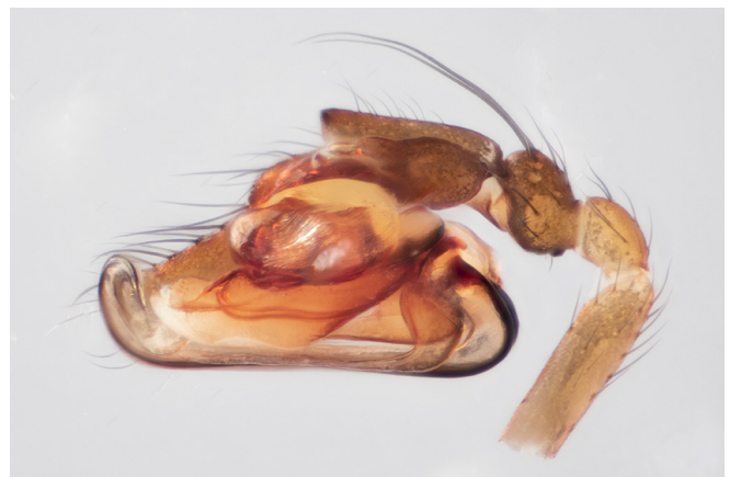
Abb. 4: Diplostyla concolor (Trompetenspinne, 2,5–3 mm); der Pedipalpus des Männchens zeigt in der Seitenansicht die geschwungene Trompetenform besonders schön. Was hier aussieht wie das Rohr eines Blech Instruments ist tatsächlich der Embolus des Begattungsorgans, der bei der Paarung zur Spermaübertragung dient

Helophora insignis – Nagelweber: nach der langen, schmalen Form der Epigyne; dieser Name wurde bereits von Menge