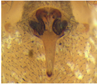
Abb. 5: Kaestneria pullata (Langzungenweber, 1,9–2,5 mm): zungenförmige Epigyne

Fig. 5: Kaestneria pullata : the extended epigynum provided the inspiration for its German common name, which roughly translates as “long-tongued weaver”