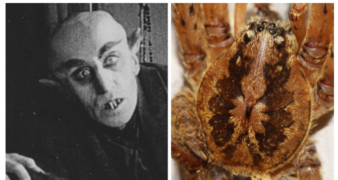
Abb. 13: Vom Prosoma der Nosferatu-Spinne ( Zoropsis spinimana , 10–19 mm) starrt dem kreativen Betrachter die Fratze des namensgebenden Vampirs entgegen

Zoropsis spinimana – Nosferatu-Spinne: fantasievolle Betrachter erkennen in der Zeichnung des Prosomas das Gesicht des namensgebenden Vampirs aus dem Schwarz-Weiß-Filmklassiker „Nosferatu – Eine Symphonie des Grauens“ aus dem Jahr 1922 (Abb. 13).