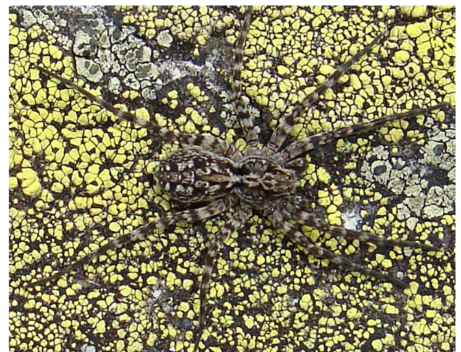
Abb. 7: Der Blockhalden-Stachelwolf ( Acantholycosa norvegica sudetica , 6–9 mm) in seinem Vorzugsbiotop. Die charakteristischen Stacheln auf den Beinen sind vor dem Flechtenhintergrund nur schwer zu sehen

Alopecosa farinosa – Pfingst-Scheintarantel: der Artname ist eine Übernahme aus dem Niederländischen (pinksterpanterspin) und bezieht sich auf den subtilen Unterschied