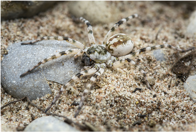
Abb. 8: Der Uferwühlwolf ( Arctosa cinerea , 12–17 mm) ist im Sand durch seine Färbung hervorragend getarnt

Fig. 8: Arctosa cinerea is well camouflaged on the sand of its riparian habitat