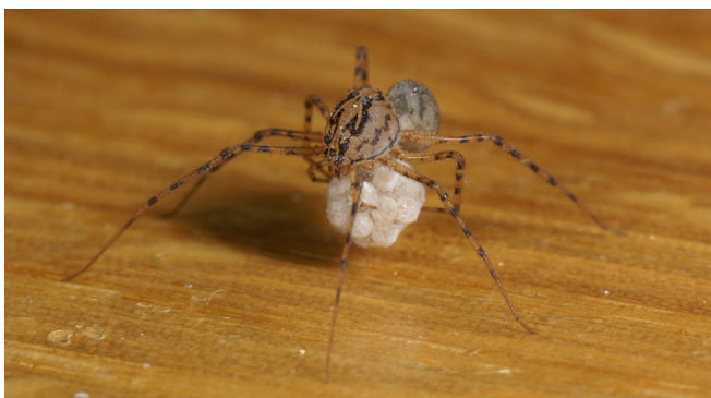
Abb. 12: Weibchen der Gewöhnlichen Speispinne ( Scytodes thoracica , 3–6 mm) tragen ihren Eikokon an den Kieferklauen

Euryopis quinqueguttata – Fünffleck-Ameisenkugelspinne: der wissenschaftliche Artname weist auf fünf Flecken hin,