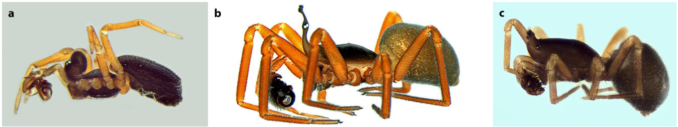
Abb. 3: a. Pelecopsis elongata (Hohes Ballonköpfchen, 1,4–2,5 mm); b. Walckenaeria acuminata (Periskop-Zierköpfchen, 1,8–4,5 mm); c. Savignia frontata (Zapfenköpfchen, 1,5–1,9 mm)

Fig. 3: a. Pelecopsis elongata ; b. Walckenaeria acuminata ; c. Savignia frontata ; three species in which the males show remarkable modifications of the prosoma shape, which have inspired many of the common German names of various groups of linyphiid spiders