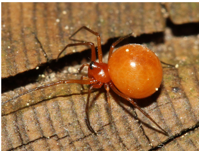
Abb. 6: Nematogmus sanguinolentus (Gallspinnchen, 1,7–2,5 mm) scheint mit dem leuchtend orangen, kugeligen Hinterkörper eine Pflanzengalle nachzuahmen

Nematogmus sanguinolentus – Gallspinnchen: es scheint mit seinem leuchtend orangen, kugeligen Hinterkörper eine Pflanzengalle nachzuahmen