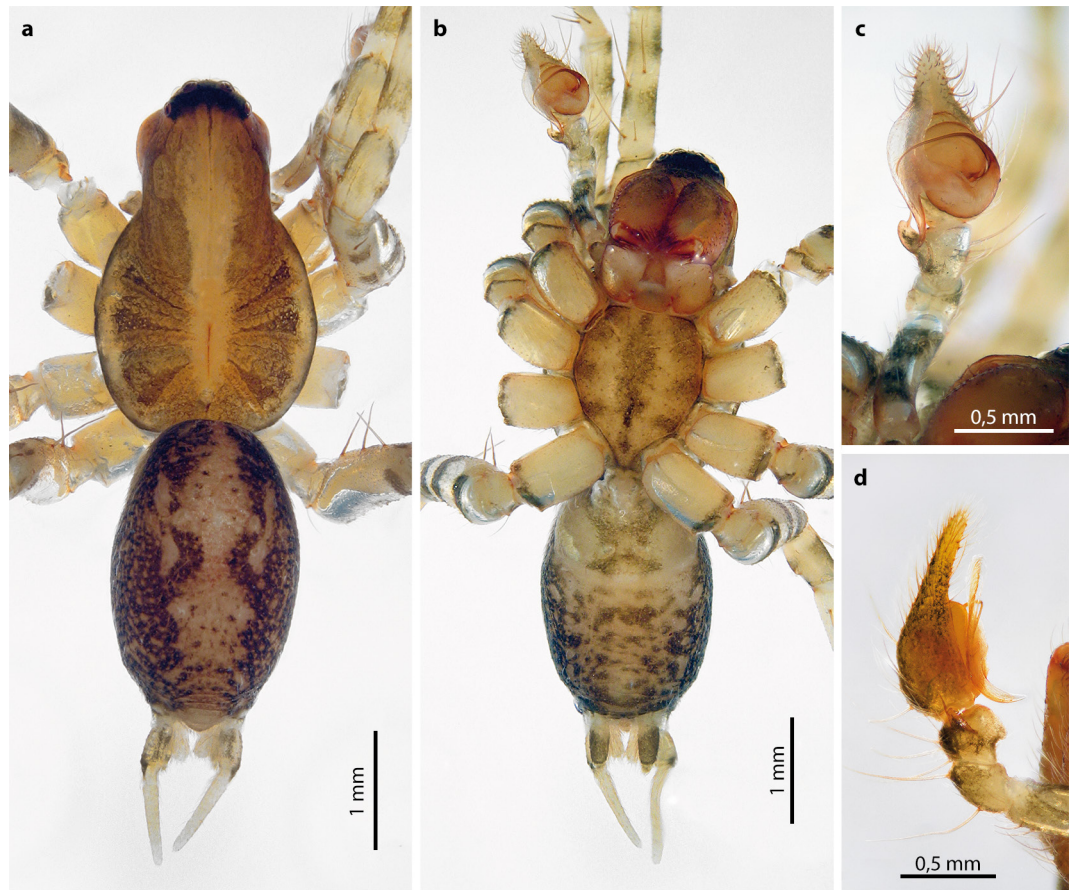
Abb. 3: Männchen (Holotypus) von Textrix rubrofoliata ; a. Habitus, dorsal; b. Habitus, ventral; c. rechter Pedipalpus, ventrale Sicht; d. rechter Pedipalpus, retrolaterale Sicht Fig. 3: Male (holotype) of Textrix rubrofoliata ; a. Habitus, dorsal view; b. Habitus, ventral view; c. right pedipalpus, ventral view; d. right pedipalpus, retrolateral view

lich 2021) erstellte Hypothese, dass H. litoralis zweifellos ein Synonym von T. caudata ist. Der etwas rechteckigere posterior hervorstehende Sklerit bei T. rubrofoliata (Fig. 2c-d; im Gegensatz zum eher abgerundeten Sklerit bei T. caudata , Fig. 2a-b) müsste als Merkmal in einer grösseren Serie geprüft werden.