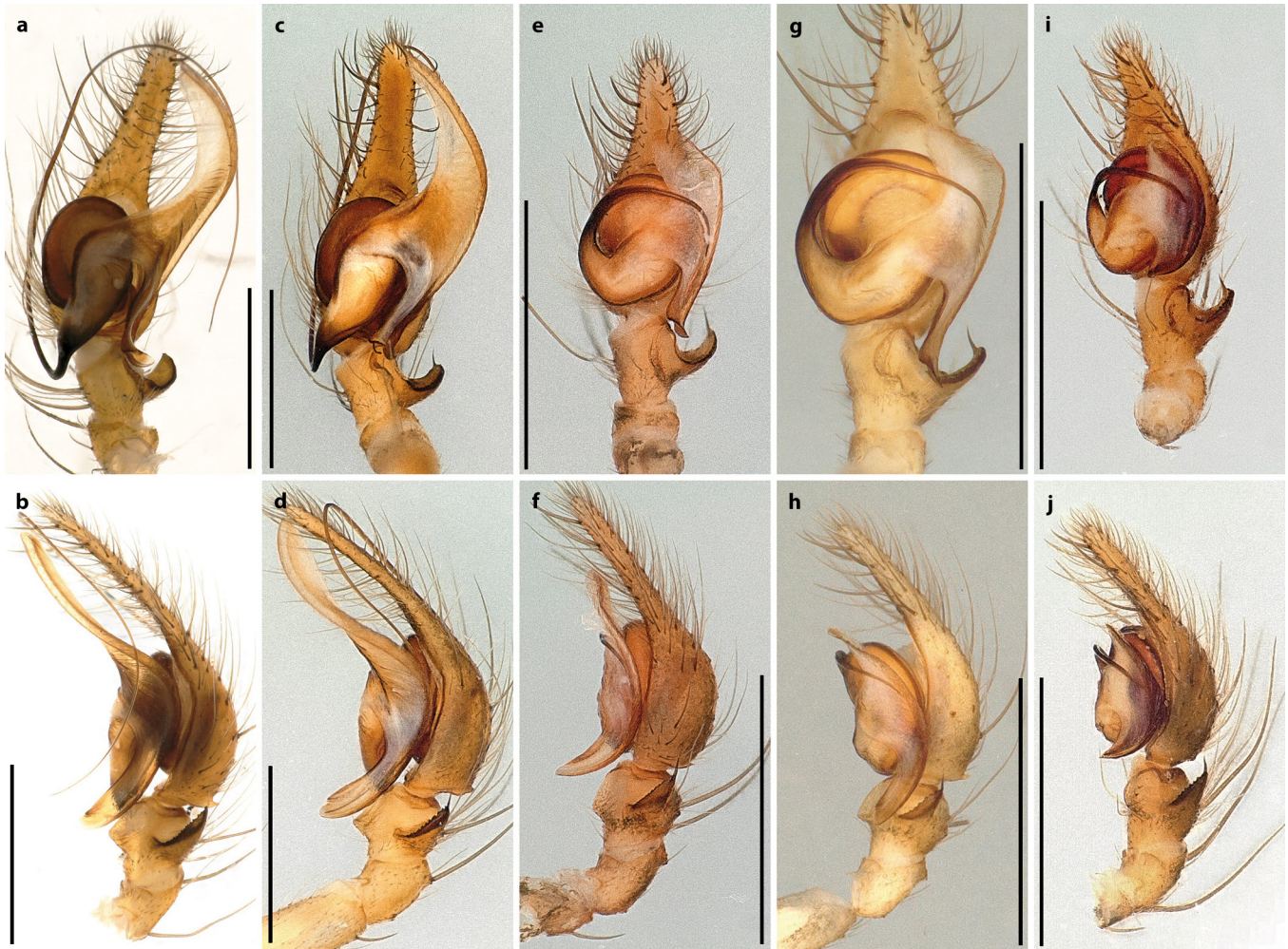
Abb. 1: Männliche linke Pedipalpen; a, c, e, g, i. Ventral; b, d, f, h, j. Retrolateral; a-d. Tetrax caudata ; a-b. Holotypus von Hystopona litoralis , Portugal; c-d. Tetrax caudata , Italien; e-h. Tetrax rubrofoliata ; e-f. Spanien; g-h. Italien (von Thaler & Noflatscher 1990 sub Tetrax pinicola abgebildet); i-j. Tetrax pinicola , Portugal. Indikator-Balken entspricht 1 mm

Fig. 1: Male left pedipalps; a, c, e, g, i. Ventral view; b, d, f, h, j. Retrolateral view; a-d. Tetrax caudata ; a-b. Holotype of Hystopona litoralis , Portugal; c-d. Tetrax caudata , Italy; e-h. Tetrax rubrofoliata ; e-f. Spain; g-h. Italy (drawings available in Thaler & Noflatscher 1990 sub Tetrax pinicola ); i-j. Tetrax pinicola , Portugal. Indication bars correspond to 1 mm