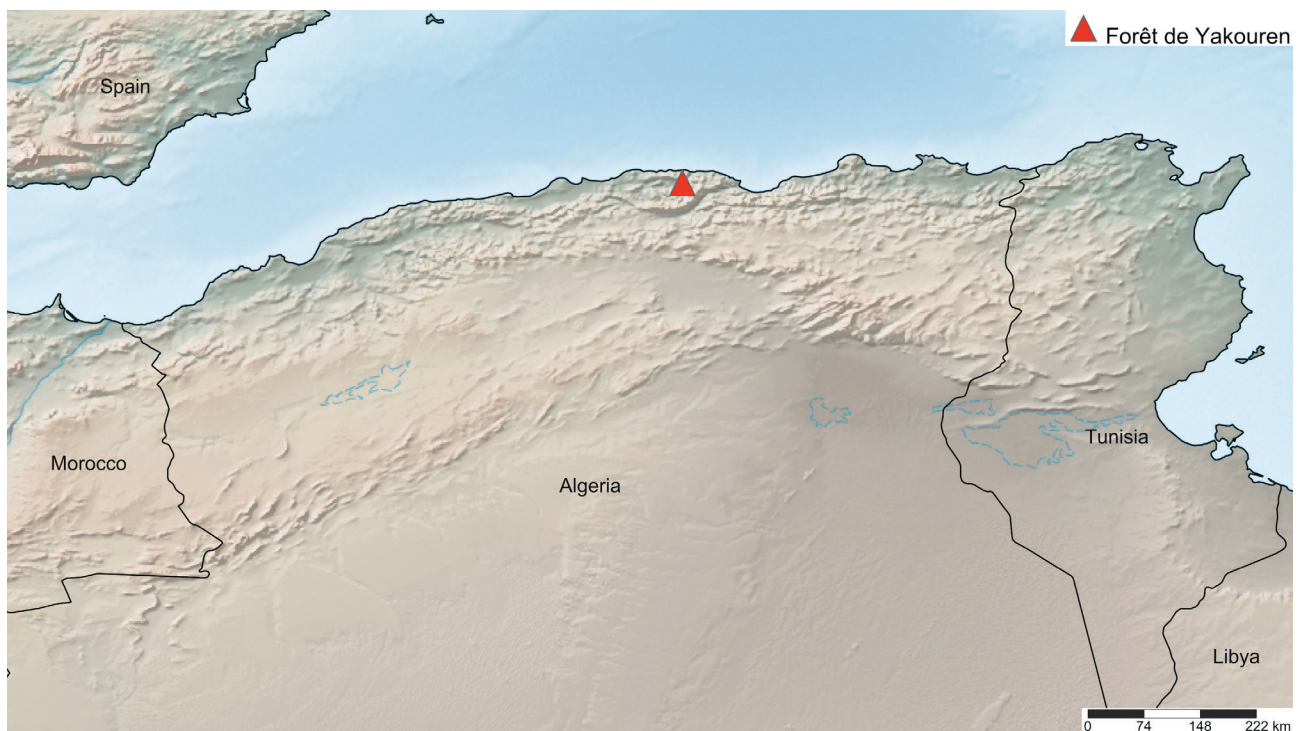
Fig. 1. Situation géographique du massif de Yakouren (Shorthouse, 2010).

La présente étude a été menée au sein du massif forestier de Yakouren (centre nord de l'Algérie ; wilaya de Tizi-Ouzou) dénommé également massif forestier de Béni Ghobri. D'une superficie de 6939 ha (Bouedja & Abdelhakim, 2013), Yakouren se présente généralement sous forme de futaie dense à sous-bois peu développé et composée de chênes mixtes : chêne afarès Quercus afares Pomel, chêne zéen Q. canariensis Wild, chêne-liège Q. suber L. et chêne faginé Q. faginea Lam. (Bouedja & Abdelhakim, 2013 ; Haddar et al. , 2016). L'aire d'étude choisie (WGS (84) 36.7556, 4.41384) a une superficie d'environ 4134 m 2 et présente un relief peu accidenté (5 % de pente), comprise entre 700 et 860 m d'altitude (Fig. 1). La pluviométrie annuelle est de