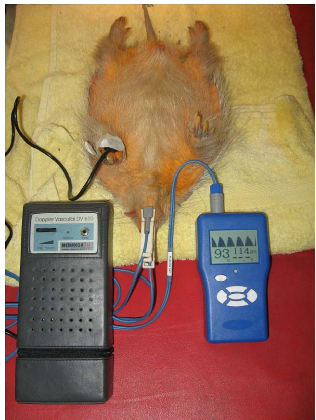
FIGURA 1. Armadillo peludo andino Chaetophractus nationi durante el monitoreo anestésico de oximetría de pulso y frecuencia cardíaca.

Se dio por finalizado cada procedimiento una vez que se constató la reversión total de los efectos de