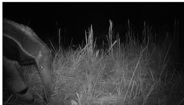
FIGURA 2. Segundo registro realizado do tamanduá-bandeira Myrmecophaga tridactyla Linnaeus, 1758 na Fazenda Priotto (24°42'18"S, 50°11'25"W) em Tibagi, Paraná, Brasil.