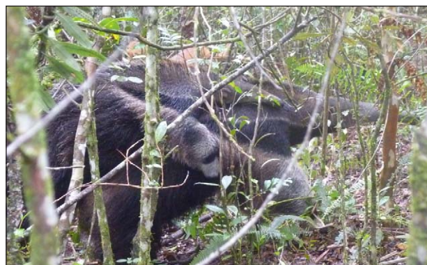
FIGURA 1. Primeiro registro realizado do tamanduá-bandeira Myrmecophaga tridactyla Linnaeus, 1758 na Fazenda Salto Cotia em área florestal (24°44'12"S, 50°14'13"W), Tibagi, Paraná, Brasil.

2000; Miranda & Medri, 2010), possivelmente extinto em Belize, Costa Rica e Guatemala (Miranda & Medri, 2010) e na Argentina está enquadrado na categoria vulnerável (Superina et al. , 2012). No Brasil, atualmente está extinto nos Estados do Rio de Janeiro e Espírito Santo e em declínio populacional nas regiões Sul, Sudeste e Nordeste do Brasil (Medri & Mourão, 2008). No Sul do país, no Estado do Rio Grande do Sul está na categoria das espécies mais raras e ameaçadas, criticamente em perigo (Fontana et al. , 2003), e em Santa Catarina não é confirmada a sua ocorrência (Cherem et al. , 2004; Tortato & Althoff, 2011). No Estado do Paraná a espécie está enquadrada na categoria criticamente em perigo (IAP, 2010), reforçando a importância da adoção de medidas que visem proteger suas populações e seus habitats, garantindo a conservação em longo prazo. Segundo Braga (2009), as principais ameaças para sua preservação e conservação são: destruição de habitats, ataques de cães domésticos, atropelamentos, caça, perseguição, abate e queimadas. Com o presente estudo indicamos a ocorrência de Myrmecophaga tridactyla para mais um município do estado do Paraná (FIG. 3) e destacamos a importância de mais estudos sobre essa rara e ameaçada espécie na região.