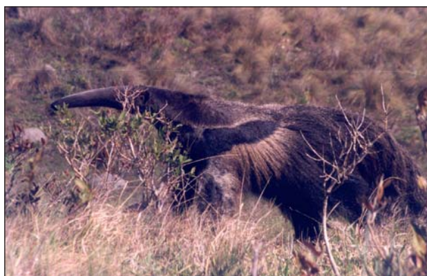
FIGURA 3. Tamanduá-bandeira ( Myrmecophaga tridactyla ) observado na fazenda 4N, município de Pirai do Sul, em setembro de 2002.

Relatos de moradores da fazenda Monte Negro no município de Pirai do Sul, vizinho a Jaguariaíva, informaram que há pouco mais de 15 anos os tamanduás ainda eram avistados regularmente e constantemente mortos por caçadores. Até a década de 1990, os tamanduás-bandeira eram “laçados”, como o gado, pelos fazendeiros e peões para serem fotografados junto às suas famílias. Essa prática deixou