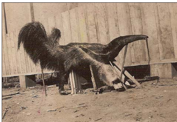
FIGURA 1. Tamanduá-bandeira ( Myrmecophaga tridactyla ), abatido no município de Paranavaí no ano de 1950.

A confirmação da ocorrência da espécie através de exemplares de museu ocorreu apenas em