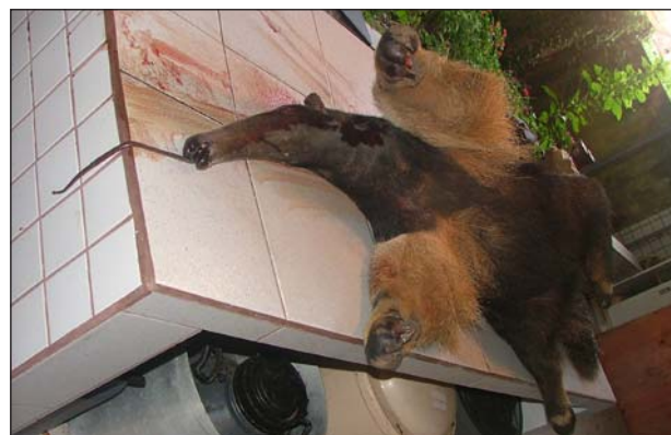
FIGURA 2. Macho de tamanduá-bandeira ( Myrmecophaga tridactyla ) atropelado na PR-090, em Piraf do Sul, no mês de novembro de 2002, e depositado no Museu de História Natural Capão da Imbuia (MHNCI), em Curitiba.

No Parque Estadual de Vila Velha, município de Ponta Grossa, no ano de 1983 um tamanduá-bandeira foi encontrado morto por atropelamento na rodovia BR 376 que corta o parque (Fernando C. Straube, com. pess., 1999). No ano de 1984 foram registradas