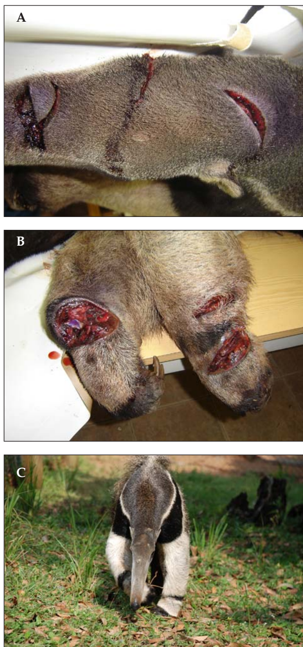
FIGURA 4. Indivíduo macho de tamanduá-bandeira ( Myrmecophaga tridactyla ), resgatado no bairro Cavernas, município de Pirai do Sul, em novembro de 2005: (A) e (B) detalhes dos ferimentos, (C) após a sua recuperação, em cativeiro.

de ocorrer pela dificuldade de localização dos indivíduos remanescentes. Em fevereiro de 2002 um indivíduo foi observado transitando entre os capões (ilhas florestais com Araucária em meio às áreas de Campos) da fazenda Monte Negro. Em propriedade vizinha (fazenda 4N) foram feitos registros visuais e fotográficos de pelo menos três indivíduos distintos (Fernanda G. Braga, obs. pess.) (FIG. 3). Ainda em Pirai do Sul, no bairro Cavernas, um indivíduo, macho, foi encontrado no dia 15 de novembro de 2005 com ferimentos (FIG. 4) feitos por caçadores que invadiram uma propriedade rural (Vlamiir J. Rocha, com.