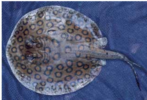
Potamotrygon motoro .