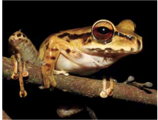
Stefania scalae .