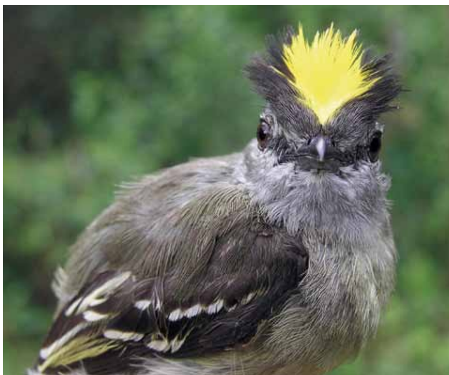
Tyrannulus elatus .