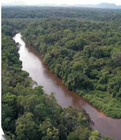
Río Cuyuní cerca de su confluencia con el Uey.