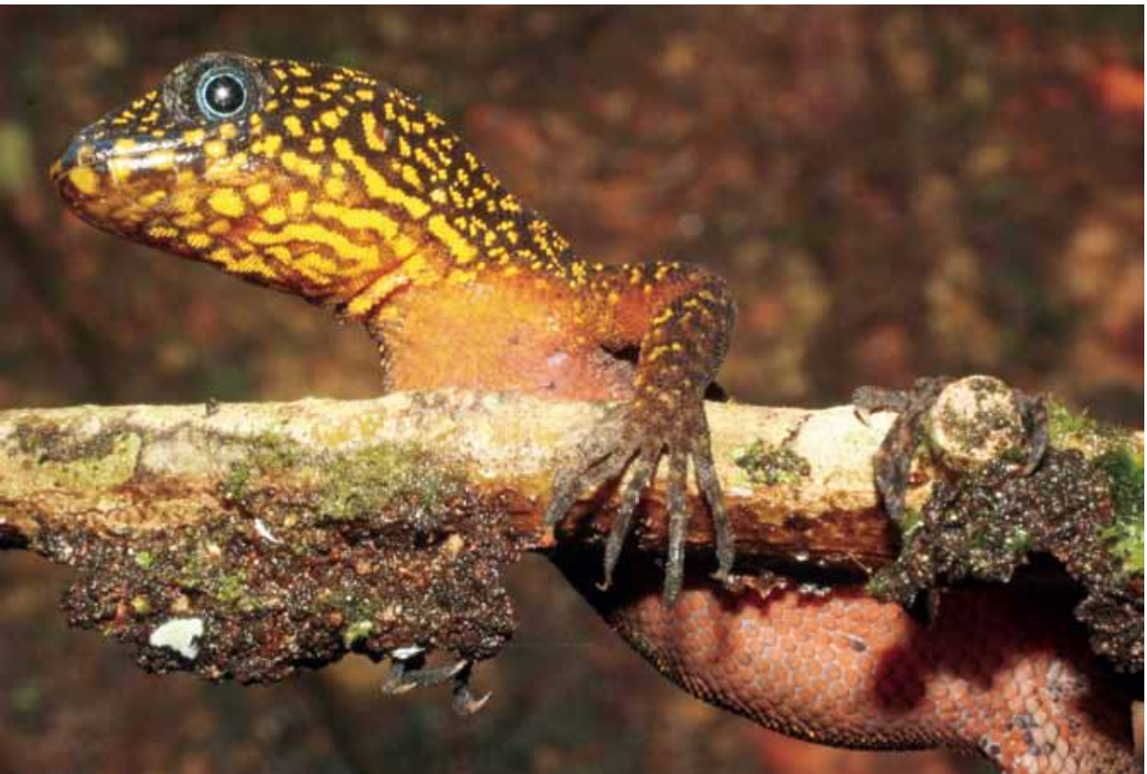
Gonatodes annularis .