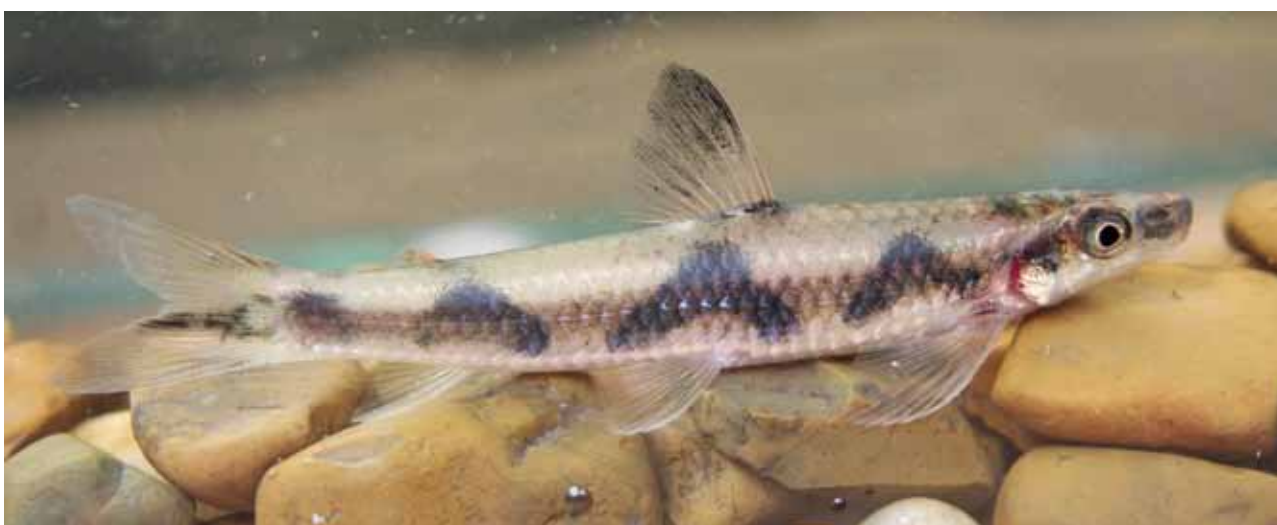
Parodon guyanensis .