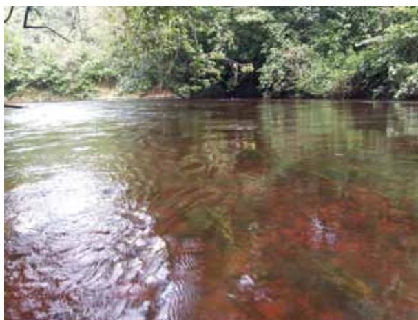
Río Uey a los pies de la Serranía de Lema, Área Focal 5.