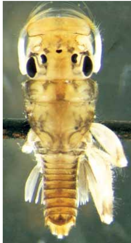
Vista dorsal de la larva del efemenóptero Leentvaaria palpalis .