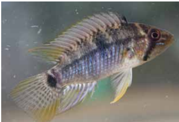
Apistogramma steindachneri .