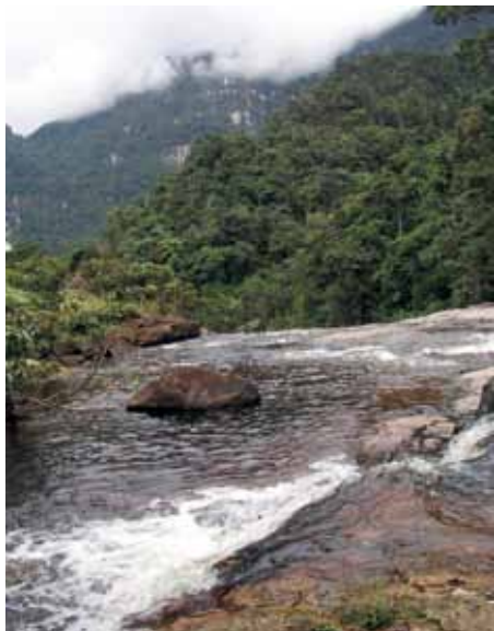
Alto río Uey, Área Focal 4.