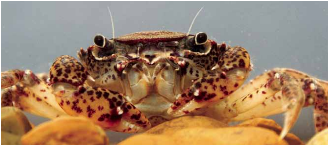
Sylvioarcinus pictus , cangrejo típico de la cuenca del Esequibo.