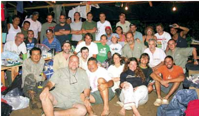
Equipo de trabajo del RAP Alto Cuyuní 2008.