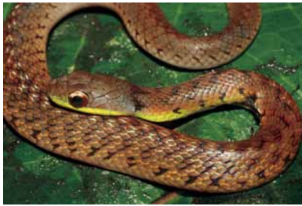
Liophis typhlus .