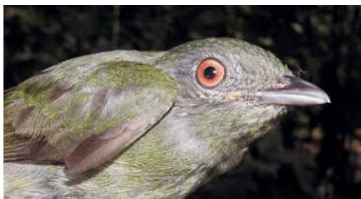
Dixiphia pipra .