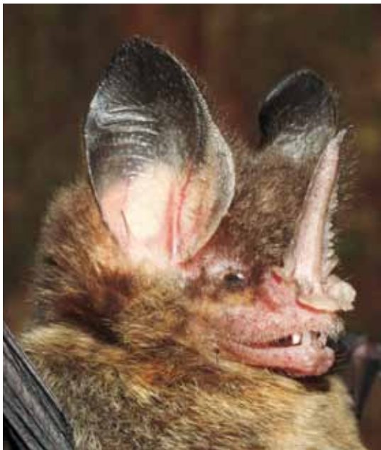
Mimom crenulatum .