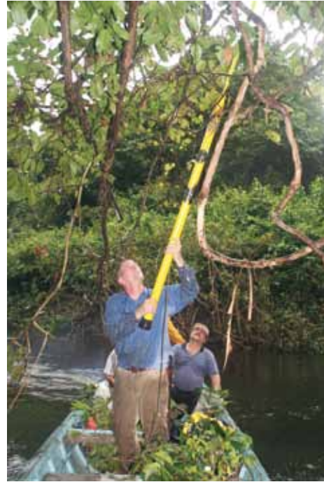
Labores de recolección de muestras botánicas.