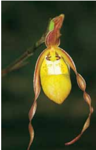
Orquídea: Phragmipedium klotzschianum .