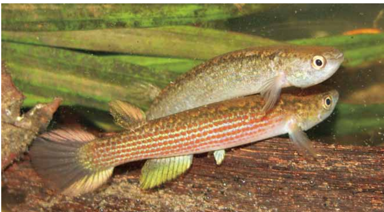
Rivulus sp. Macho y hembra.