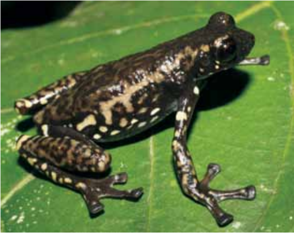
Allophryne ruthveni .