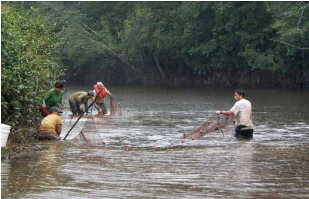
Pescando en el río Uey.