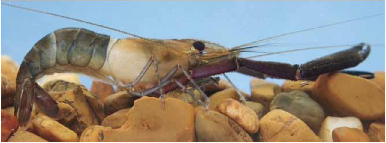
Camarón: Macrobrachium brasiliense .