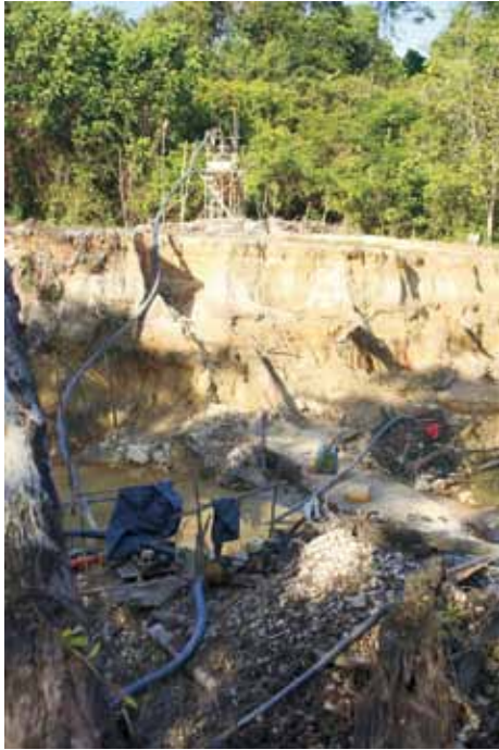
Efectos de la minería ilegal en el río Cuyuní.