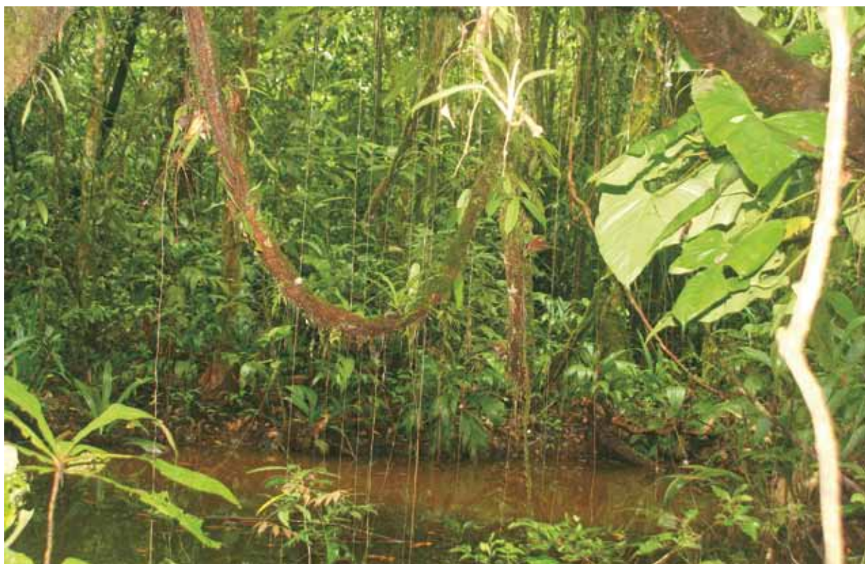
Área en recuperación tras actividades mineras, Bajo río Uey.