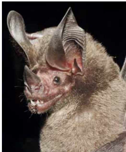
Tonatia saurophila .