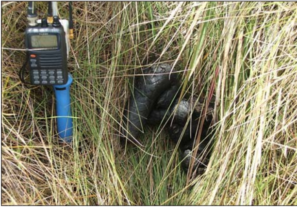
FIGURA 2. Amostra fecal de tamanduá-bandeira Myrmecophaga tridactyla encontrada no dia 31 de julho de 2007, durante o monitoramento da espécie no município de Jaguariaíva, Paraná, Brasil.

mais quentes correspondem a 22 °C, e dos meses mais frios inferiores a 18 °C (Maack, 1968).