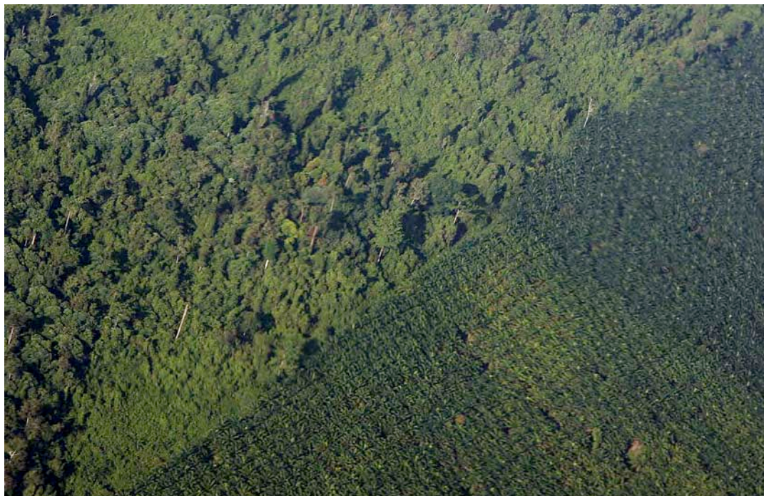
Fig. 3: A plantação de palmeiras de óleo adjacentes á floresta em Sabah, Malásia.

Finalmente, a expansão em larga-escala de palmeira de óleo reduziria a eficácia das iniciativas atuais de conservação na Amazônia. Em particular, levando em consideração a demanda por terras e preços, a expansão iria reduzir a viabilidade dos pagamentos pelos serviços do ecossistema, tais como as compensações de carbono, que proveriam incentivos para os proprietários de terra deixarem a floresta intacta [27-30]. A expansão da palmeira de óleo poderia, por exemplo, ter um impacto negativo e imediato sobre as iniciativas de conservação das florestas no estado Brasileiro do Amazonas, que tem sido um líder no uso de pagamentos de compensação de carbono para promover a conservação por proprietários em pequena escala.