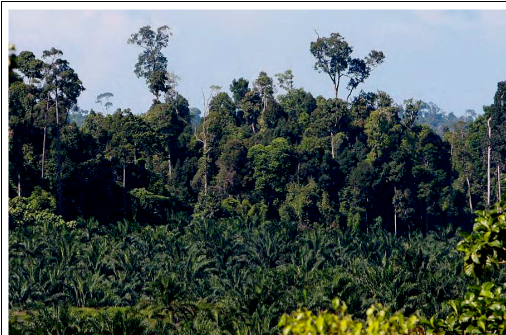
Fig. 4. Plantações de palmeiras de óleo adjacentes á floresta tropical em Sabah, Malásia.

plantação de palmeira de óleo, tais como fragmentação, podem ser reduzidos estabelecendo corredores florestais primários, zonas riparianas, e pequenas reservas dentro das plantações [36; 37]. Para encorajar tais medidas para operadores industriais, o governo Brasileiro poderia desenvolver medidas políticas para assegurar que qualquer investidor seja de verdadeira companhia de plantação—ao invés de companhias madeireiras— e membros do RSPO.