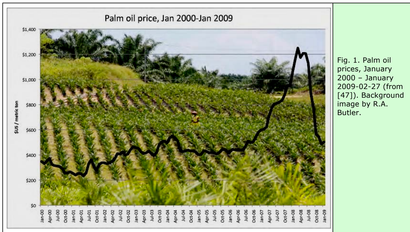
Fig. 1. Palm oil prices, January 2000 – January 2009-02-27 (from [47]).

Segundo, os incentivos econômicos para a produção de palmeira de óleo estão crescendo, dado (1) seus grandes rendimentos por unidade de área [5], (2) o alto valor da palmeira de óleo se comparada com outros produtos agrícolas (Fig. 2) [10; 11], e [3] as crescentes demandas por seu uso no ramo de biocombustíveis, alimentos e produtos industriais [12]. A expansão da plantação de palmeiras de óleo em áreas remotas poderia ser facilitada por uma proliferação de rodovias na Amazônia e outra infra-estrutura que seja de grande acesso a novas fronteiras [13; 14]. A palmeira de óleo ainda enfrentaria limitações por cause da sua necessidade de alcançar facilidades de processamento dentro de um dia de colheita, mas isso seria superado através da extração do óleo de plantas locais. No entanto, tais moinhos devem ser licenciados por agencias ambientais que deveriam ser dissuadidas para garantir licenças de refinaria em áreas ambientalmente sensíveis se a oposição pública á expansão da palmeira de óleo aumentar.