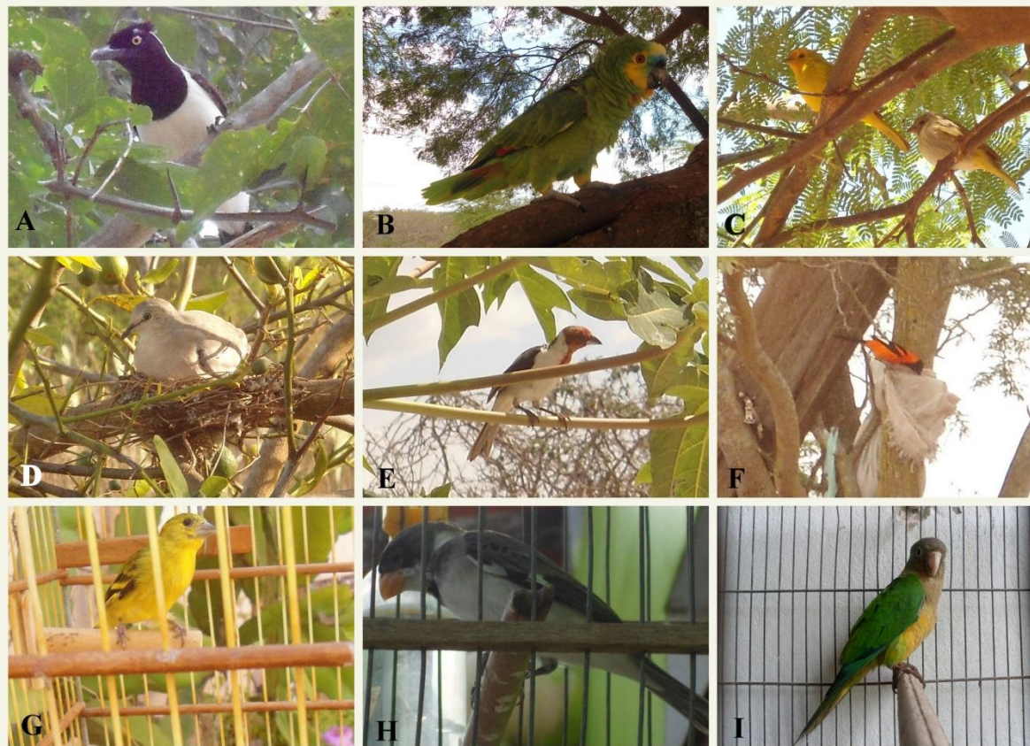
Fig. 5: Exemplo de algumas espécies utilizadas como animais de estimação (A) Cancão C. cyanopogon , (B) Papagaio A. aestiva , (C) Canário da terra S. flaveola , (D) Rolinha branca C. picui , (E) galo de campina P. dominicana , (F) Concriz I. jamacai , (G) Pinta silva S. yarrellii , (H) Golado S. albogularis , (I) Gangarra A. cactorum . Zona rural do município de São João do Cariri (A) e (B, C, D, E, F, G, H, I) Zona rural do município de Cabaceiras.

Dentre os vertebrados silvestres registrados, 63 espécies figuram na lista vermelha de espécies ameaçadas da IUCN [35], sendo que a maioria (n=61) está na categoria pouco preocupante (Least Concern), e 2 delas estão na categoria Vulnerável. São elas “pintassilgo” Sporagra yarrellii e o gato do mato pintado” Leopardus tigrinus . A primeira espécie é considerada ameaçada em razão de sua limitada área de ocorrência atual. A destruição e/ou alteração dos habitats aliada à grande captura para o mercado clandestino de aves silvestres, contribui para a redução populacional da espécie, hoje rara na natureza [43]. Ameaças à L. tigrinus incluem a perda de habitat, fragmentação, estradas, comércio ilegal (animais e peles), e abate como retaliação de predação de aves domésticas [35], como foi registrado no presente estudo. Sporagra yarrellii e Leopardus tigrinus também constam da lista brasileira de animais ameaçados do Brasil [34]