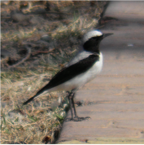
Collalba gris del Atlas Oenanthe o. seebohmi . Isla de Gran Canaria (Las Palmas), 10 de junio de 2010.

(Noroeste de África). Primera cita para Canarias y España. Existe una cita previa en la Península de un ave en Gibraltar el 28 de abril de 2005, que fue la primera cita para Europa (K. Bensusan en García, 2006).