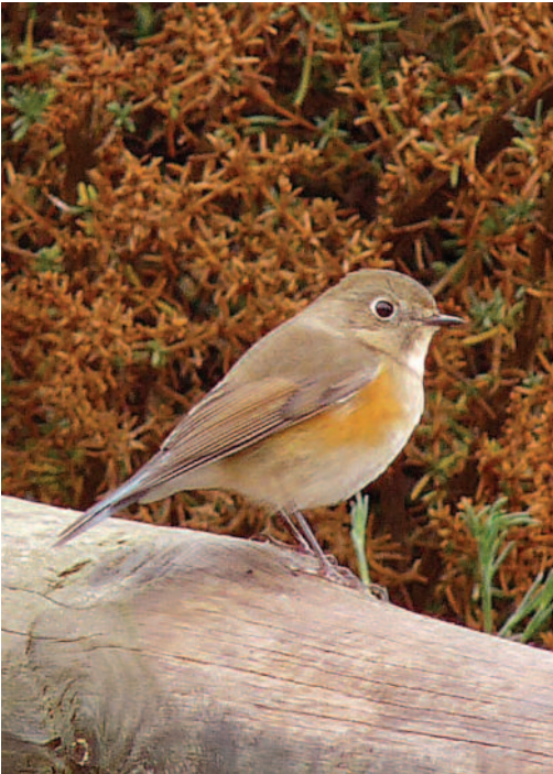
Ruisseñor coliazul Tarsiger cyanurus . Clot de Galvany (Alicante), 1 de diciembre de 2010.

2010. Huelva. Aroche, Reserva Biológica Puerto Moral, ave de primer invierno, trampeada para anillamiento, anilla 1N98861, fotos, 24 de octubre de 2010 (Francisco Romero y Manuel Barrera).