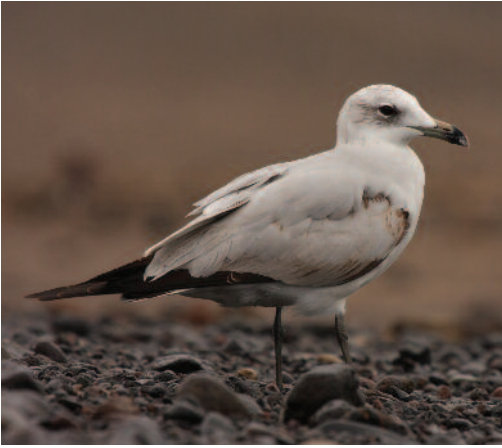
Gaviota de Audouin Larus audouinii . Isla de Tenerife (Santa Cruz de Tenerife), 30 de enero de 2010.

nal procede de Tenerife. Sin embargo, sí que cabe destacar el patrón estival y referido a aves juveniles de las otras dos citas homologadas en el presente informe, ambas efectuadas en Gran Canaria. Estas últimas se relacionarían con dispersiones postreproductoras de esta gaviota. A pesar de que ninguna de las citas homologadas previamente se ajustaría a este nuevo patrón, algunas otras anteriores a su consideración como rareza y recopiladas por Martín y Lorenzo (2001) sí que parecen tener esta explicación, como por ejemplo un ejemplar juvenil observado en Tenerife en septiembre de 1994 que había sido anillado como pollo en junio de ese mismo año en Menorca (Lancaster, 1995). Por si fuera poco, el Comité está estudiando citas posteriores que también se ajustarían a este mismo patrón y de las que se expondrán detalles en los próximos informes.