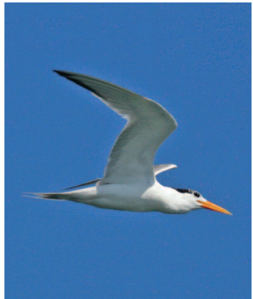
Charrán real Sterna maxima . L'Ametlla de Mar (Tarragona), 25 de agosto de 2010.

2010. Cádiz. El Puerto de Santa María, salinas de la Tapa, adulto en plumaje invernal anillado en ambos tarsos, con anilla '55V5' procedente de Rockabill, Dublin, anillado como pollo el 7 de ju-