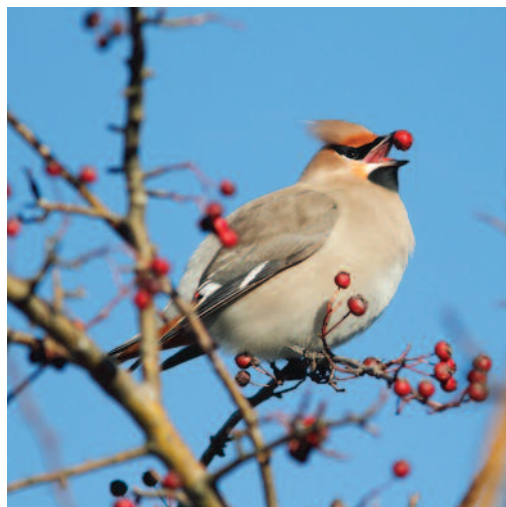
Ampelis europeo Bombycilla garrulus . Proaza (Asturias), 18 de diciembre de 2010.

(Holártico, boreal). Octava y novena citas homologadas, todas del norte peninsular, y reparatidas entre el 1 de noviembre y el 23 de marzo,