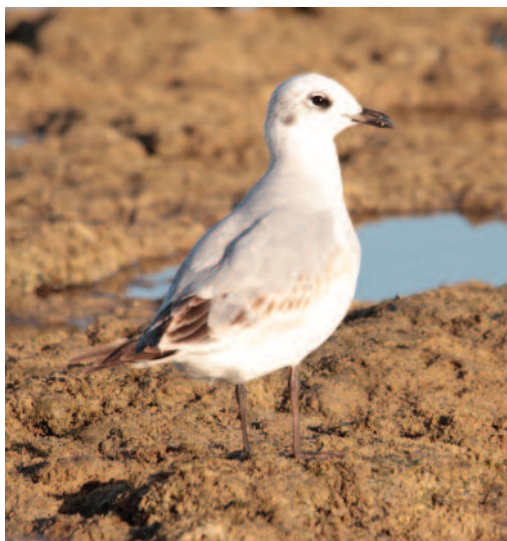
Gaviota cabecinegra Larus melanocephalus . Isla de Lanzarote (Las Palmas), febrero de 2010.

2010. Las Palmas. Isla de Gran Canaria, Telde, Bocabarranco, litoral, presencia de doce aves, todas de primer invierno, fotos, con un máximo de nueve simultáneamente el 7 de diciembre de 2010, y mínimo dos, incluyendo dos anilladas, del 18 de noviembre de 2010 al 26 de febrero de 2011 (Xabier Remírez, Francisco del Campo, Javier del Campo y Robin Mawer).