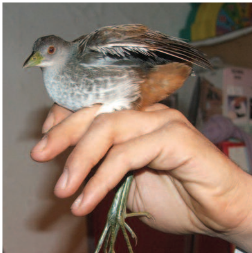
Polluela culirroja Porzana marginalis . Las Navas de la Concepción (Sevilla), 12 de diciembre de 2010.