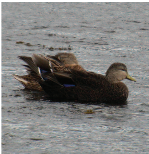
Ánade sombrío Anas rubripes . Ría de Foz (Lugo), 5 de octubre de 2008.

(Norteamérica). Últimas citas del ejemplar conocido localmente como “Pepinho”, citado en Galicia por primera vez en otoño de 1996 y observado anualmente desde 1998 y que por tanto estuvo más de una década invernando en esta localidad gallega.