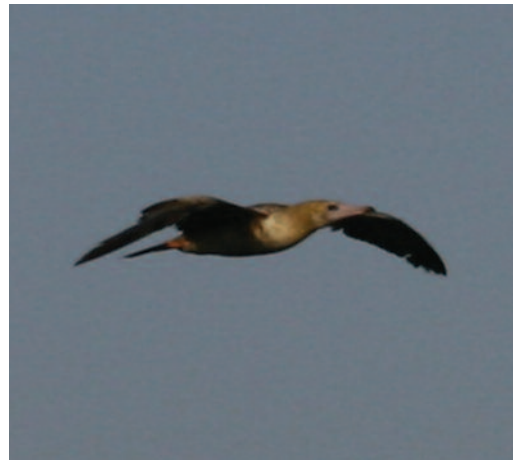
Piquero patirrojo Sula sula . Estepona (Málaga), 11 de agosto de 2010.