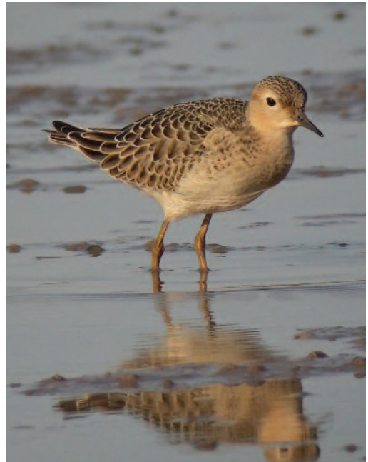
Correlimos canelo Tryngites subruficollis . L'Albufera de Valencia (Valencia), 13 de septiembre de 2010.

2010. Santa Cruz de Tenerife. Isla de La Palma, Fuencaliente, salinas, juvenil, fotos, 29 de septiembre a 5 de octubre de 2010 (Robert Burton).