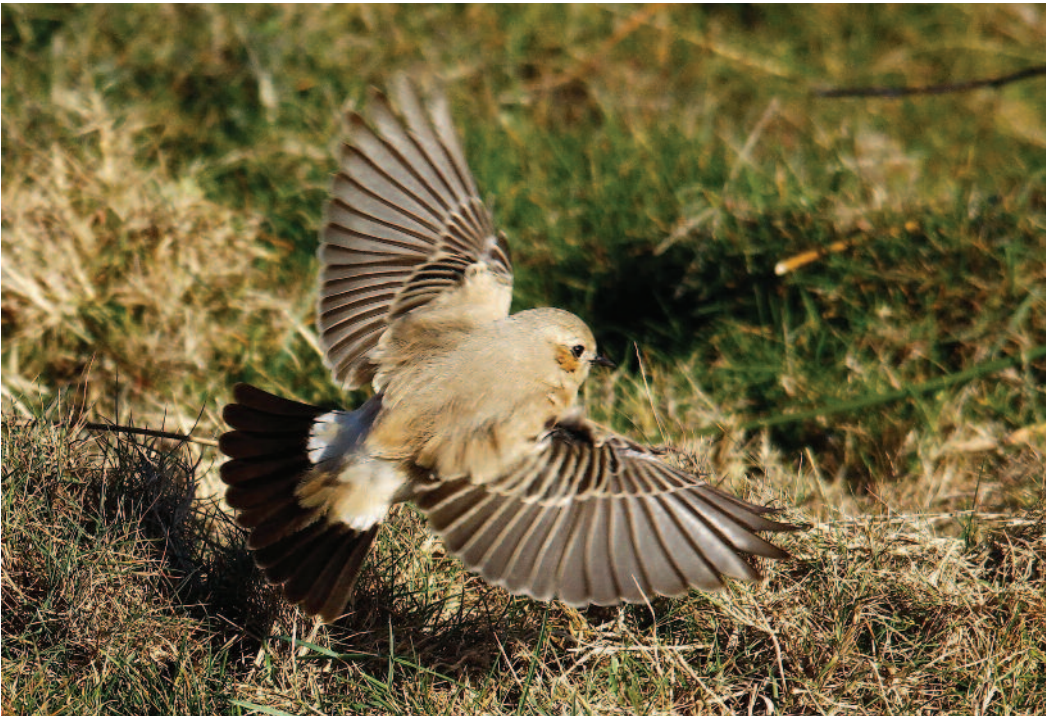
Collalba desértica Oenanthe deserti . Cabo Touriñán (A Coruña), 25 de diciembre de 2010.

(Norte de África, sudoeste y centro de Asia). Novena cita para España peninsular. Al parecer la collalba permaneció unos días más sin que se haya recibido aún la ficha de la última fecha disponible. De las nueve citas peninsulares, seis son invernales (entre noviembre y enero) y de componente norteño (A Coruña, tres; Asturias, una; Baleares,