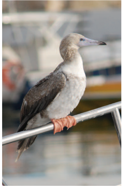
Piquero patirrojo Sula sula . L'Estartit, Torroella de Montgrí (Girona), 8 de diciembre de 2010.

(Atlántico Sur, Pacífico, Índico y Caribe). Primera cita para España y Europa, y quinta para el Paleártico occidental. A la sorpresa inicial de la cita de Málaga siguió una espectacular consideración en la cita de Girona que atrajo a un centenar de observadores, algunos de diferentes países europeos, pudiendo ser el ave perfectamente visible posada en el puerto de L'Estartit. El estado de la muda del ejemplar hace compatible la posibilidad de que se trate del mismo ejemplar (véase comentarios de Steve Howell en Gutiérrez, 2010a). El ave murió a causa de un conjunto de cuatro anzuelos en su estómago, que fueron extraídos mediante operación quirúrgica que no pudo superar (Gutiérrez, 2010b). Haas (2012) recopila las cuatro citas previas para el Paleártico occidental, todas en aguas de Cabo Verde: 17 de abril de 1977, 24 de agosto de 1986, 21 de julio de 2005 y 21 de octubre de 2007, respectivamente.