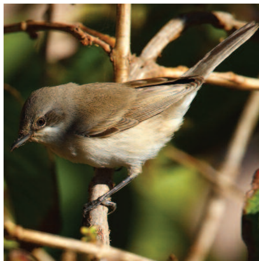
Curruca zarcerilla Sylvia curruca . Isla de Lanzarote (Las Palmas), 22 de octubre de 2010.

una, y Barcelona, una) que contrastan con las dos de abril (Castellón y Cádiz) y agosto (Sevilla). Por el contrario, las citas canarias corresponden a dos irrupciones acaecidas en 1989 y 2000 respectivamente, y relacionadas con las cercanas poblaciones africanas (De Juana, 2006).