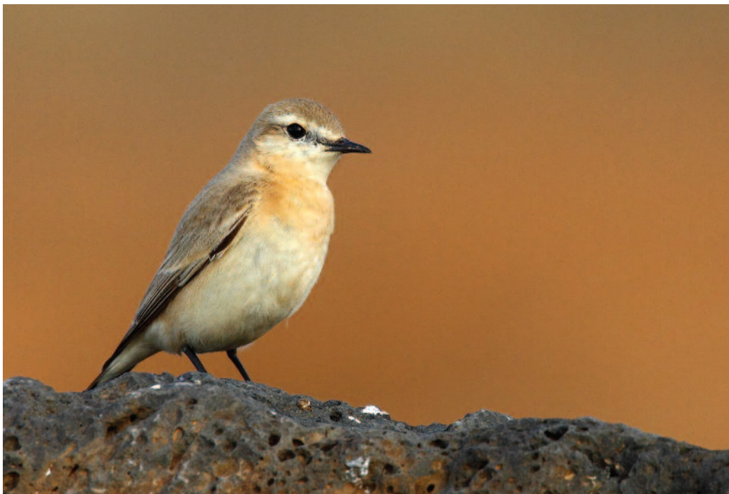
Collalba Isabel Oenanthe isabellina . Isla de Lanzarote (Las Palmas), diciembre de 2010. Foto: Juan Sagardía.

2010. Las Palmas. Isla de Gran Canaria. Castillo del Romeral, adulto, 19 de junio de 2010, foto (José García Monzón).