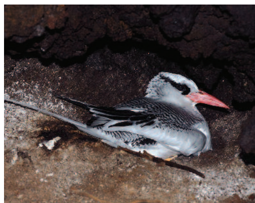
Rabijunco etéreo Phaethon aethereus . Isla del Hierro (Santa Cruz de Tenerife), 8 de junio de 2010.