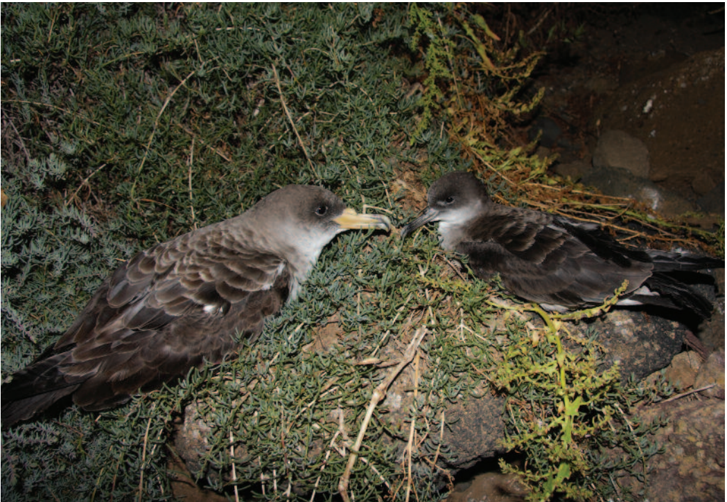
Pardela cenicienta atlántica Calonectris [diomedea] borealis y Pardela de Cabo Verde Calonectris edwardsii . Islote de Montaña Clara (Las Palmas), 6 de mayo de 2010.

A este lado del Atlántico, y fuera del entorno de Cabo Verde, no hay muchas observaciones fiables de esta pardela mas septentrionales que las de Salvajes, Canarias y Marruecos a juzgar por la bibliografía existente. Así, ha sido citada en fechas recientes en las aguas atlánticas de Marruecos, donde no se conocían citas previas (Thévenot et al. , 2003), y el primer registro homologado se refiere a dos aves vistas en las aguas de la desembo-