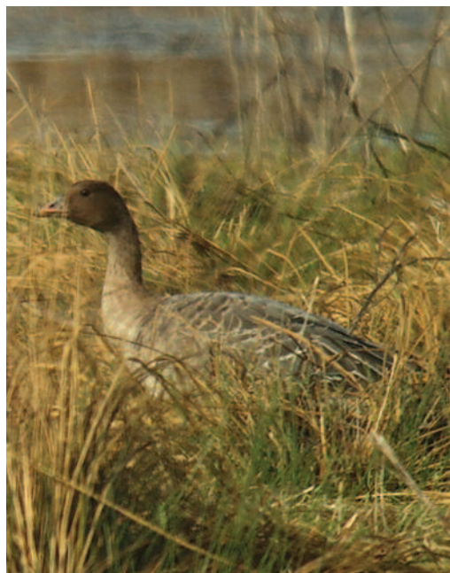
Ánsar piquicorto Anser brachyrhynchus . Salburua, Vitoria-Gasteiz (Álava/Araba), 11 de diciembre 2010.

2010. A Coruña. Ponteceso-Cabana de Bergantiños, ensenada de A Insua, hembra, probable ave de primer invierno, 28 de noviembre de 2010 a 31