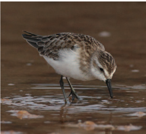
Correlimos semipalmado Calidris pusilla . Isla de La Palma (Santa Cruz de Tenerife), 24 de septiembre de 2010.

(Norteamérica). Notable colección de citas canarias de la especie y en particular de la isla occidental de La Palma, donde en esta ocasión se documentan tres de las cinco citas en el archipiélago, y además donde se homologó otra el año anterior como primer registro para dicha isla ( Ardeola , 58: 457).