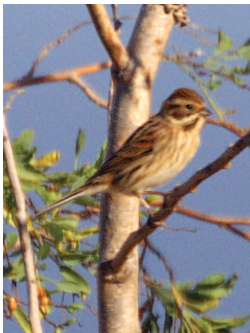
Escribano palustre Emberiza schoeniclus . Isla de Lanzarote (Las Palmas), 27 de octubre de 2010.

(Eurasia). Se homologa la primera cita en el archipiélago canario de una especie que previamente sólo había sido mencionada por Clarke (2006).