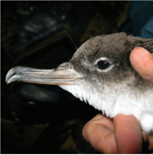
Pardela de Cabo Verde Calonectris edwardsii . Islote de Montaña Clara (Las Palmas), 23 de mayo de 2010.

se han hallado aves orilladas (Petry et al. , 2000), lo que hace sospechar movimientos similares a los de otras pardelas que crían a este lado del Atlántico. De hecho, un estudio reciente ha puesto de manifiesto interesantes resultados al respecto, resolviendo gran parte de estas dudas al constatar movimientos de efectivos desde las colonias de cría hacia aguas frente a las costas brasileñas (González-Solis et al. , 2009). Corroborando esto último, también se ha citado con cierta regularidad en aguas frente a Uruguay (Abreu et al. , 2010).