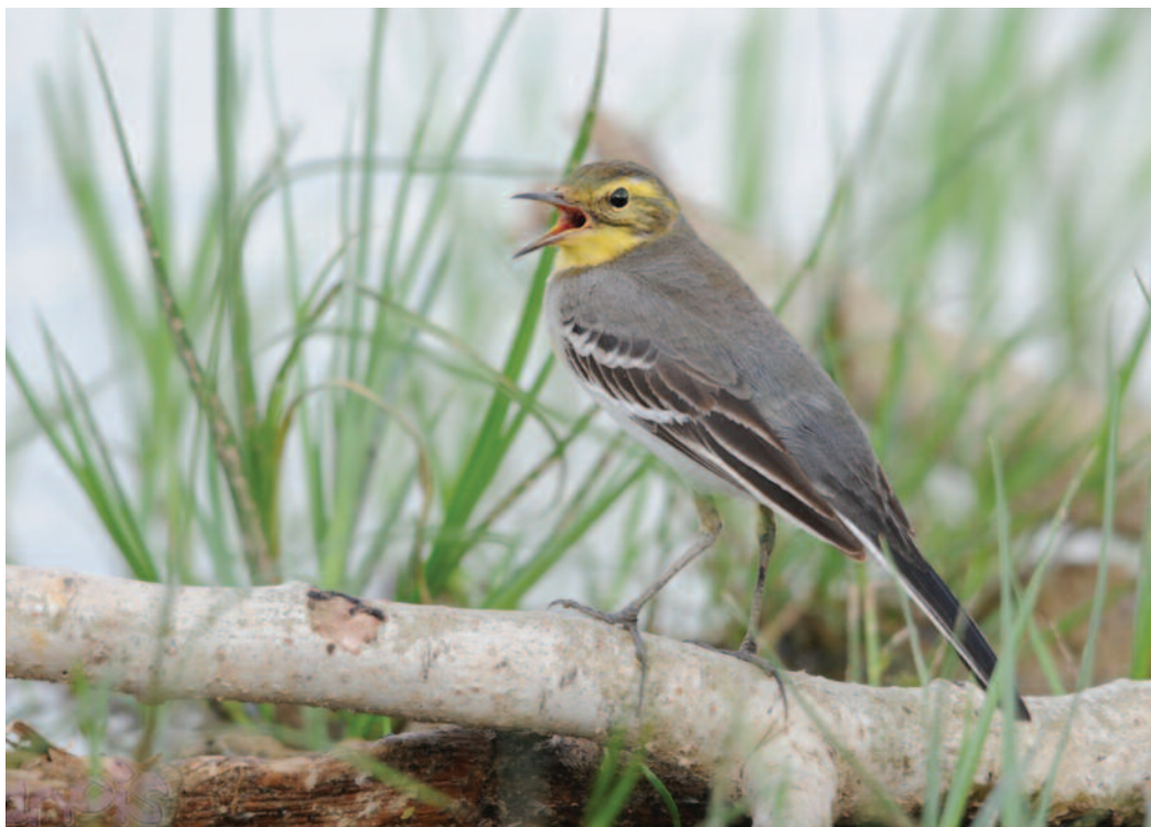
Lavandera cetrina Motacilla citreola . L'Albufera de Valencia (Valencia), 24 de septiembre de 2010.

2009. Girona. Pals, estany de Pals, adulto, fotos, 17 a 18 de octubre de 2009 (Àlex Ollé). (Este de Europa, Asia).