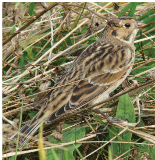
Escribano lapón Calcarius lapponicus . La Talá, Llanes (Asturias), 23 de septiembre de 2010.

(Holártico). La cita de Girona es la primera de Cataluña y atrajo a numerosos observadores a la zona. La observación de A Coruña se refiere a un bando invernante de cinco aves que pasarían todo el invierno en la zona, contando con cuatro más que fueron observados sólo el primer día. En dos fechas (2 y 15 de diciembre de 2010) se observó que este grupo estaba integrado por 6 ejemplares, mientras que el resto de jornadas sólo se vieron 5 ejemplares por lo que se estima el total de nueve como mínimo. Aunque no se puede asegurar dado que no fue capturado ningún ejemplar, esta entrada importante en la costa cantábrica de lapones de principios de septiembre, probablemente correspondería a aves americanas/groenlandesas (subes-