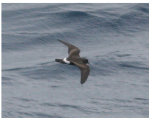
Pañño de Madeira Oceanodroma castro . Banco de Galicia (A Coruña), 21 de agosto de 2010.

(Atlántico y Pacífico, en latitudes tropicales). Continuamos con la serie de citas canarias que re-