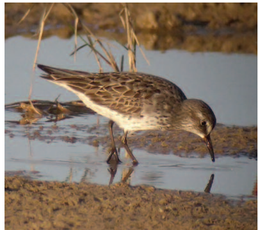
Correlimos culiblanco Calidris fuscicollis . L'Albufera de Valencia (Valencia), 4 de agosto de 2010.