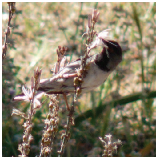
Curruca de Rüppell Sylvia rueppellii . Isla Cabrera Gran (Illes Balears), 21 de abril de 2010.