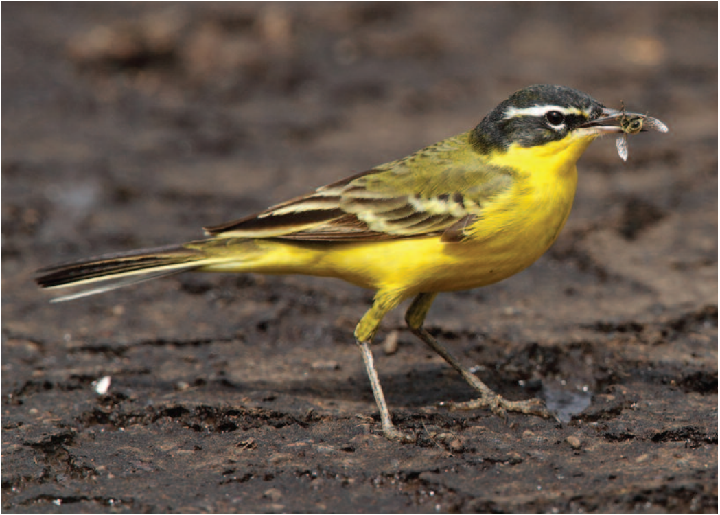
Lavandera boyera balcánica, forma superciliaris Motacilla f. feldegg superciliaris . Isla de Lanzarote (Las Palmas), 19 de marzo de 2010.

( Ardeola , 50: 143). Hay que explicar que esta subespecie en principio puede parecer sencilla de identificar, y se anuncian citas cada año de ella, pero realmente no es fácil y existen serias dificultades con algunas thunbergi (e.g. Gantlett, 2012). La forma superciliaris es una forma intermedia entre feldegg y flava/beema caracterizada por presentar una cabeza negro azabache como las feldegg puras pero con una lista superciliar blanca: presentaría genes de feldegg pero también de otra subespecie (Alström & Mild, 2003). No había citas homologadas previas en España de esta forma particular de feldegg .