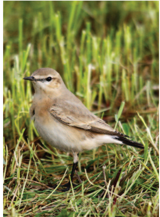
Collalba Isabel Oenanthe isabellina . Nemiña (A Coruña), 20 de noviembre de 2010.

(Extremo norte de África, de Marruecos a Túnez). Cuarta cita para España en la misma fecha (7 de abril) que la primera homologada en 1985. Las dos restantes son una de abril y otra de octubre, todas de la vertiente mediterránea.