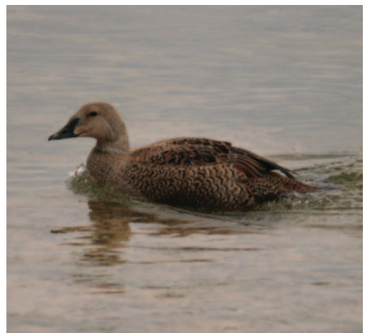
Eider Real Somateria spectabilis . Rambla del Albujón, Mar Menor (Murcia), mayo de 2010.

(Eurasia y Norteamérica, boreal). Quinta cita para España y segunda del litoral mediterráneo tras la de un macho en el delta de l'Ebre el 21 de junio de 1997 ( Ardeola , 36: 115-116), también en fechas tardías como la presente cita y que aleja