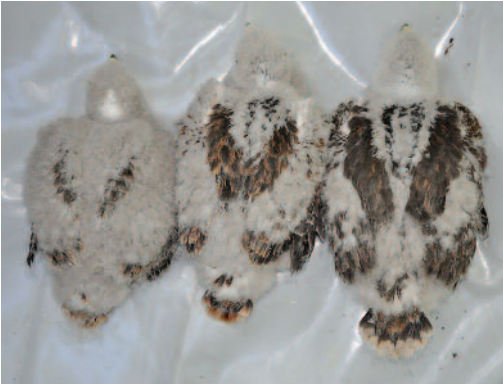
Pollos híbridos de busardo ratonero y moro Buteo buteo × Buteo rufinus . Tarifa (Cádiz), 11 de junio de 2010.