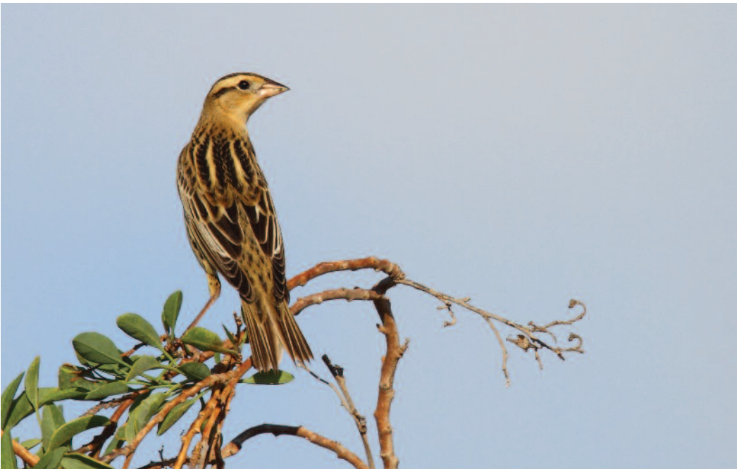
Charlatán Dolichonyx oryzivorus . Isla de Lanzarote (Las Palmas), octubre de 2010.

2010. Las Palmas. Isla de Lanzarote, Tías, Lanzarote golf, un ejemplar de edad y sexo descono-