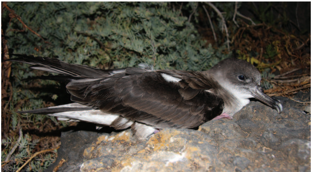
Pardela de Cabo Verde Calonectris edwardsii . Islote de Montaña Clara (Las Palmas), 6 de mayo de 2010.

Al contrario de lo que ocurre con las dos subespecies de pardela cenicienta, C. d. diomedea y C. d. borealis , con las que se emparentaba hasta no hace mucho tiempo (Crochet et al. , 2010), se desconocen muchos aspectos de la biología y ecología de esta pardela propia de las islas de Cabo Verde. Entre ellos, sus cuarteles de invernada, sospechándose inicialmente su dispersión pelágica por el Atlántico Sur, aunque recientemente se ha citado en aguas frente a Carolina del Norte en Norteamérica (Patterson y Armistead, 2004) y desde hace tiempo se ha venido mencionando su presencia en las aguas de Brasil, donde además