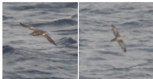
Pardela balear Puffinus mauretanicus . Banco de La Concepción, norte de la isla de Lanzarote (Las Palmas), 18 de marzo de 2010.

(Endémica de Baleares, sale al Atlántico parte del año). Primera cita que se homologa para el conjunto del archipiélago canario, sin que se tenga constancia fehaciente de observaciones ante-