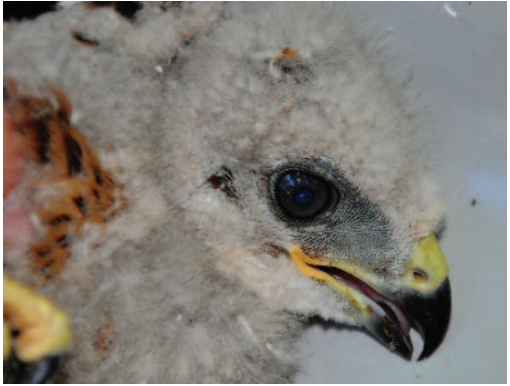
Pollo híbrido de busardo ratonero y moro Buteo buteo × Buteo rufinus . Tarifa (Cádiz), 11 de junio de 2010.