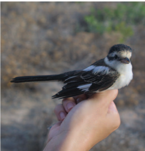
Alcaudón núbico Lanius nubicus . Isla Cabrera Gran (Illes Balears), 5 de septiembre de 2003.

(Desde Grecia y Turquía hasta Irán). Segunda cita para España después del macho adulto observado en Puerto Pollensa, Mallorca, del 22 a 26 de abril de 1991 (De Juana, 2006). Con relación al datado, el ave presentaba muda de plumas de vuelo suspendida, patrón típico de los adultos, mostrando secundarias y cobertoras medianas viejas con patrón juvenil, lo que