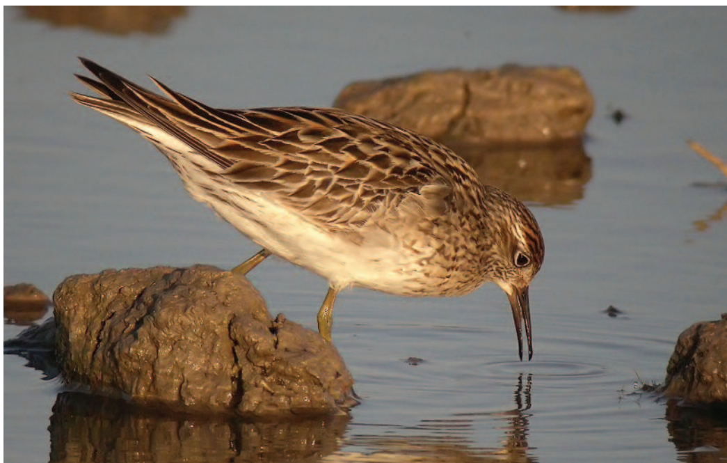
Correlimos acuminado Calidris acuminata . L'Albufera de Valencia (Valencia), 29 de septiembre de 2010.

(figura 2). Las citas recogidas tienen un fuerte componente mediterráneo. Las diferencias de patrón de distribución (figura 3) y épocas de llegada sugieren diferentes orígenes de las aves. Bien directo desde el neártico en el caso de citas del noroeste y Canarias; bien procedente de Gran Bretaña y zonas próximas, después de una eventual anterior llegada neártica, que las llevaría al sur, al Mediterráneo, al reemprender su viaje migratorio en busca de las latitudes correspondientes a sus localidades de invernada. No se puede sin embargo descartar un cierto componente siberiano en estas citas del este peninsular, tal vez de aves incorporadas en años anteriores a la ruta migratoria paleártica, lo que aconseja seguir estudiando el patrón de aparición de esta especie. En conjunto, la evolución de las citas de la especie en España presenta una evolución al alza estadísticamente significativa (TRIM: Strong increase ( p < 0.01 ) = 1.0813 (SE = 0.0120)). Nótese sin embargo la ausencia de citas homologadas peninsulares en 2009 lo que recomienda que la especie siga como rareza.