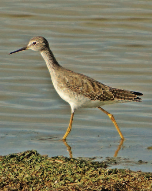
Archibebe patigualdo chico Tringa flavipes . Laguna de Pétrola (Albacete), 31 de noviembre de 2010.

2010. Girona. Castelló d'Empúries, Parc Natural dels Aiguamolls de l'Empordà, estany del Cortalet, juvenil, fotos, 29 de septiembre a 10 de octubre de 2010 (Oriol Clarabuch; Jordi Martí-Aledo y otros).