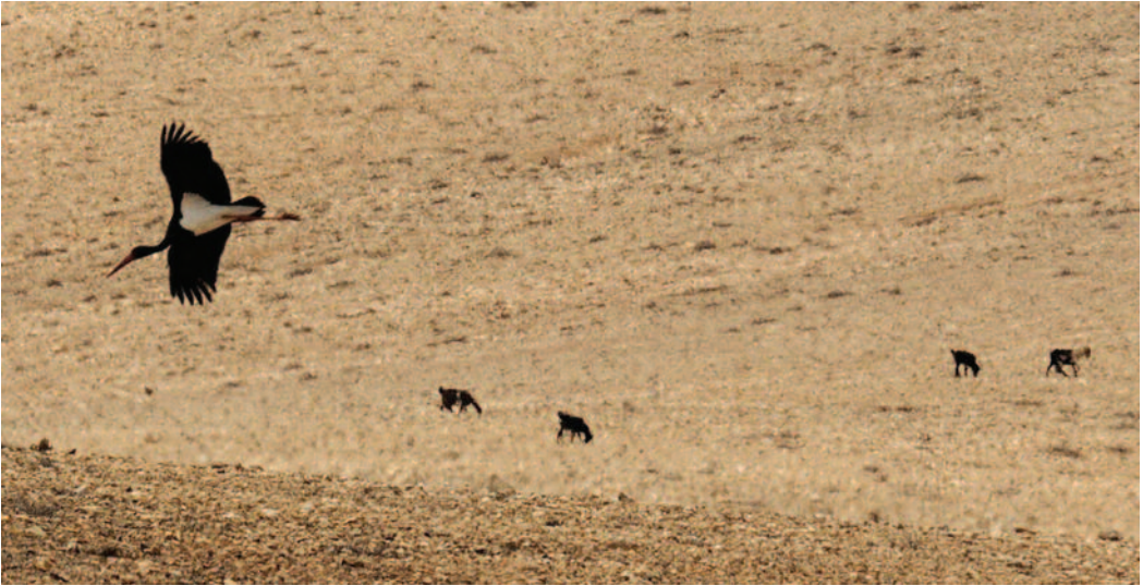
Cigüeña negra Ciconia nigra . Isla de Fuerteventura (Las Palmas), 19 de septiembre de 2010.

que coincide con las fechas de la observación canaria del presente informe, en concreto se refiere a dos ejemplares vistos en São Miguel a finales de octubre de 2010, permaneciendo uno de ellos hasta los primeros días de noviembre de dicho año (Muchaxo et al. , 2011).