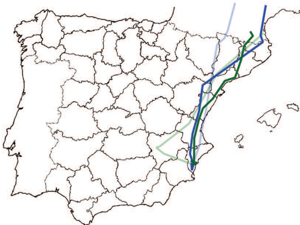
FIGURA 1: Movimientos del águila moteada Aquila clanga Tönn en España durante 2010 (dibujo propio a partir de http://birdmap.5dvision.ee ). En azul oscuro (ruta de vuelta al norte, primavera), en verde oscuro (ruta de retorno a El Hondo, otoño). Rutas de tonos claros correspondientes a 2009 (véase Ardeola , 58: 454 y texto).

2010. Alicante. Elx/Crevillent, El Hondo, inmaduro de tercer invierno marcado con emisor vía sa-