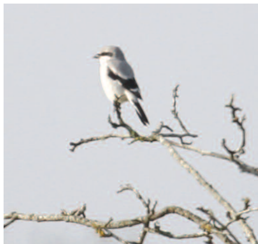
Alcaudón norteño Lanius excubitor . Auritz-Burguete (Navarra), 9 de diciembre de 2010.

(Eurasia y Norteamérica). Primera cita homologada de la especie desde su establecimiento como rareza en España. Las fotos permiten separar el ejemplar de los taxones meridionalis y pallidirostris . Pese a la luz fuerte, las partes inferiores se ven totalmente blancas, al contrario que cualquier meridionalis , por claro que sea. Flancos, vientre, pecho, etc, son blancos o muy claros, y no hay ningún contraste con la garganta. La extensión del blanco en la base de primarias y terciarias es típica también, al igual que los tonos grises bastante claros (algo más oscuros de lo normal por la luz dura que incide en el ave). Con las fotos de la cita no se puede conocer la identidad subespecífica ( homeyeri o nominal excubitor ), ya que no se ven el ala y la cola lo suficientemente bien. El obispillo aparentemente gris y la mancha blanca de la base de primarias no muy ancha, son de tipo excubitor , pero parece que hay blanco extenso en base de rectrices, más tipo homeyeri . No obstante,