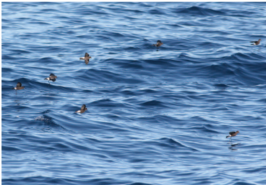
Paíño de Wilson Oceanites oceanicus . Banco de Galicia (A Coruña), 20 de agosto de 2010. Foto: Albert Cama.

2010. A Coruña. En el mar, Banco de Galicia, a unas 200 millas náuticas al oeste de Fisterra, 2 aves, foto, 7 de agosto de 2010 (Albert Cama y Xulio Valeiras).