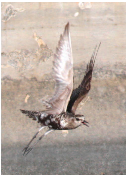
Chorlito dorado americano Pluvialis dominica . Isla de La Palma (Santa Cruz de Tenerife), 9 de octubre de 2010.