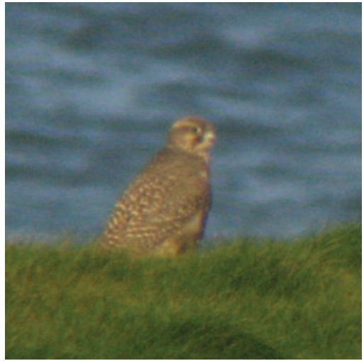
Halcón gerifalte Falco rusticolus . Villamil (Asturias), 22 de enero de 2010.

(Holártico boreal). Primera cita homologada para España. Los autores contactaron con cetreros expertos en la especie para descartar hibridaciones, así como con autores extranjeros para confirmar la identidad y datado. El ejemplar llega a la costa asturiana después de varias semanas de vientos siberianos y con buena parte de Europa a temperaturas bajo cero. En Francia se observa