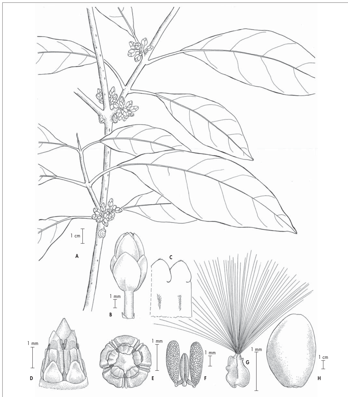
Fig. 1. – Marsdenia cuixmalensis Juárez-Jaimes & L. O. Alvarado. A. Rama con inflorescencias; B. Flor; C. Detalle del interior de la corola; D. Ginostegio; E. Vista apical del ginostegio; F. Polinario; G. Semilla; H. Fruto.

[Lott 3651, MEXU] [Dibujo de E. Esparza]