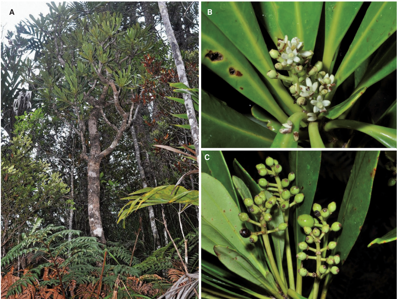
Fig. 2. – Phelline barrieri Barrera & Schlüssel. A. Habitus; B. Inflorescence femelle; C. Jeune infrutescence. [A, C: Callmander et al. 1260; B: Callmander et al. 1262]

Phénologie. – Les fleurs mâles au stade boutons uniquement ont été récoltées en avril, juillet et octobre. Les fleurs femelles ont été récoltées au stade boutons en août et octobre et à maturité en juillet et novembre. Une seule collection récoltée en juillet contient des fruits immatures et mûrs (Schmid 5310), tous les autres spécimens n'ont que des ovaires fécondés ou des fruits immatures et ont été récoltés en janvier, juillet, août, novembre et décembre.