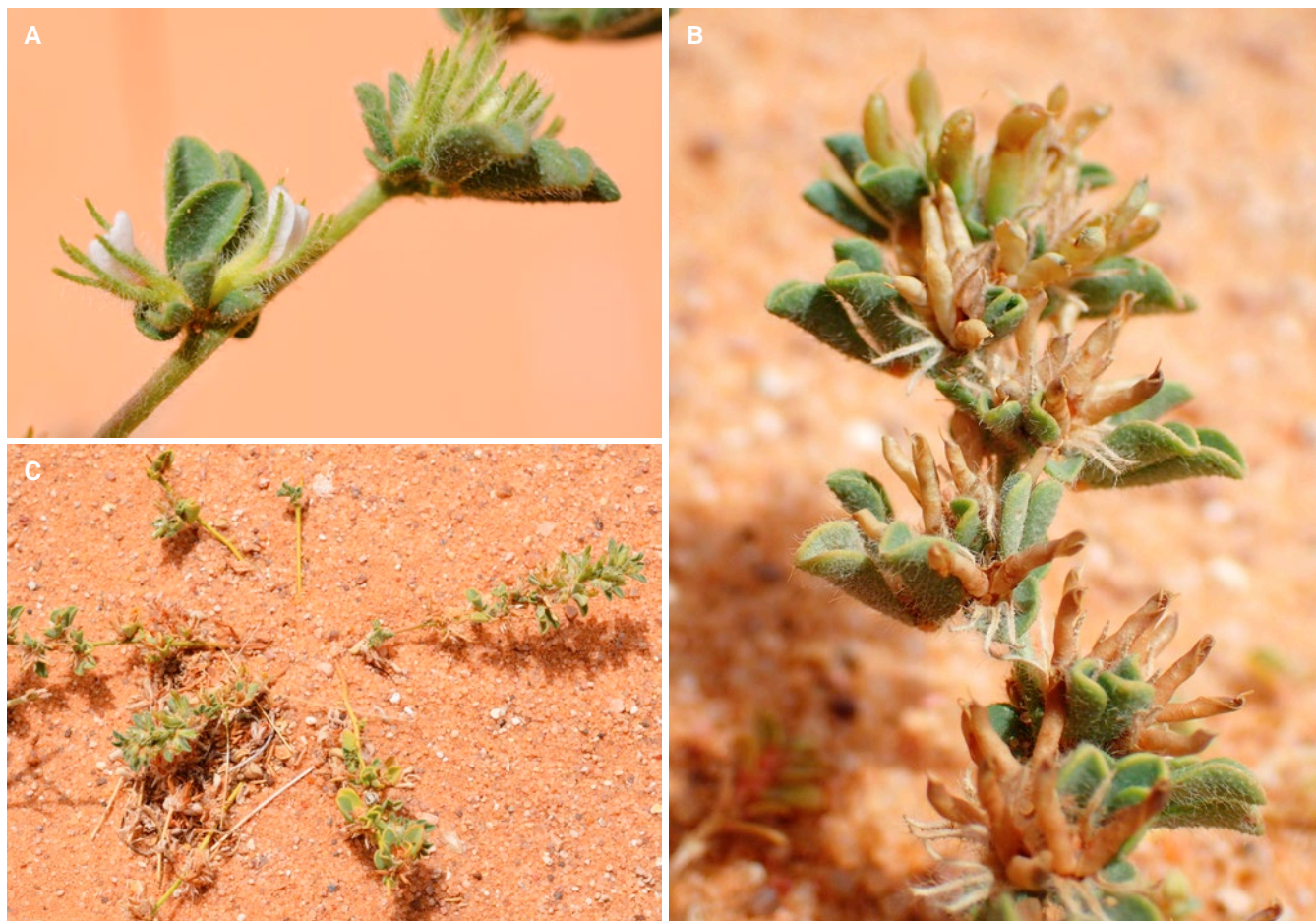
Fig. 2. – Lotus zemmouriensis C. Chatel., F. Andrieu & Dobignard. A. Inflorescence et feuilles; B. Infrutescence; C. Ecologie. [B–C: Chatelain 4375]

Notes. – Lotus zemmouriensis est affine de L. glinoides par sa morphologie rampante dans le sable, la forme de ses feuilles et la couleur blanc-rose de ses fleurs; elle en diffère par des gousses 5–6 fois plus courtes, une pilosité plus importante avec des poils hirsutes 2 à 3 fois plus longs, une corolle deux fois plus courte dépassant à peine le calice, qui est fortement hirsute. Cette espèce à l'état végétatif a probablement été souvent confondue avec Leobordea platycarpa (Viv.) B.-E. van Wyk & Boatwr. mais qui a des feuilles longuement pétiolées