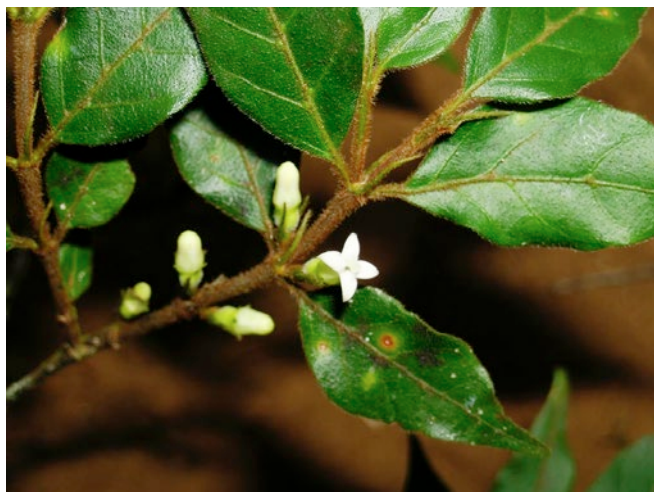
Fig. 4. – Pyrostria ambrensis Atalaha, Rakotonas. & Razafim. Rameau avec inflorescences femelles. [Bremer et al. 5048]

Note. – L'espèce diffère des autres espèces de Pyrostria malgaches par ses rameaux, pétioles, limbes, bractées et stipules à poils rouille (in vivo) (vs. rameaux, pétioles, limbes, bractées et stipules glabres ou poilus blanchâtres). Ses stipules sont triangulaires, filiformes à l'apex (vs. stipules triangulaires et aiguës ou spatulés à l'apex). Ses bractées sont en forme de capuchon, filiformes à l'apex (vs. bractées en forme de capuchon et aiguës ou échancrés à l'apex). L'ovaire et le pédicelle de la fleur femelle sont poilus, tandis que l'ovaire et le pédicelle de la fleur mâle sont glabres (vs. ovaire et le pédicelle des fleurs femelles et mâles glabres).