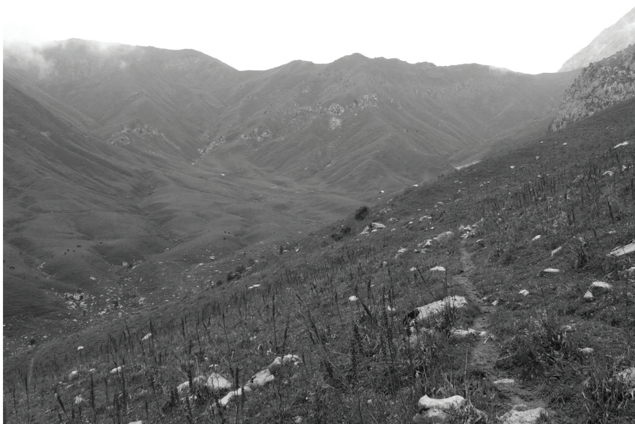
РИСУНОК 3 Жайлоо «Кара Булак», расположенное на территории государственного земельного запаса.

Плотность травянистого яруса растительного покрова составляла лишь 55%. Воздействие выпаса скота было самым низким из всех изученных пастбищ (II, среднее). Видовое богатство было выше, чем на жайлоо «Кара Булак» (22 биологических вида), однако показатель НДВИ был схожим (0.22). На данном пастбище преобладает альпийское сообщество Phlomooides–Geranium .