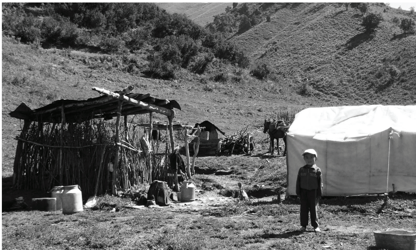
РИСУНОК 5 Жайлоо «Отуз Арт», расположенное на территории государственного лесного фонда.

коз, коров и лошадей, принадлежащих жителям местности Чорбак, а чабанам за их услуги платили фиксированную плату за каждого животного. В среднем, период летнего содержания скота на жайлоо стал дольше; сегодня он длится до сентября, поскольку чабаны утратили доступ к большинству весенних и осенних пастбищ откормочного хозяйства «Живпром». В свою очередь, устойчивость пастбища к беспокойству и повреждениям, вносимым его использованием человеком, сократилась. Наше экологическое исследование растительного покрова подтвердило, что пастбище «Кара Булак» подвергается тяжелому выпасу скота. Это привело к самой низкому уровню плотности растительного покрова, значения НДВИ и видового богатства среди всех изученных пастбищ. Растительное сообщество Plantago-Polygonum преобладает в этой местности, что является показателем высокой степени воздействия выпаса и выбивания пастбища скотом.