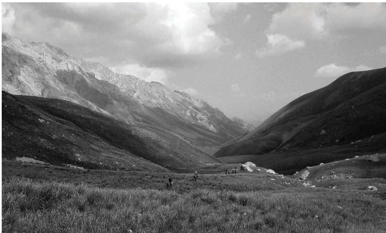
РИСУНОК 4 Жайлоо «Керей», расположенное на территории государственного земельного запаса. (Фото авторов, 2008 г.)

травянистого яруса составило 80%). В западной части было зарегистрировано среднее значение видового богатства на уровне 24 биологических видов на участок. В восточной части было зарегистрировано самое высокое видовое богатство при среднем значении 35 биологических видов на участок. Показатель НДВИ был выше, чем на других двух жайлоо (0.3 в западной части и 0.34 в восточной части). Здесь преобладает сообщество Aconogonon-Prangos . В западной части мы также нашли сообщество Plantago-Polygonum на плоских участках этого летнего пастбища рядом со стоянками.