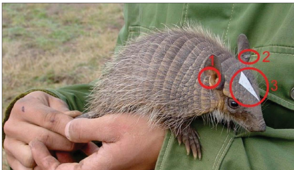
Figura 2. Piche llorón ( Chaetophractus vellerosus ) con tres marcas para individualizarlo. 1. Corte de oreja (permanente). 2. Arito (Semi-permanente). 3. Calcomanía (Temporaria).

Para cumplir con este objetivo, poner a prueba la hipótesis planteada y obtener información básica de estas tres especies de armadillos, se seleccionaron cuatro de los 34 establecimientos agropecuarios previamente visitados. La elección se basó en tener representados