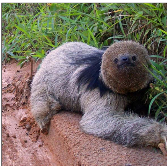
Figura 1. Indivíduo da espécie Bradypus torquatus deslocando-se à beira da estrada, na localidade de Nova Friburgo.

Provavelmente a espécie B. torquatus não havia sido registrada em tais remanescentes florestais devido a dois fatores envolvendo este gênero: (1) a dificuldade em localizar estes animais, ocasionados por seus hábitos comportamentais, e (2) a falta de pesquisas