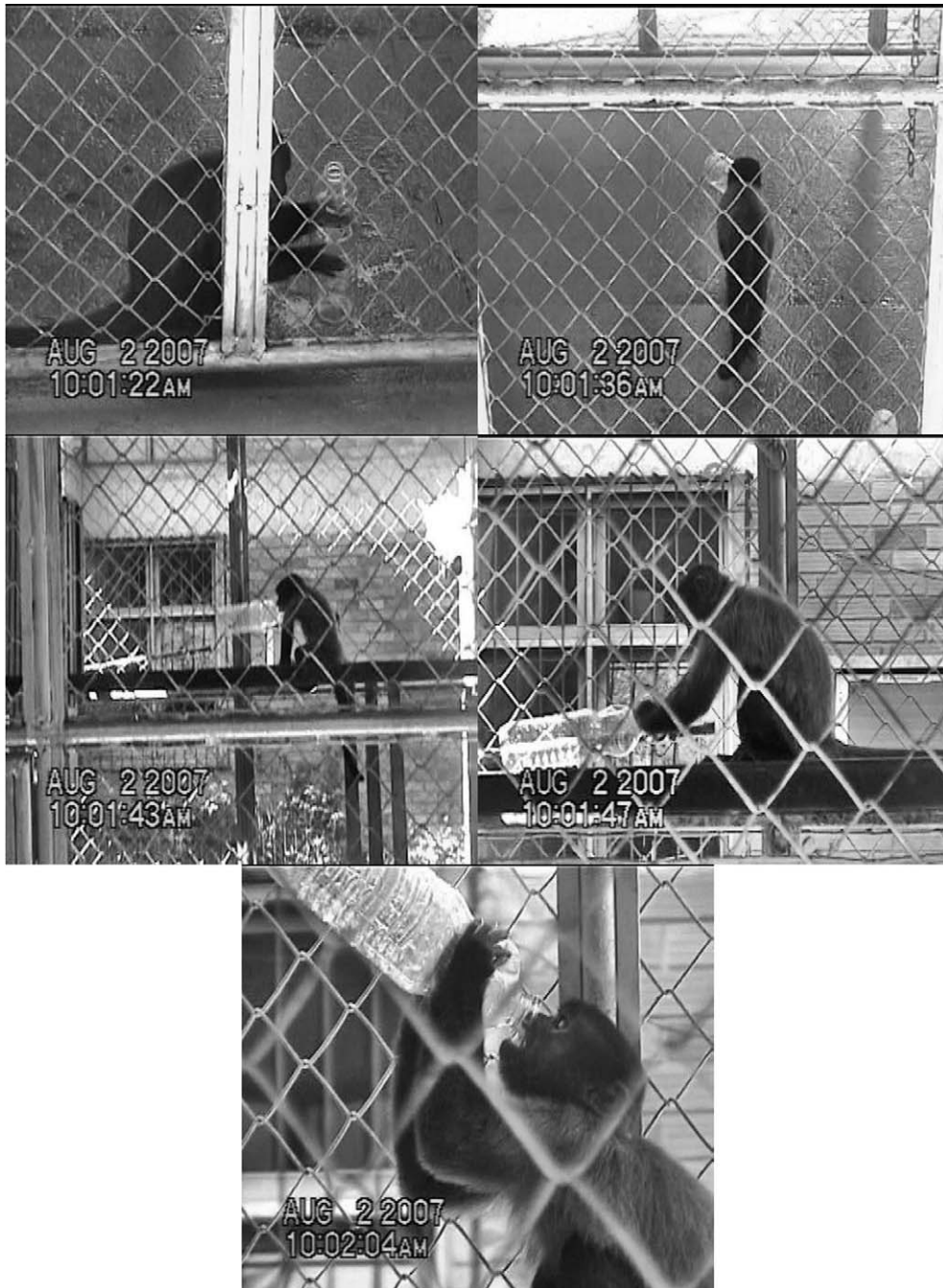
Figura 1. Observação casual do macaco-prego ( Cebus apella ) macho sub-adulto utilizando a água do bebedouro como ferramenta. Filmagem do primeiro autor, em 02 de agosto de 2007.

bebedouro por aproximadamente dois segundos, introduzindo apenas uma pequena quantidade de água dentro da garrafa. Em seguida, segurou a garrafa com as duas mãos, bateu levemente o fundo da garrafa na plataforma e lambeu o interior do bocal. Na sequência ergueu a garrafa com as mãos (a garrafa formava um ângulo de aproximadamente 30° com o poleiro), posicionando o gargalo em frente a sua boca e, então, bebeu o líquido que fora depositado dentro do objeto (Fig. 1). Como ainda restavam alguns farelos no fundo da garrafa, o sujeito repetiu a ação. Mas, desta vez