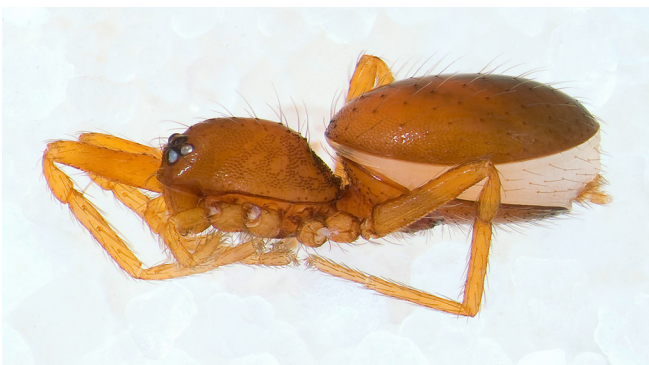
Abb. 9: Das Sandwichspinnchen ( Silhouettella loricatorata , 1,5–2 mm) ist nach ihren Scuta/Schildchen auf der Ober- und Unterseite des Hinterleibes benannt

Silhouettella loricatorata – Sandwichspinnchen: der Hinterleib dieser winzigen Art erinnert an ein Sandwich (Abb. 9).