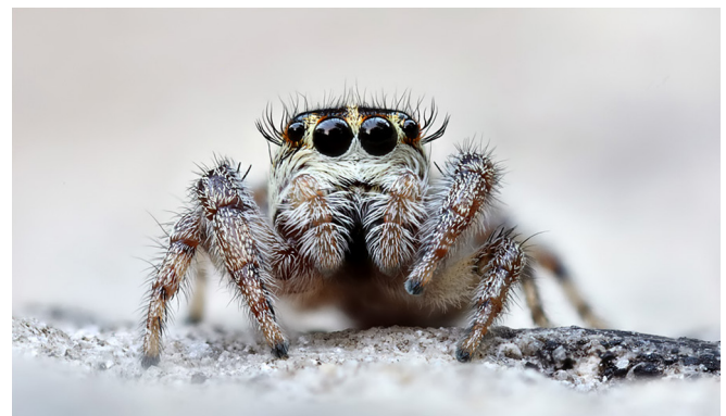
Abb. 10: Das Weibchen des Kanarenspringers ( Macaroeris nidicolens , 4–7 mm) hat schön geschwungene „Wimpern“

Talavera thorelli – Dorn-Ringelbeinspringer: nach der prominenten dornförmigen Embolusspitze des männlichen Pedipalpus.