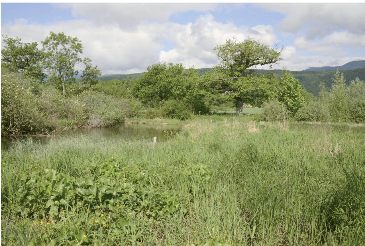
Fig. 5. Le marais de Prodon (station 12), situé sur les communes de Grilly et Divonne-les-Bains (Ain), jouxte sur la rive française de la Versoix celui du Grand Bataillard. Il présente encore quelques magnocariçaies favorables à la présence du Rat des moissons.

remarquer certains auteurs, la connectivité des habitats est en effet un facteur important pour nombre de micro-mammifères et sans doute encore plus pour le Rat des moissons qui ne peut se passer de haute végétation herbacée, du moins durant les trois quart de l'année (Darinet & Favier, 2014; Blant et al. , 2012; Wijnhoven et al. , 2006). Dans le Pays de Gex, le maintien de certaines populations ne dépend d'ailleurs que de la présence de corridors végétalisés, comme des canaux de drainage en plein champs, des ourlets en lisière humide (Fig. 4), des bandes herbeuses sur sol hygromorphe et même de certains tronçons de voie ferrée à l'abandon, qui sont autant de milieux, certes précaires, mais qui n'existent pas dans le Mandement genevois tout proche. Notons, par ailleurs, que les nids découverts dans le bassin genevois étaient pour l'essentiel construits dans des formations plus ou moins pures de grandes laïches, généralement Carex acutiformis , ce qui explique en partie l'intérêt du Rat des moissons pour les magnocariçaies qui constituent son habitat optimum (Tab. 2). Cet intérêt de l'espèce pour ce type de milieu a d'ailleurs très bien été démontré en 2015 lors d'une campagne de recensement de nids dans le marais du Grand Bataillard où 80% d'entre eux se trou-