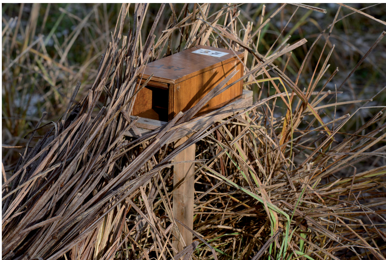
Fig. 3. Dispositif de piégeage utilisé pour la capture des Rats des moissons.

et sans découverte de milieux favorables à l'espèce, sauf vers Moulin Fabry où subsiste une petite zone humide colonisée essentiellement par des roseaux. Notons, par ailleurs, qu'en octobre 2007, six sites censés favorables à l'espèce avaient déjà été prospectés dans le canton de Genève et qu'aucun indice de présence n'y avait été découvert (Blant et al. , 2012).