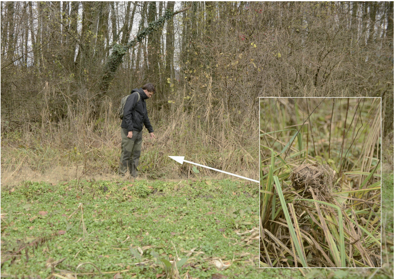
Fig. 4. Emplacement d'un nid de Rat des moissons trouvé en novembre 2016 (station 8), à trois mètres de la frontière suisse sur la commune de Thoiry (Ain), dans une lisière herbacée constituée en grande partie par des laïches ( Carex sp.) et par quelques Roseaux ( Phragmites australis ).

Contrairement au Grand Bataillard, relativement épargné, tous les sites découverts se situent à l'emplacement d'anciens marais ou de zones prairiales qui jusque vers la fin du XIX e siècle couvraient d'importantes surfaces, à l'exemple du complexe des anciens marais d'Arbère, de Prodon et de Divonne, dont la surface vers 1950 était encore proche de 200 ha. Aussi paraît-il vraisemblable que la plupart des stations découvertes constituent des zones de repli, sans véritable connexion apparente entre elles et où les populations résiduelles de Rats des moissons trouvent néanmoins des milieux de substitution sub-optimum, souvent fortement dégradés et menacés à très court terme par l'aménagement du territoire, l'urbanisation, l'agriculture intensive, le réseau routier ou par l'envahissement des néophytes. C'est notamment le cas d'une petite population située sur la commune de Saint-Jean-de-Gonville et à quelques encablures de la frontière suisse. A cet endroit, les Rats des moissons ne survivent en effet que grâce à la présence de bandes herbacées situées le long de la semi-autoroute qui relie Collonges à Saint-Genis-Pouilly et de fossés de drainage en plein