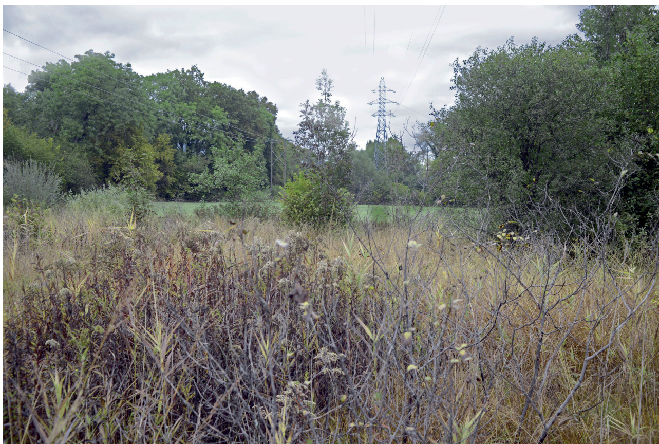
Fig. 2. Friche humide à Molinie ( Molinia arundinacea ), partiellement colonisée par des Roseaux ( Phragmites australis ) et des Solidages ( Solidago canadensis ), située au nord de l'ancien marais de Greny (commune de Péron - Ain), lieu même où ont été capturés 10 Rats des moissons en novembre 2016 (station 5).

de graines de tournesol décortiquées ont été nécessaires avant d'effectuer les premières sessions de capture.