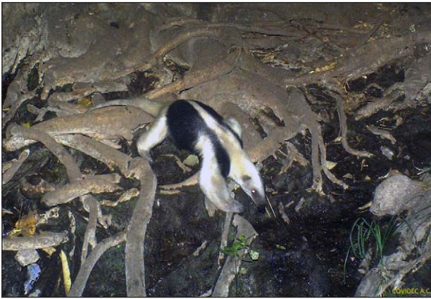
FIGURA 2. Tamandua mexicana capturado mediante fototrampeo en el Cerro Condembaro, municipio de la Huacana, Michoacán (TABLA 1, registro 1).