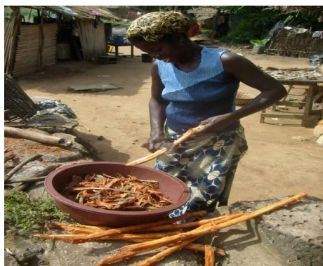
Fig. 4. Médicaments à base de plantes vendus sur la place publique à Nouamou (à gauche) et en préparation à Kotoagnuan (à droite).