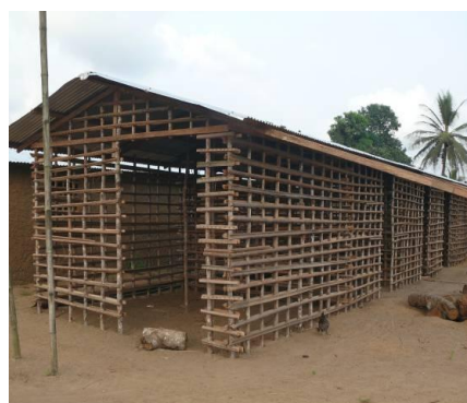
Fig. 5. Habitations finie (à gauche) et en construction (à droite) à base de matériaux provenant de la FMTE