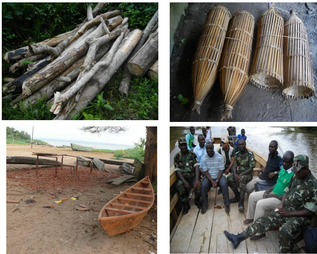
Fig. 2. Quelques formes répandues d'exploitation des ressources biologiques de la FMTE Une réserve de bois de chauffe constituée par un ménage à Kongodjan-Tanoé (en haut, à gauche), Des nasses en raphia et rotin destinées à la pêche à Yao-Akakro (en haut, à droite), Un atelier de fabrication de pirogues à Nouamou (en bas, à gauche), Transport sur la Tanoé assuré par un bateau artisanal (en bas, à droite) (Photos : ZADOU, 2010).

La pêche à la nasse reste, toutefois, la forme d'exploitation la plus pratiquée par les riverains de la FMTE à en juger par le grand nombre de nasses observées dans la FMTE et les ateliers de fabrication dans la plupart des villages riverains. Au total, 87,1% des paysans riverains interrogés sur leurs activités affirment pratiquer la pêche dans la FMTE. Ces enquêtés affirment, en outre, que la pêche est aussi l'une des activités les plus lucratives dans la région. Les produits de la pêche dominés par les poissons du genre Chrysictys (Fig. 3) à Kadjakro seraient destinés à la consommation familiale mais aussi, et surtout, à la vente dans les villages ivoiriens et ghanéens environnants et même dans les grandes villes ivoiriennes et ghanéennes les plus proches. « Cette forêt (FMTE) est une marmite pour nous ». Ces propos du Chef du village de Kadjakro traduisent le fait que les riverains trouvent l'essentiel de leurs moyens de subsistance dans la FMTE. Pour souligner l'importance économique de la pêche, le même chef renchérit : « il y a deux traites dans cette localité, à savoir la traite du café-cacao et celle du poisson ».