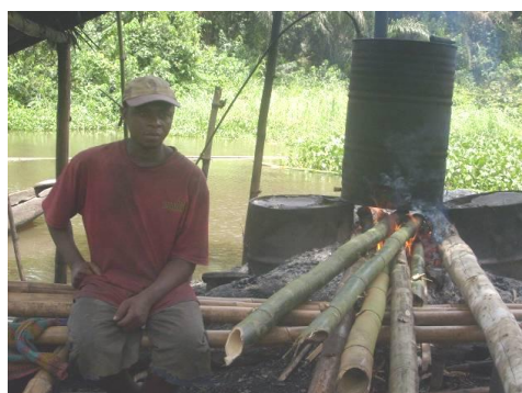
Fig. 6. Site de production du « koutoukou » au bord du fleuve Tanoé (Photo : ZADOU, (2008).