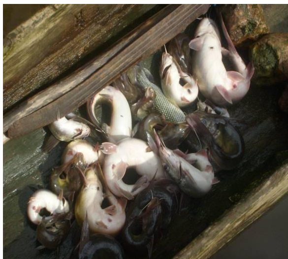
Fig. 3. Produits de pêche dominés par les poissons du genre Chrysictys obtenus à Kadjakro (Photo : ZADOU, 2008).

La majorité des maisons dans les villages riverains de la FMTE sont couvertes par des feuilles de raphia. Les matériaux de construction et d'artisanat proviennent pour la plupart de la FMTE, seule forêt encore bien conservée dans la zone (Fig. 5). Nombreux sont les riverains interrogés qui reconnaissent ne pas avoir les moyens d'acquérir le matériel requis pour la construction de maisons modernes.