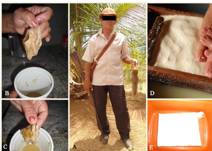
Fig. 4. Caçador com um mocó Kerodon rupestris abatido com o uso de espingarda (A). Coalho do mocó (estômago) ainda com fezes (B e C) para posterior uso em preparo do queijo (D). Queijo pronto pra o consumo e venda (E).

Os depoimentos dos entrevistados evidenciaram que 12 espécies de vertebrados, 8 répteis (9,87%) e 4 mamíferos (4,93%) fornecem produtos que são usados para fins medicinais (Tabela 02). A obtenção dos remédios se dá mediante a utilização de partes dos seus corpos ou produtos extraídos deles (Fig. 6), sendo a banha (gordura) o produto medicinal mais utilizado. Dentre os vertebrados cinegéticos medicinais registrados na área pesquisada, os répteis foram os mais citados.