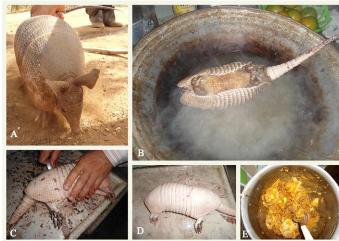
Fig. 3: D. novemcinctus (A) capturado com o uso de cães de caça e etapas de sua preparação para consumo: espécime imerso em água quente (B), para posterior limpeza (C e D) e pronto para o consumo (E).

(Fig. 4). No processo de preparação desse queijo, parte do estômago do mocó é colocada no leite extraído de vacas ( Bos taurus ).