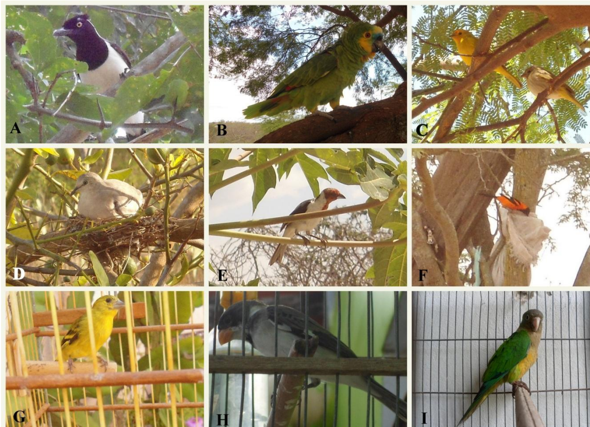
Fig. 5: Exemplo de algumas espécies utilizadas como animais de estimação (A) Cancão C. cyanopogon , (B) Papagaio A. aestiva , (C) Canário da terra S. flaveola , (D) Rolinha branca C. picui , (E) galo de campina P. dominicana , (F) Concriz I. jamacai , (G) Pinta silva S. yarrellii , (H) Golado S. albogularis , (I) Gangarra A. cactorum . Zona rural do município de São João do Cariri (A) e (B, C, D, E, F, G, H, I) Zona rural do município de Cabaceiras.

Dentre os vertebrados silvestres registrados, 63 espécies figuram na lista vermelha de espécies ameaçadas da IUCN [35], sendo que a maioria (n=61) está na categoria pouco preocupante (Least Concern), e 2 delas estão na categoria Vulnerável. São elas “pintassilgo” Sporagra yarrellii e o gato do mato pintado” Leopardus tigrinus . A primeira espécie é considerada ameaçada em razão de sua limitada área de ocorrência atual. A destruição e/ou alteração dos habitats aliada à grande captura para o mercado clandestino de aves silvestres, contribui para a redução populacional da espécie, hoje rara na natureza [43]. Ameaças à L. tigrinus incluem a perda de habitat, fragmentação, estradas, comércio ilegal (animais e peles), e abate como retaliação de predação de aves domésticas [35], como foi registrado no presente estudo. Sporagra yarrellii e Leopardus tigrinus também constam da lista brasileira de animais ameaçados do Brasil [34]