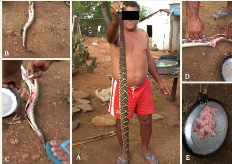
Fig. 6. Exemplar de cascavel ( Crotalus durissus ) capturado (A) e retirada de sua banha (B, C e D) para uso na medicina popular na zona rural do Município de Cabaceiras, Estado da Paraíba, Brasil.

O fato dos homens citarem mais espécies cinegéticas do que mulheres, como foi registrada na área pesquisada, não é surpresa, uma vez que as atividades cinegéticas são frequentemente realizadas por homens na maioria das sociedades, aumentando a chance de que eles utilizem ou conheçam mais recursos cinegéticos e os aspectos etnoecológicos das espécies caçadas [12, 99-109].