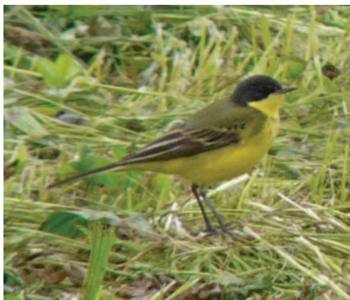
Lavandera boyera Motacilla flava thunbergi . Llanes (Asturias).

Observaciones de la subespecie thunbergi (Escandinavia) cuya presencia es rara durante los pasos migratorios en la parte occidental ibérica. En Asturias, en el tramo de costa Llanes villa-Poo, en 2009 un macho el 30 de mayo y en 2011, siete machos en total: un macho el 19 de abril; un macho del 10 al 19 de mayo; un grupo de cuatro machos el 13 de mayo; y un macho el día 27 de