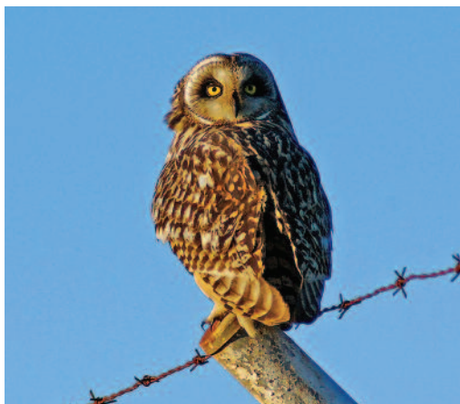
Búho campestre Asio flammeus . La Laguna (Tenerife).