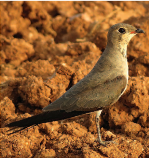
Canastera común Glaucous-winged Noddy . Guadiana del Caudillo (Badajoz).

alguno que aún no volaba, y estimándose que se trataba de tres parejas cuidando uno, dos y dos pollos, respectivamente (B. Rodríguez, G. Tejera y J. M. Martínez). En Tenerife, en el sector llano próximo a la playa del Confital, Granadilla de Abona, un ejemplar visto el 24 y 26 de marzo de 2012 (V. Díaz Delgado).