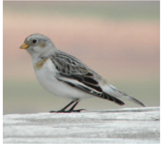
Escribano nival Plectrophenax nivalis . Alcázar de San Juan (Ciudad Real).

Canarias. Dato de nidificación en La Gomera, en localidad dentro de cuadrícula donde se consideraba de reproducción probable (véase Lorenzo, 2007): el 26 de abril de 2012 en Valle Gran Rey se localizan siete nidos emplazados en ramas de varios árboles benjamines Ficus benjamina a alturas entre 3,5 m y 5,5 m; dos de ellos tenían excrementos recientes de pollos, uno estaba en construcción y otro se hallaba abandonado, y se desconoce el estado de los tres restantes (D. Trujillo).