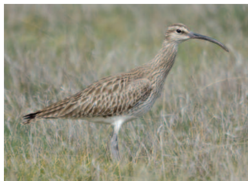
Zarapito trinador Numenius phaeopus . Lagunas de Sentíz de Valdepolo (León).

Canarias. Observación en el norte de Tenerife: un ejemplar en la balsa de La Cruz Santa, Los Reales, el 30 de septiembre de 2012 (D. Trujillo).