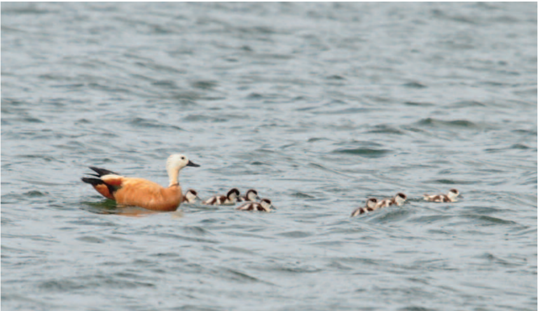
Tarro canelo Tadorna ferruginea . Yaiza (Lanzarote).

Canarias. En Tenerife, ampliación de fechas de estancia del macho presente en la charca de Armeñime, Adeje (véase Ardeola , 59: 169), viéndose nuevamente en este sitio el 25 de marzo de 2012 (V. R. Cerdeña, R. Barone, J. Vizcaíno y M. Fernández del Castillo).