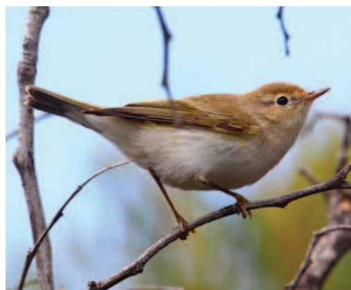
Mosquitero papialbo Phylloscopus bonelli . Tegui (Lanzarote).

Canarias. En Lanzarote, uno cerca del campo de golf de Tegui el 31 de marzo de 2012 (F. J. García Vargas) y de nuevo en ese lugar, uno el 4 de abril de 2012 (J. Sagardía). En Fuerteventura, un