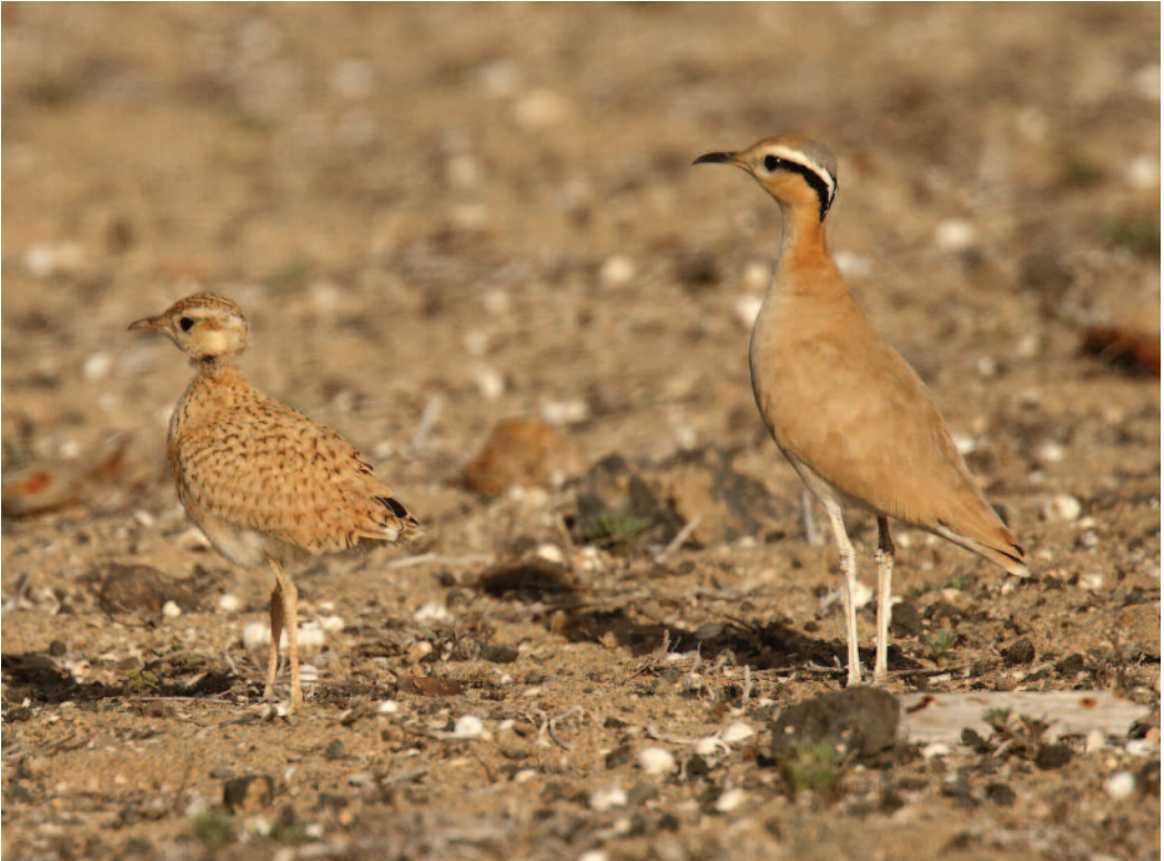
Corredor sahariano Cursorius cursor . Teguisse (Lanzarote).