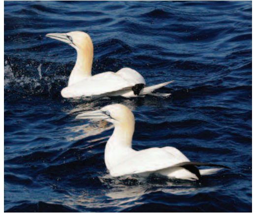
Alcatraz atlántico Morus bassanus . Aguas frente a Mogán (Gran Canaria).

Canarias. Citas de paso prenupcial: en Lanzarote, en aguas frente a Arrecife, tres el 10 de febrero de 2012 y más de 100 ejemplares el 30 de marzo de 2012 y de nuevo más de 100 aves el 16 de abril de 2012 (F. J. García Vargas). Desde el litoral de La Santa, Tinajo, alrededor de 40 ejemplares vistos en paso el 7 de marzo de 2012 (J. Sagardía) y dos aves el 3 de abril de 2012 (F. J. García Vargas), así como uno en Puerto del Carmen, Tías, el 2 de abril de 2012 (F. J. García Vargas). En esta misma isla, un adulto muerto el 12 de marzo de 2012 en la playa del Cochino, Tinajo, así como un grupo de 10, cinco adultos y cinco juveniles, el 28 de marzo de 2012 a dos millas de playa Quemada, Yaiza (G. Tejera). En Fuerteventura, en la playa de Sotavento, en Jandía, Pájara, paso de al menos tres grupos, con diez, siete y nueve aves, respectivamente, la mañana del 5 de abril de 2012 (J. A. Lorenzo). En