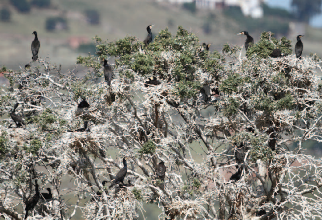
Cormorán grande Phalacrocorax carbo . Embalse de La Serena (Badajoz).