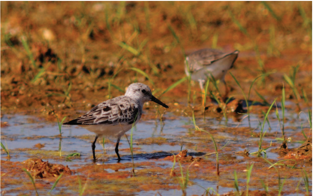
Correlimos tridáctilo Calidris alba . La Haba (Badajoz).

Observaciones en Extremadura en 2012: en Cáceres, uno en la laguna de Galisteo el 19 de abril (M. Alonso), un juvenil en el embalse de Valdecañas el 1 de septiembre (S. Mayordomo), cuatro en el embalse de Portaje, el 27 de abril (S. Mayordomo) y uno el 1 de mayo (S. Mayordomo y E. Palacios); en Badajoz, uno en La Haba el 24 de abril (J. P. Prieto), dos en arrozales de Palazuelo-Campo Lugar, Badajoz-Cáceres, el 1 de mayo y un individuo los días 13 y 21 de mayo (M. Kelsey), y finalmente uno en Esparragalejo el 16 de septiembre (V. de Alba y otros).