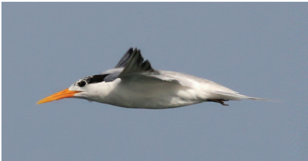
Charrán bengalí Sterna bengalensis . Playa del Chorrillo (Ceuta).

Datos de varios censos en Andalucía: el número de individuos en 2007 fue de 697, repartidos por las provincias andaluzas excepto Cádiz: en Almería se censaron 16, 156 en Córdoba, 232 en Granada, 23 en Huelva, 61 en Jaén, 21 en Málaga y 40 en Sevilla; en 2010 se censaron un total de 803 individuos repartidos en seis provincias: 141 en