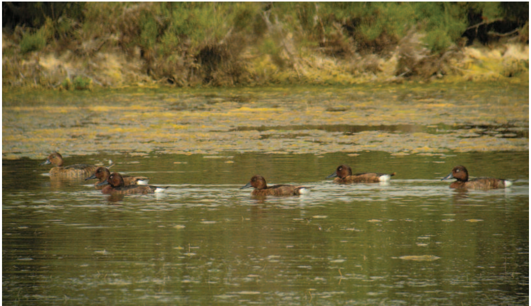
Porrón pardo Aythya nyroca . Salar de los Carros, Vera (Almería).

En la balsa de riego del Soto Mozanaque, Algete, Madrid, una hembra el 9 y 23 de octubre de 2011 (D. González y M. Juan) y de nuevo una hembra el 14 de octubre de 2012 (M. Juan). En El Manantío-Atalaya, Aldea del Cano, Cáceres, la especie está presente de modo continuo entre abril y septiembre de 2012, con un mínimo de un macho y un máximo de cinco ejemplares, cuatro de ellos