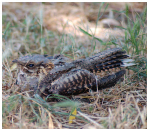
Chotacabras cuellirrojo Caprimulgus ruficollis . Castrotierra de la Valduerna (León).

Observación de un migrante tardío, ya en plena época de reproducción: un ave en el Paraje Natural Desembocadura del Guadalhorce, Málaga, el 2 de junio de 2011 (J. Fregenal y J. A. Cortés).