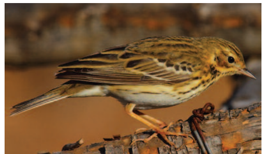
Bisbita arbóreo Anthus trivialis . Tías (Lanzarote).

Un individuo en el cauce nuevo del río Guadaira, Puebla del Río, Sevilla, el 18 de marzo de 2012 (F. Chiclana). Uno en Tapia de Casariego, Asturias, el 3 de mayo de 2012 (M. Quintana y R. Fernández). Uno, posiblemente hembra, en Salave, Tapia, Asturias, el 3 de mayo de 2012 (X. Gayol, M.