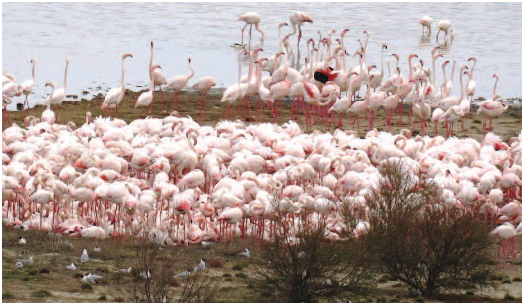
Flamenco común Phoenicopterus roseus . Laguna de Pétrola (Albacete).

Se comprueba la reproducción durante el año 2012 en la laguna de Pétrola, Albacete: se estima un mínimo de 831 parejas reproductoras y un mínimo de 812 pollos nacidos entre finales de mayo (primer nacimiento el día 24) y mediados de junio (último nacimiento el día 16). La especie ya se reprodujo en la laguna de Pétrola durante los años 1999 y 2000, estimándose respectivamente, 98 y 232 parejas, y volando 83 y 212 pollos (J. Picazo). Se cuentan 15 ejemplares en el embalse de Villalba de los Barros, Badajoz, los días 28 (J. Elías) y 31 de julio de 2012 (V. de Alba y A. Núñez). Dos individuos en el embalse de Valdecañas, Cáceres, el 1 de septiembre de 2012 (S. Mayordomo). Ocho ejemplares en el embalse del Salor, Cáceres, el 8