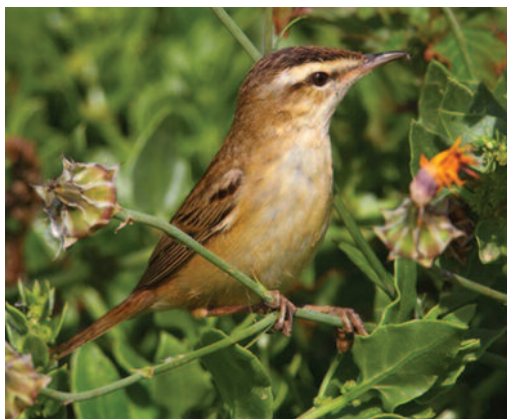
Carricerín común Acrocephalus schoenobaenus . Tegui se (Lanzarote).

Un ave en fechas tempranas y en área urbana, en la zona del camino de los Almendrales, Málaga, el 29 de marzo de 2012 (J. L. Ruz).