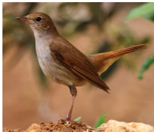
Ruiseñor común Luscinia megarhynchos . San Bartolomé (Lanzarote).

Reproducción en Badajoz: se captura para anillamiento un joven, recién salido del nido, en La Lapa, en una zona de monte mediterráneo, con alcornocal y encinar, el 17 de junio de 2012 (H. Gómez-Tejedor).