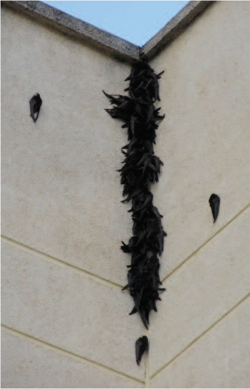
Vencejo común Apus apus . Antequera (Málaga).

anterior, coincidiendo con dicho descenso, se observó a numerosos ejemplares intentando entrar en los estrechos huecos de las ventanas de la cercana urbanización Bellavista (J. Carralero).