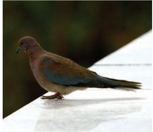
Tórtola senegalesa Streptopelia senegalensis . La Restinga, El Pinar (El Hierro).

Tres parejas en un nido comunal en un eucalipto en Melilla el 13 de agosto de 2012.