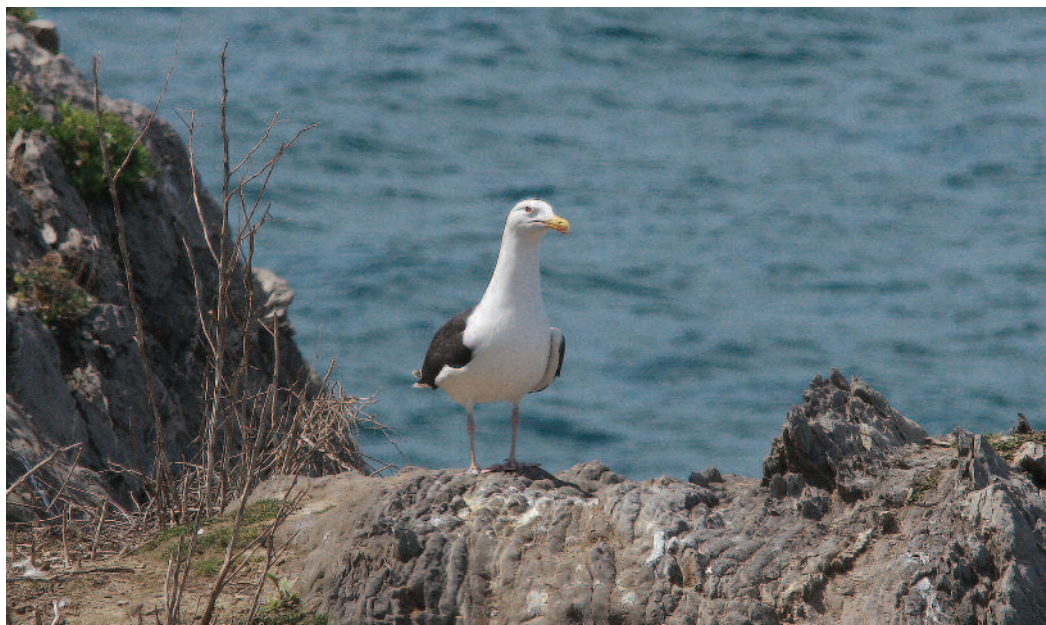
Gavión atlántico Larus marinus . Zierbena (Vizcaya).

alrededores (T. Sanz, M. Novo, B. Prieto y J. D. Hernández). Se avista un ejemplar joven del año en V.R.S.U. de Pinto, Madrid, anillado con PVC y procedente de las colonias de Argelia el 23 de julio de 2012 (J. Marchamalo; véase Baaloudj et al. , 2012).