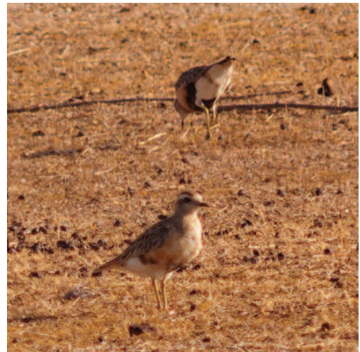
Chormito carambolo Charadrius morinellus . Campanario, La Serena (Badajoz).

Baleares. Uno en el Monte Major, Mallorca, el 9 de septiembre de 2010 (C. Cardona/AOB). En Mallorca, un joven los días 26, 29 y 30 de agosto de 2011 en la albufera de Mallorca (P. Vicens, M. A. Reus, S. Quintanilla, M. Roig y M. A. Dora/AOB); en la misma localidad y seguramente el mismo individuo los días 2 y 3 de septiembre de 2011 (M. G. Painter/AOB). Uno en la sierra de las Figueres, Cabrera, el 3 de septiembre de 2011 (S. Arbona/AOB).