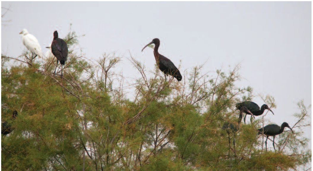
Morito común Plegadis falcinellus . Dos Hermanas (Sevilla).

Doñana (Máñez y Rendón-Martos, 2009) ha buscado otras áreas favorables, como esta laguna, situada cerca de las marismas del Guadalquivir. Se empezaron a ver ejemplares adultos a finales de enero utilizando la isla como dormitorio y su número fue incrementándose progresivamente. En marzo la presencia en el garcero era permanente, y se registraba una gran actividad en la construcción de nidos. A finales de abril se detectaron las primeras puestas. Se estima que nidificaron un mínimo de 250 parejas (sobre tarajes y álamos, aunque también sobre dos pequeños acebuches, una morera y una acacia), habiendo volado varios centenares de pollos. Posteriormente, utilizaron la zona como dormitorio hasta mediados de septiembre. (M. Hernández, M. Máñez, A. Martínez y R. Rodríguez). Una segunda localidad corresponde al humedal catalogado El Pantano, Los Palacios y Villafranca, Sevilla, donde la especie se ha reproducido por primera vez asociándose a garzas imperiales que suelen criar en esta localidad. Las aves utilizaron la zona todo el año como dormitorio, oscilando el número de ejemplares entre 50 y 200. A partir de principios de marzo se observa actividad reproductora, produciéndose las primeras puestas a mediados del mismo mes. Se estima