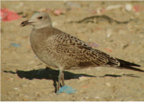
Gaviota de Audouin Larus audouinii . Vertedero de residuos sólidos de Pinto (Madrid).

dez); un ave de tercer verano en los Llanos de Cáceres, el 12 de mayo que corresponde al segundo registro en la provincia de Cáceres (S. Mayordomo y E. Palacios); un ave de segundo año en el Azud de Riobobos, Salamanca, el 25 de mayo (R. Vicente), y en Madrid, en el V.R.S.U. de Pinto, un ejemplar de segundo verano el 18 de mayo y un ejemplar joven del año el 31 de julio (J. Marchamalo), así como un juvenil el 18 de agosto (M. Juan), además otro juvenil pero en el V.R.S.U. de Colmenar Viejo, Madrid, el 25 de agosto (M. Juan).