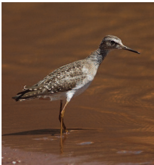
Andarríos bastardo Tringa glareola. Valverde (El Hierro).