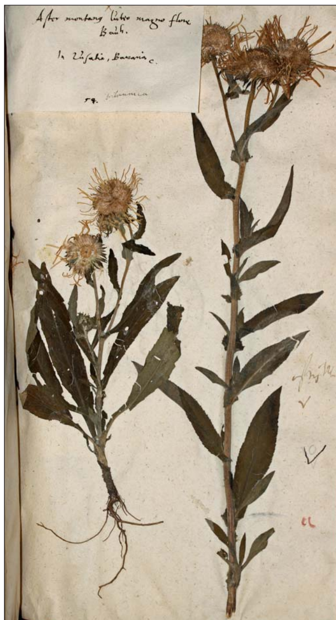
Fig. 2. – Material original de Linne conservado en el Herbario Burser XV(1): 54 (UPS-BURSER).