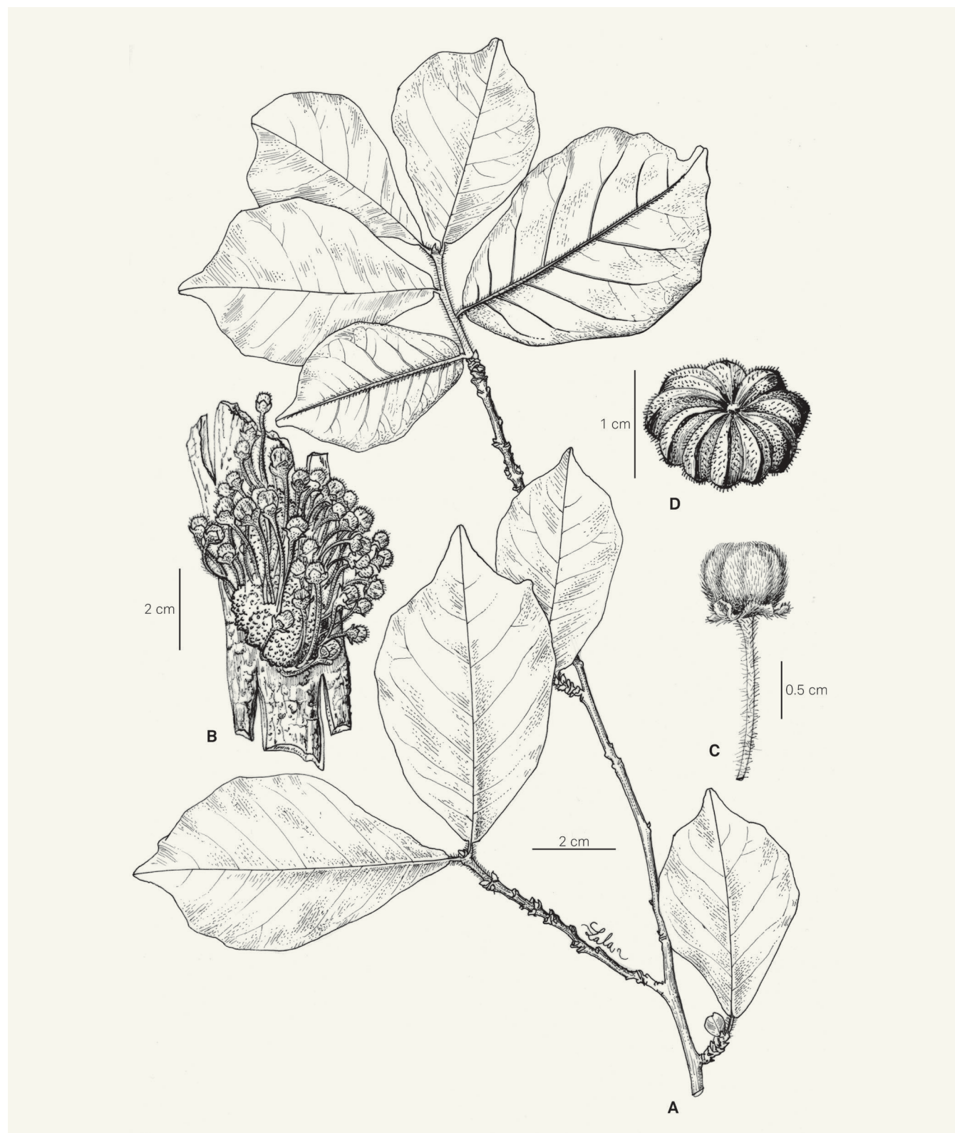
Fig. 2. – Turraea cauliflora J.-F. Leroy & Lescot ex Randrianari. & Callm. A. Rameau; B. Fruits immatures; C. Détail d'un fruit immature; D. Fruit mature.

[ A, D: Randrianarivony et al. 463, TAN; B, C: Service Forestier 22188, TAN] [Dessin: R.L. Andriamiarisoa]