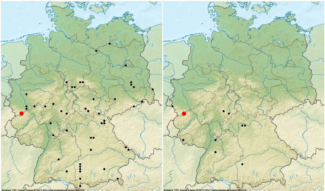
Abb. 3: Verbreitung von Gibbaranea omoeda (links) und Oreonetides quadridentatus (rechts) in Deutschland (Arachnologische Gesellschaft 2017). Die hier dargestellten Nachweise sind rot eingefärbt.