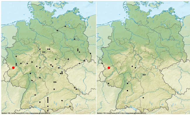
Abb. 2: Lebensraum von Ischyropsalis hellwigii hellwigii und Coelotes atropos