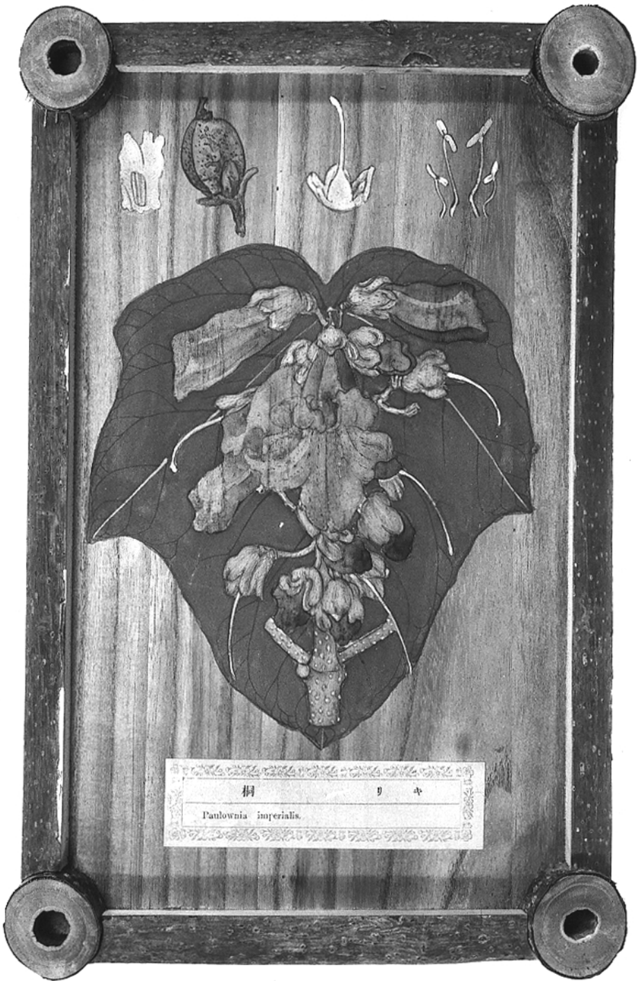
Fig. 1. Paulownia tomentosa (Thunb.) Steud. – anonyme Abbildung auf Paulownia Holz, c. 1875. – Botanisches Museum Berlin-Dahlem.