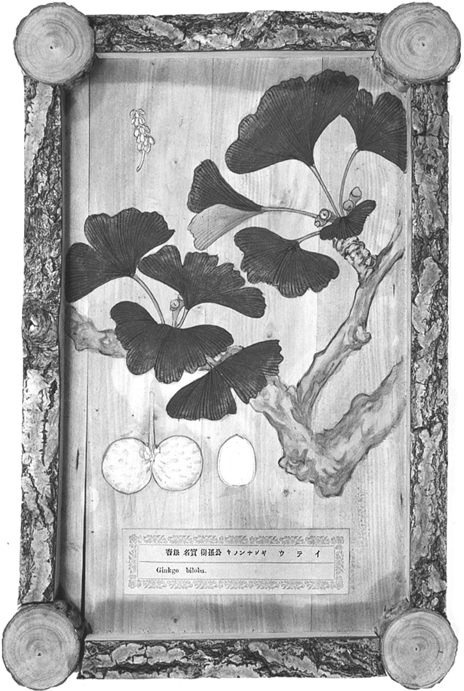
Fig. 2. Ginkgo biloba L. – anonyme Abbildung auf Ginkgo Holz, c.1875. – Botanisches Museum Berlin-Dahlem.