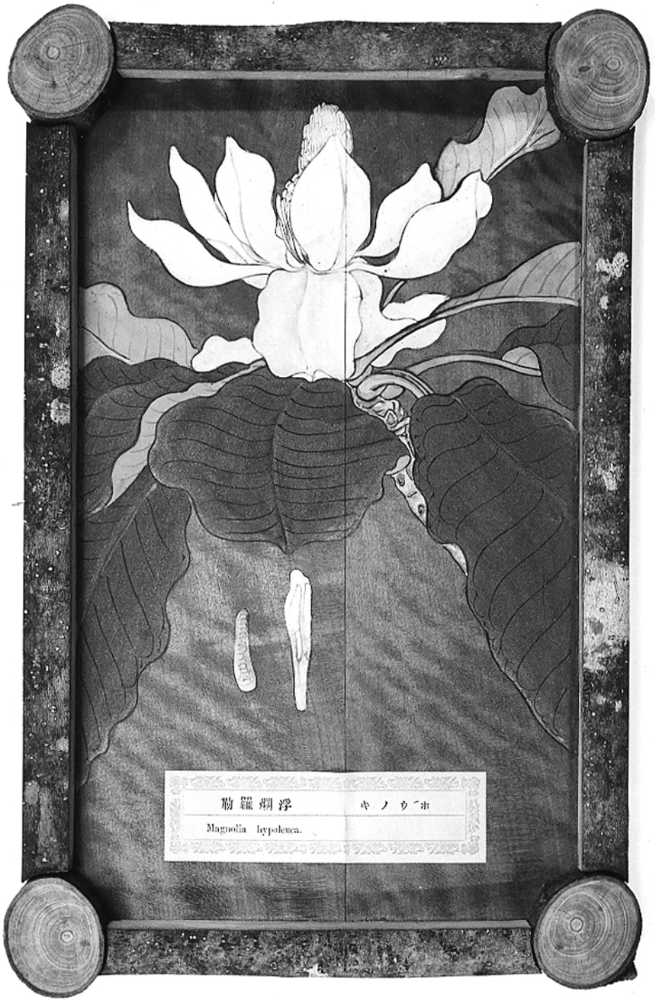
Fig. 4. Magnolia obovata Thunb. – Abbildung nach Keiga Kawahara auf Magnolia Holz, c. 1860 (?). – Botanisches Museum Berlin-Dahlem.