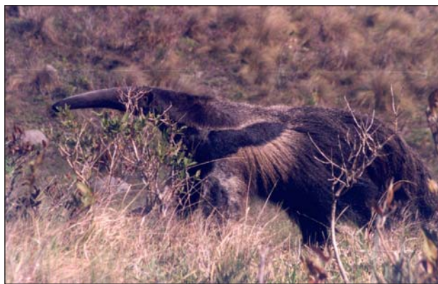
FIGURA 3. Tamanduá-bandeira ( Myrmecophaga tridactyla ) observado na fazenda 4N, município de Pirai do Sul, em setembro de 2002.

Relatos de moradores da fazenda Monte Negro no município de Pirai do Sul, vizinho a Jaguariaíva, informaram que há pouco mais de 15 anos os tamanduás ainda eram avistados regularmente e constantemente mortos por caçadores. Até a década de 1990, os tamanduás-bandeira eram “laçados”, como o gado, pelos fazendeiros e peões para serem fotografados junto às suas famílias. Essa prática deixou