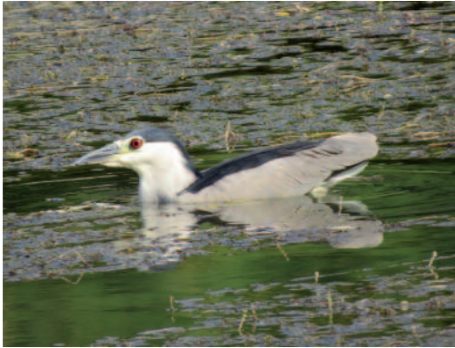
Martinete común Nycticorax nycticorax . Río Bernesga a su paso por la ciudad de León.