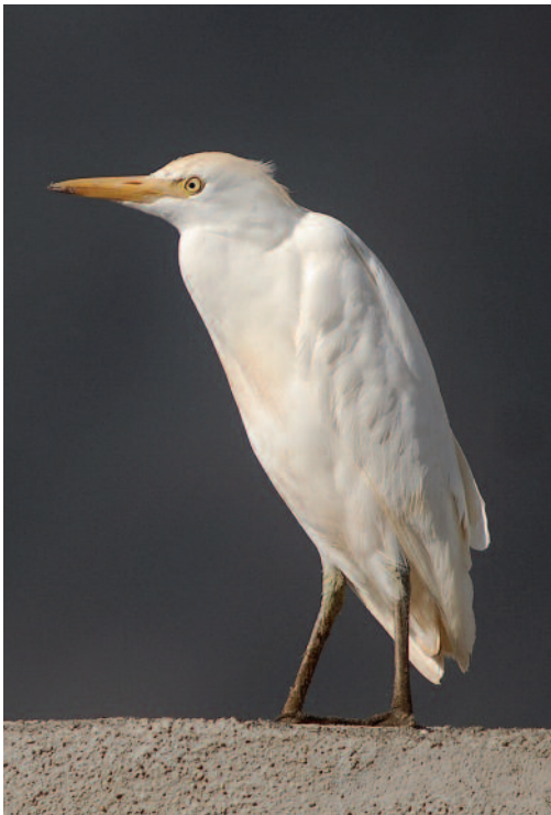
Garcilla bueyera Bubulcus ibis . Frontera (El Hierro).

Canarias. En Tenerife, en granja de vacas en Tejina, La Laguna, se efectúan recuentos que constatan la presencia regular de la especie en números variables entre el 2 de enero y el 6 de mayo de 2013, siendo los máximos de 21 ejemplares el 9 de enero, 15 ejemplares el 16 y de nuevo el 19 de enero de 2013, así como 10 aves el 22 de marzo de 2013, y estando presentes sólo tres ejemplares el 2 de abril y dos el 6 de mayo de 2013 (R. Fernández Febles). En El Hierro: el 30 de octubre de 2007 en la zona baja de Frontera se observa un ejemplar en una granja de cerdos; entre el 5 de noviembre y el 1 de diciembre de