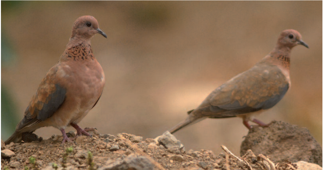
Tórtola senegalesa Streptopelia senegalensis . Frontera (El Hierro).

Huelva-Sevilla (EBD). Un bando de unas 70 aves en el paraje de El Rihuelo, Alfaro, La Rioja, en un sembrado de cebada, el 24 de diciembre de 2012 (V. Fernández).