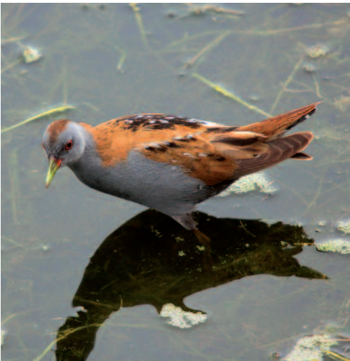
Polluela bastarda Porzana parva. Cala ses Fonts, Parque Natural de la Albufera des Grau, Maó (Menorca).