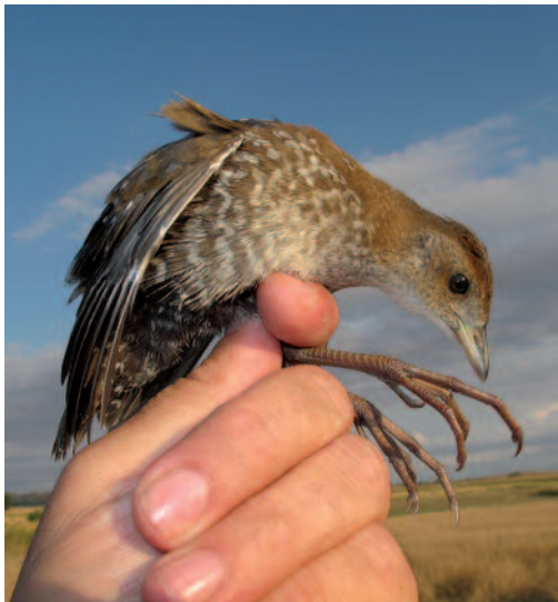
Polluela chica Porzana pusilla . Laguna de Gallocanta (Teruel-Zaragoza).

Confirmación de la reproducción en la laguna de Gallocanta, Teruel-Zaragoza, en 2013: se observa por primera vez un ejemplar el 21 de agosto, se captura un ejemplar juvenil el 26 de agosto y de nuevo se avistan dos juveniles incapaces de volar el 29 de agosto, que por el desarrollo de las primarias deben haber nacido en la zona (C. Pérez Laborda). Además, un juvenil capturado para anillamiento en Tauste, Zaragoza, el 14 de septiembre de 2013 (J. Capdevila y L. Gracia). Un ejemplar en la laguna de la Nava, Palencia, el 27 de abril de 2013 (X. Piñeiro y V. F. Santamaría). Un ave en Platja d'Aro, Girona, el 29 y 30 de abril de 2013 (S. Fernández, R. Matesanz y otros). Reproducción en Aiguamolls de l'Empordà, Girona: numerosas observaciones entre el 3 de mayo y el 24 de agosto de 2013, con un máximo de cuatro ejemplares diferentes y un mínimo de dos polladas detectadas (A. Ollé, R. Gutiérrez, D. Wood,