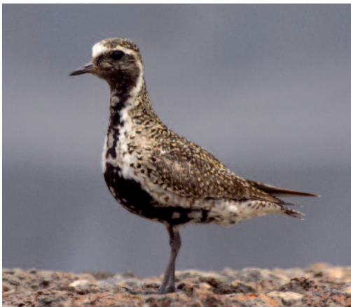
Chorlito dorado europeo Pluvialis apricaria . Tías (Lanzarote).

Canarias. En Tenerife, los días 11 y 17 de agosto de 2013 se vio un adulto en las graveras de Las Galletas, Arona, mostrando una anilla cuya información corresponde a un ejemplar con al menos dos años de edad capturado en la localidad inglesa de Heysham, cerca de Lancaster, Lancashire, el 14 de febrero de 1998; la distancia con el punto de anillamiento es de 3.104 km