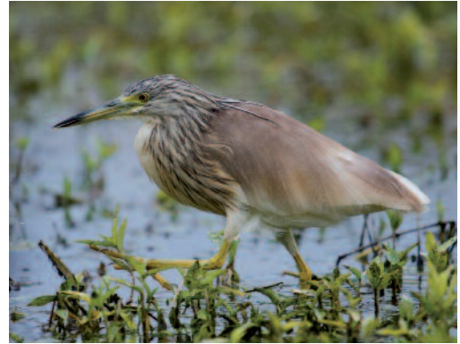
Garcilla cangrejera Ardeola ralloides . La Laguna (Tenerife).

vegetación sumergida, con varios intentos de captura (lanza el pico), sin éxito o capturando presas muy pequeñas, técnica de pesca considerada como rara (Á. Hernández Lázaro; Del Hoyo et al. , 1992). Canarias. En Lanzarote, un adulto, el 2 de junio de 2013 en las instalaciones de la planta depuradora de Arrecife (G. Tejera).