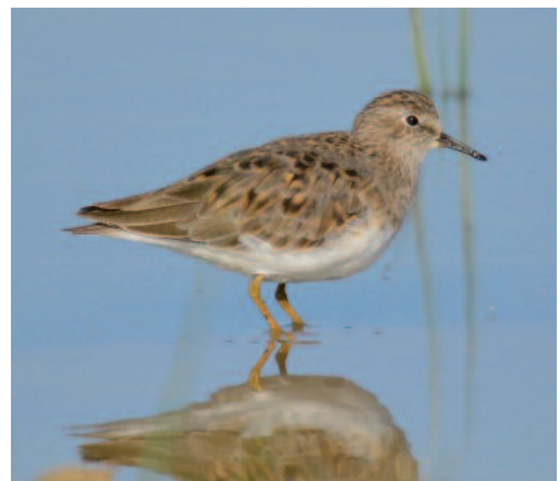
Correlimos de Temminck Calidris temminckii . Villafáfila (Zamora).

Un ave en el R. N. del Tancat de Milia, Sollana, albufera de Valencia, el 9 de marzo de 2013 (Grupo GOTUR/Fundación Global Nature).