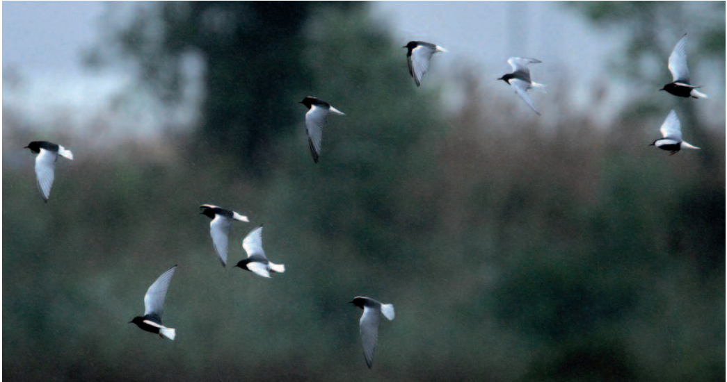
Fumarel aliblanco Chlidonias leucopterus. Delta del Llobregat (Barcelona).