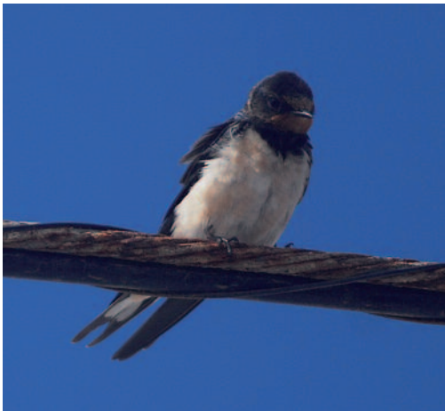
Golondrina común Hirundo rustica . Órzola (Lanzarote).

Canarias. Posible nidificación en Lanzarote: en diversas fechas de primavera y verano de 2013 se observan ejemplares de esta especie en Órzola, Haría, por ejemplo el 3 de mayo dos individuos volando por las calles del pueblo, el 5 de junio cinco aves –tres de ellas posadas en un tendido–, el 5 de julio dos aves en vuelo en el interior de la localidad, y por último el 20 de septiembre se fotografían dos jóvenes y un adulto que permanecen posados durante un tiempo en un tendido; cuando el adulto emprende el vuelo le sigue uno de los juveniles reclamando (D. Trujillo).