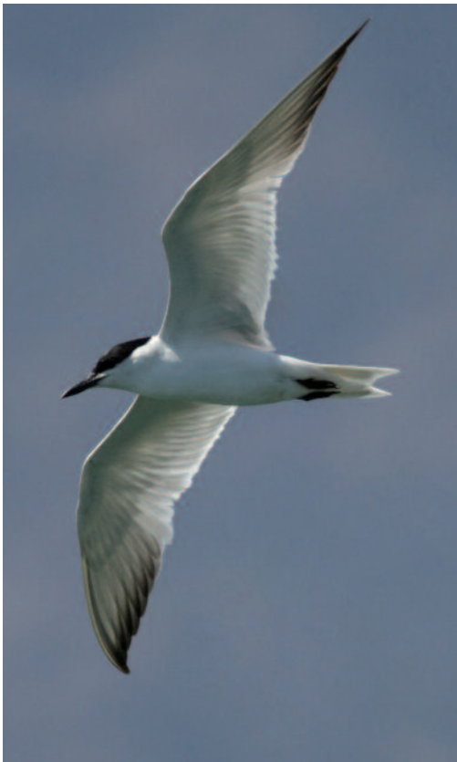
Pagaza piconegra Gelochelidon nilotica . Los Llanos de Aridane (La Palma). Foto: Robert Burton.

Un inmaduro de primer verano en la R. N. del Racó del l'Olla, albufera de Valencia, el 5 de abril de 2013 (J. I. Dies, M. Chardí e I. Ruiz). Un ave de tercer año en la laguna de Pitillas, Navarra, el 10 de abril de 2013 (R. Rodríguez). Un grupo de unas 80 aves frente a la playa de Ca l'Arana, delta del Llobregat, Barcelona, el 16 de abril de 2013 (F. López). Un adulto en Astillero, Cantabria, el 3 de mayo de 2013 (B. García). Un ave de segundo año en la albufera de Valencia, Valencia, el 10 de agosto de 2013 (GOTUR). Un individuo en el azud de Riolobos, Salamanca, los días 29 y 30 de septiembre de 2013 (A. Ceballos, M. Rodríguez).