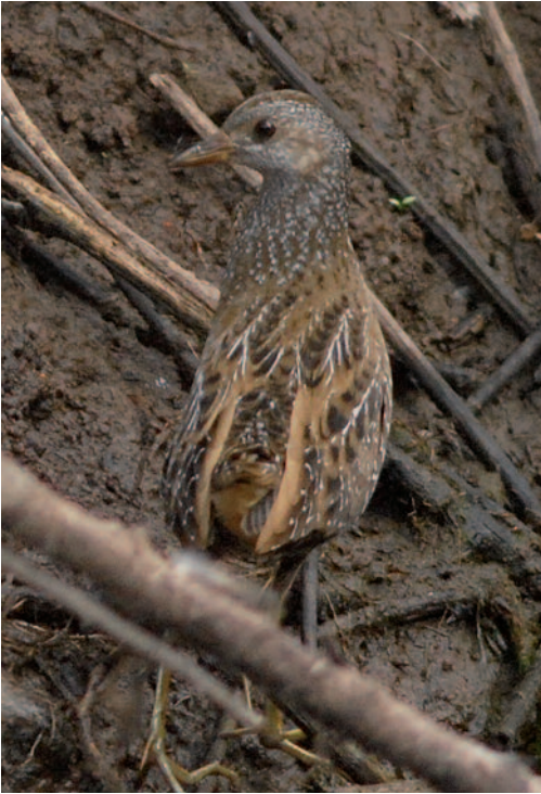
Polluela pintoja Porzana porzana . Agulo (La Gomera).