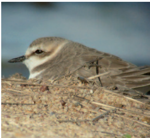
Chorlitejo patinegro Charadrius alexandrinus . Arrozales de Santa Amalia (Badajoz).

Se cuentan 103 ejemplares agrupados en Isla Menor, Puebla del Río, Sevilla, el día 10 de febrero de 2013 (F. Chiclana).