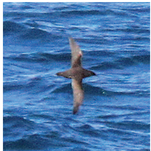
Pardela sombría Puffinus griseus . Puerto de Barcelona.

Mínimo de 88 nidos en tres subcolonias en el embalse de Alange, Badajoz, en junio de 2013 (L.