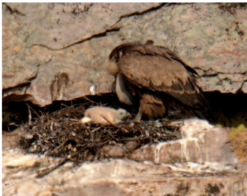
Buitre leonado Gyps fulvus . Parque Nacional. de Monfragüe (Cáceres).

Baleares. En Mallorca se confirma la cría por primera vez en Baleares con la localización de cuatro nidos con adultos incubando en la sierra de Tramuntana, Escorca, el 12 de marzo de 2012 (M. Rebassa y J. Muntaner/AOB). De los cuatro pollos nacidos, uno muere al poco tiempo de nacer (J. J. Sánchez/AOB). En Eivissa, varias citas