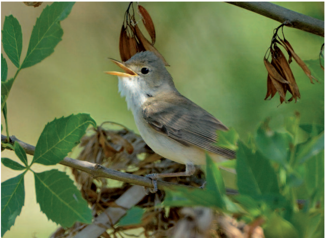
Zarcero bereber Iduna opaca . Río Guadiana, azud de Badajoz (Badajoz).

En el azud del Guadiana, Badajoz: un macho territorial los días 27 y 28 de mayo (J. C. Paniagua), tres machos en junio de 2013 (A. Fernández, J. C. Paniagua, S. Mayordomo y E. Palacios) y un adulto y un joven capturados para anillamiento el 10 de agosto de 2013 (Á. T. Mejías, I. Jerez, J. L. Bautista y P. Herrador). En el río Guadiana, Mérida, Badajoz, en 2013: al menos dos machos con canto territorial, con citas los días 13 de mayo (S. Pérez Gil), 14 de mayo (L. Alcántara, M.