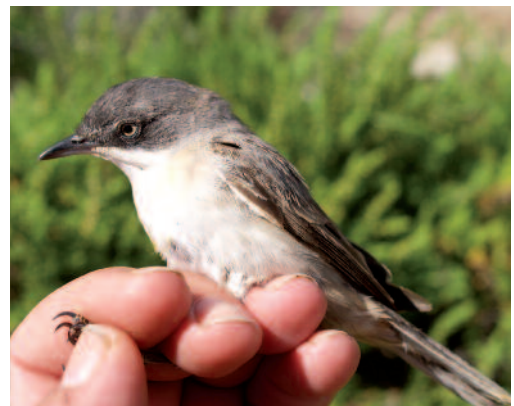
Curruca mirlona Sylvia hortensis . Isla del Aire, Sant Lluís (Menorca).

Canarias. En Lanzarote, un ave en el campo de golf de Tías el 1 de septiembre de 2013 (F. J. García Vargas).