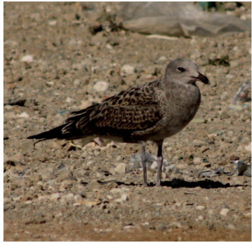
Gaviota de Audouin Larus audouinii . Vertedero de Pinto (Madrid).

Se cifra en 800 parejas la población reproductora en la isla de Alborán, Andalucía, en la temporada 2013 (CMAOT-Junta de Andalucía). Dos aves, adulto y un ave de segundo año en el embalse de Villalba de los Barros, Badajoz, los días 1 y 2 de junio de 2013 (J. A. Román, A. Núñez, F. Montaña, J. Leal y L. Alcántara). Se observa un ave de tercer año en el barrio de la Peña, en la ría del Nervión, Bilbao, del 11 al 24 de junio de 2013, que portaba anilla correspondiente a un pollo anillado en la colonia de la isla del Molí, delta del Llobregat, Barcelona, el 16 de junio de 2011 (J. M. Domínguez y J. L. Pacheco). Un ave de tercer año en Madrid-Río, Madrid, el 16 de julio de 2013 (M. Fernández-Lamadrid). Un juvenil en el embalse de Ahigal, Cáceres, del 22 al 24 de julio de 2013 (J. C. Paniagua, R. Montero y S. Mayordomo). Un juvenil en el vertedero de Pinto, Madrid, el 26 de julio de 2013 (J. Marcha-