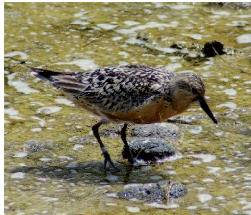
Correlimos gordo Calidris canutus . Arona (Tenerife).