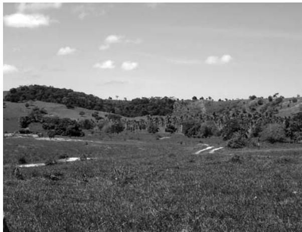
Figura 2. Desmatamento de fragmento de Mata Atlântica (Município de Santa Luzia do Itanh).SE).

As ações de fiscalização dos órgãos municipais, estaduais e federais de proteção ao meio ambiente (Instituto Brasileiro do Meio Ambiente - IBAMA, Secretaria de Meio Ambiente e Recursos Hídricos - SEMARH, Administração Estadual do Meio Ambiente - ADEMA) nos dois estados ainda são incipientes e incapazes de conter o processo de destruição das matas, e boa parte da população humana é indiferente às questões relacionadas com a conservação dos remanescentes florestais. Atualmente, ações isoladas vêm contribuindo para a proteção de algumas áreas de mata e iniciativas voluntárias de associações de moradores têm mobilizado comunidades e alguns fazendeiros. Entretanto, essas ações ainda carecem de apoio, incentivo e, no caso dos proprietários rurais, de orientação para que oficializem a proteção de seus fragmentos florestais através da criação de Reservas Particulares do Patrimônio Natural (RPPNs). As RPPNs são atualmente as UCs que oferecem a melhor condição de proteção à espécie, cinco delas estão situadas na Bahia - Lontra (município de Entre Rios), Panema (município de Mata de São João), Peninha e São Joaquim da Cabonha (município de Cachoeira), Cajueiro (município de Esplanada), e duas recém criadas no Sergipe