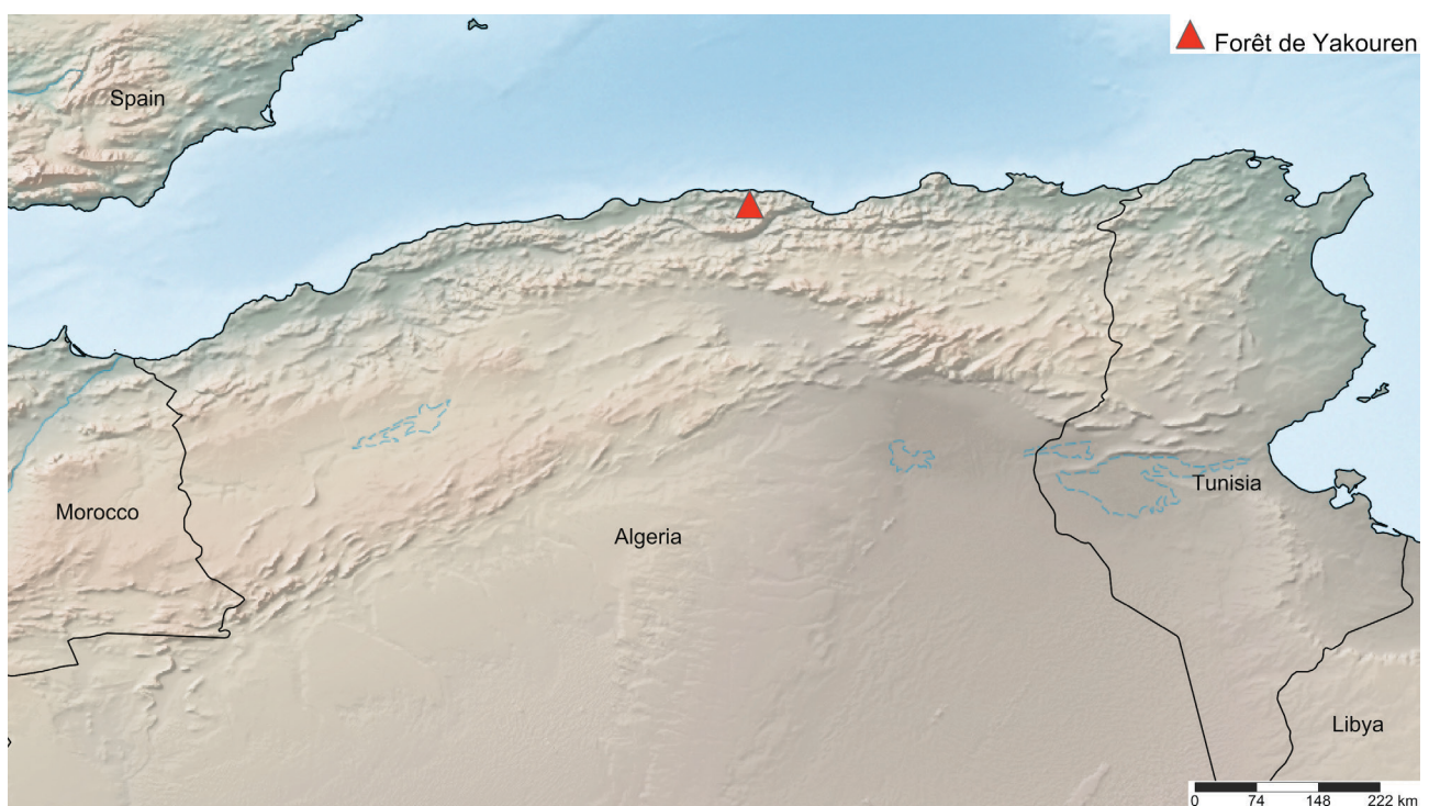
Fig. 1. Situation géographique du massif de Yakouren (Shorthouse, 2010).

La présente étude a été menée au sein du massif forestier de Yakouren (centre nord de l'Algérie ; wilaya de Tizi-Ouzou) dénommé également massif forestier de Béni Ghobri. D'une superficie de 6939 ha (Bouedja & Abdelhakim, 2013), Yakouren se présente généralement sous forme de futaie dense à sous-bois peu développé et composée de chênes mixtes : chêne afarès Quercus afares Pomel, chêne zéen Q. canariensis Wild, chêne-liège Q. suber L. et chêne faginé Q. faginea Lam. (Bouedja & Abdelhakim, 2013 ; Haddar et al. , 2016). L'aire d'étude choisie (WGS (84) 36.7556, 4.41384) a une superficie d'environ 4134 m 2 et présente un relief peu accidenté (5 % de pente), comprise entre 700 et 860 m d'altitude (Fig. 1). La pluviométrie annuelle est de