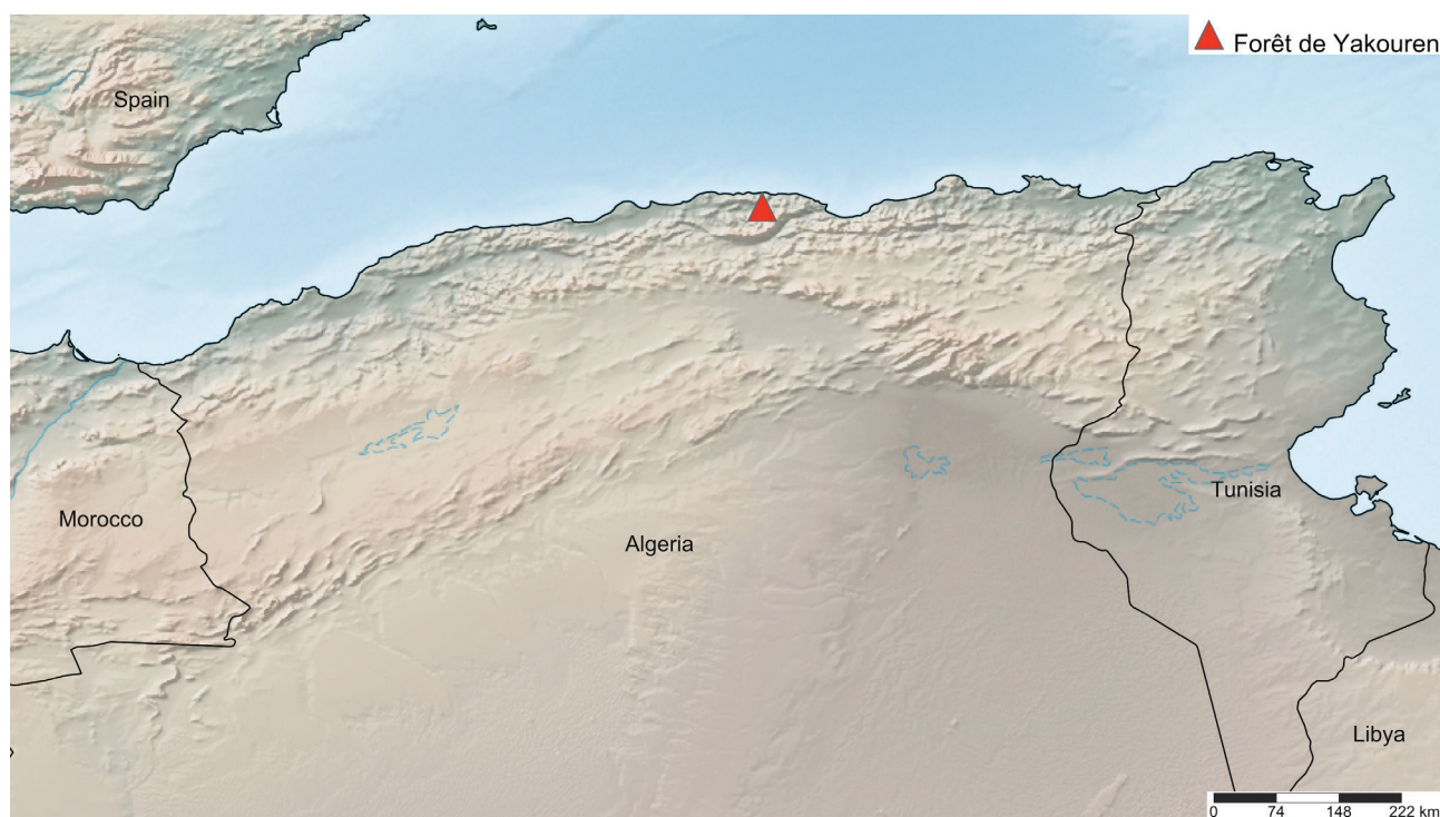
Fig. 1. Situation géographique du massif de Yakouren (Shorthouse, 2010).

La présente étude a été menée au sein du massif forestier de Yakouren (centre nord de l'Algérie ; wilaya de Tizi-Ouzou) dénommé également massif forestier de Béni Ghobri. D'une superficie de 6939 ha (Bouedja & Abdelhakim, 2013), Yakouren se présente généralement sous forme de futaie dense à sous-bois peu développé et composée de chênes mixtes : chêne afarès Quercus afares Pomel, chêne zéen Q. canariensis Wild, chêne-liège Q. suber L. et chêne faginé Q. faginea Lam. (Bouedja & Abdelhakim, 2013 ; Haddar et al. , 2016). L'aire d'étude choisie (WGS (84) 36.7556, 4.41384) a une superficie d'environ 4134 m 2 et présente un relief peu accidenté (5 % de pente), comprise entre 700 et 860 m d'altitude (Fig. 1). La pluviométrie annuelle est de